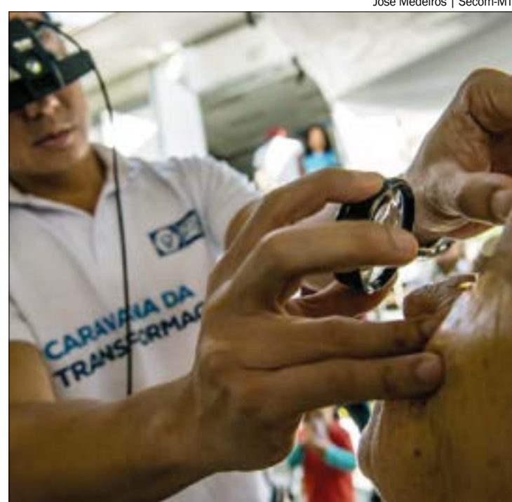
MPF apura possibilidade de desvios em contratos da Caravana da Transformação

“Resolve converter a supramencionada notícia de fato em inquérito civil, tendo por objeto apurar possível desvio de recursos federais no pagamento de serviços de diagnóstico e cirurgia em pacientes com catarata, no âmbito da “Caravana da Transformação”, conforme constatado no Relatório de Auditoria 0056/2018 da CGE/MT”, diz o documento.