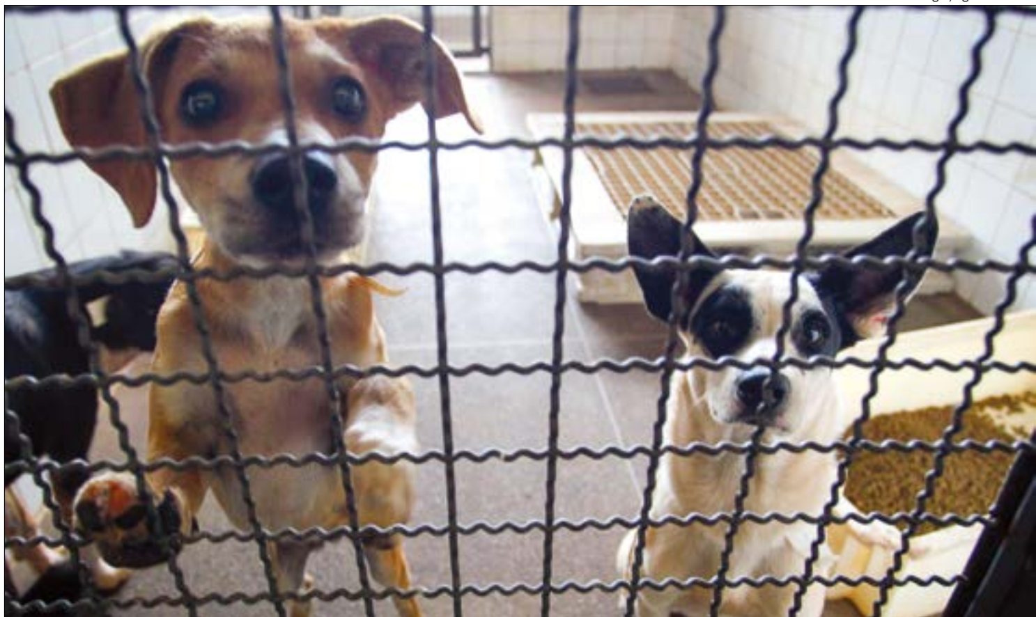
A ideia do santuário surgiu neste ano, para ajudar três ONGs diferentes que passam por dificuldades financeiras