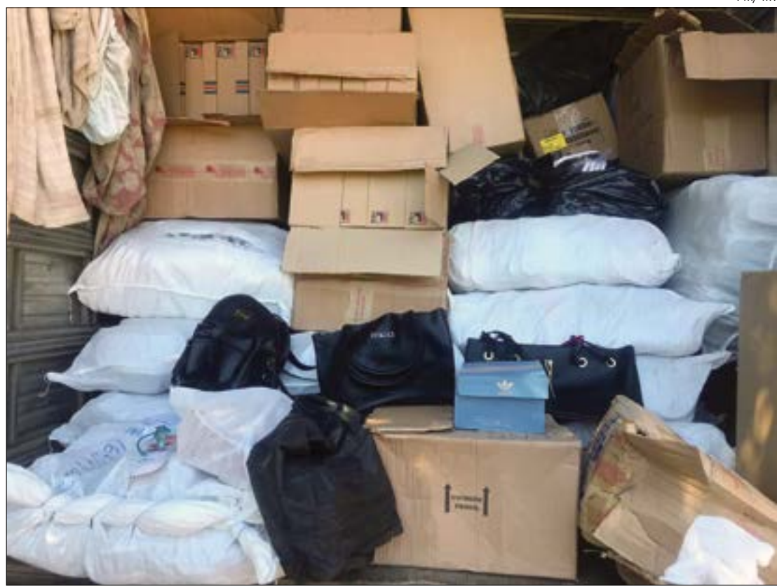
Durante patrulhamento, os policiais flagraram o caminhão estacionado e três homens colocando caixas dentro do veículo

Os policiais encaminharam os materiais até o Posto Fiscal Flávio Gomes, onde foram entregues e ficaram sob a custódia do fiscal de tributos estadual para serem tomadas as demais providências. Após contabilizar e identificar todo o material, o trio foi levado para a Central de Flagrantes para ser confeccionado o boletim de ocorrência.