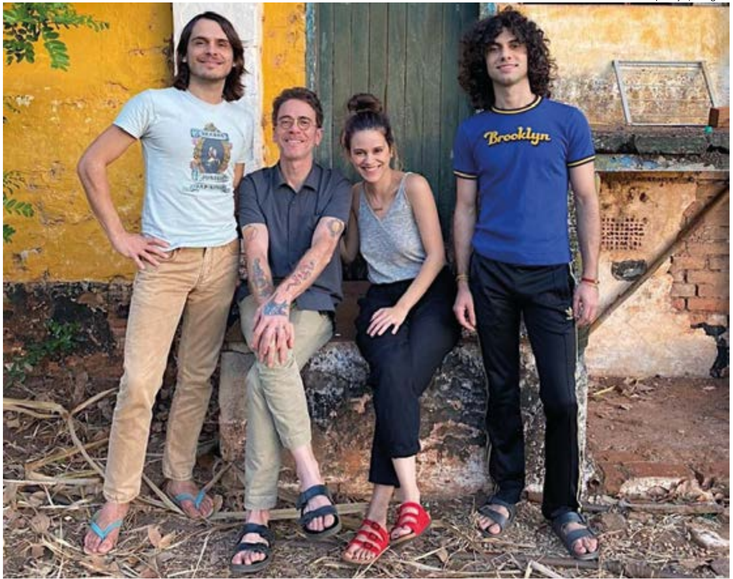
Nando Reis fará a live ao lado de seus filhos, que o pressionaram pelo show em família

O que será que a família Reis está preparando? Vamos torcer para que cantem aqueles sucessos que todos temos na ponta da língua, como “All Star”, “O Segundo Sol”, “Pra Você Guardei o Amor”, “Relicário”, “Por Onde Andei” e muito mais. Quem segue o músico nas redes sociais já teve um gostinho do que vem por aí, já que ele tem divulgado os ensaios do grupo.