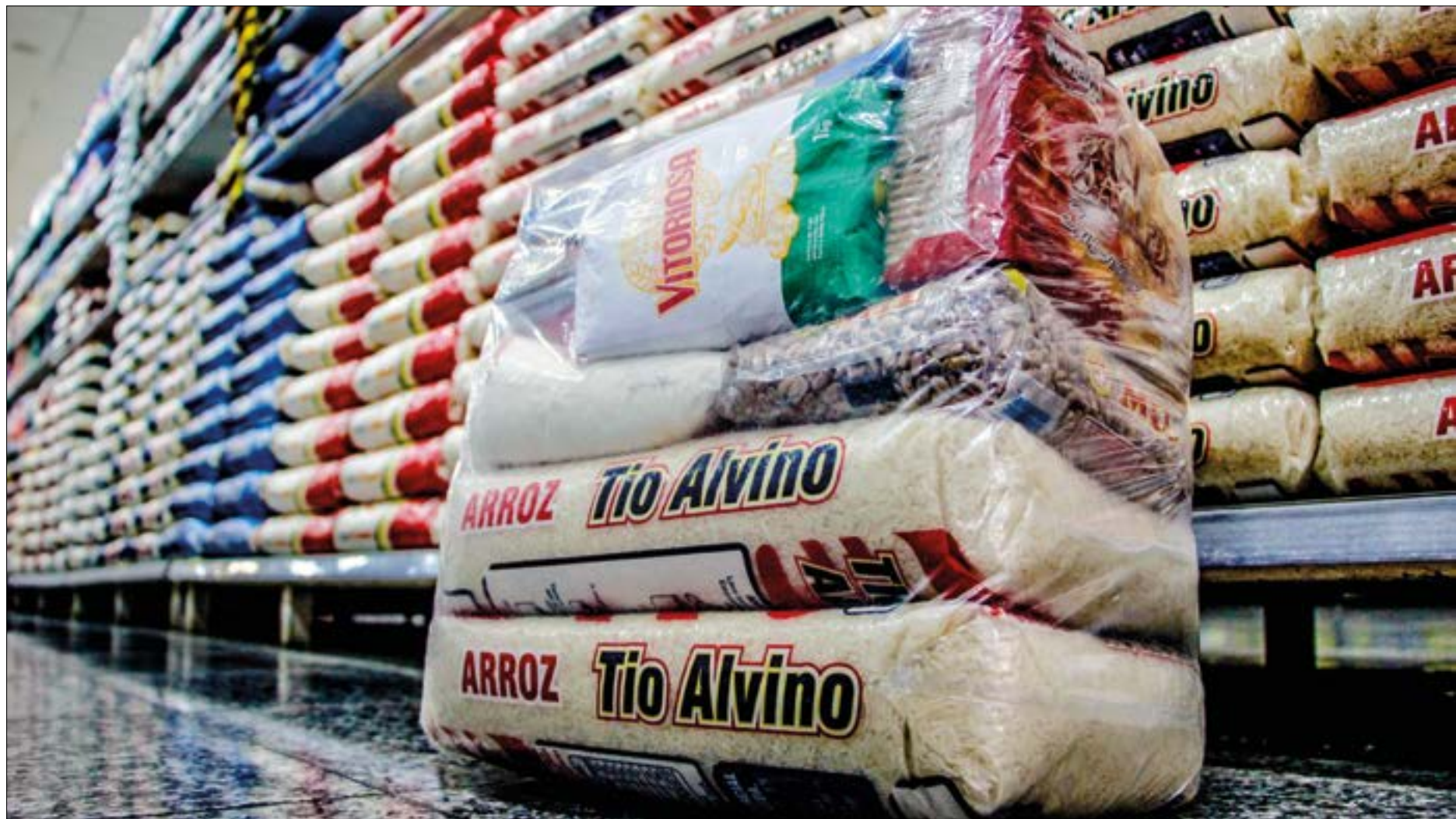
A cesta básica teve redução de R$ 23,00 no valor em Cuiabá por conta do tomate e da batata

O alívio no bolso do consumidor ocorreu por efeito do recuo nos preços do tomate (-24,5%) e da