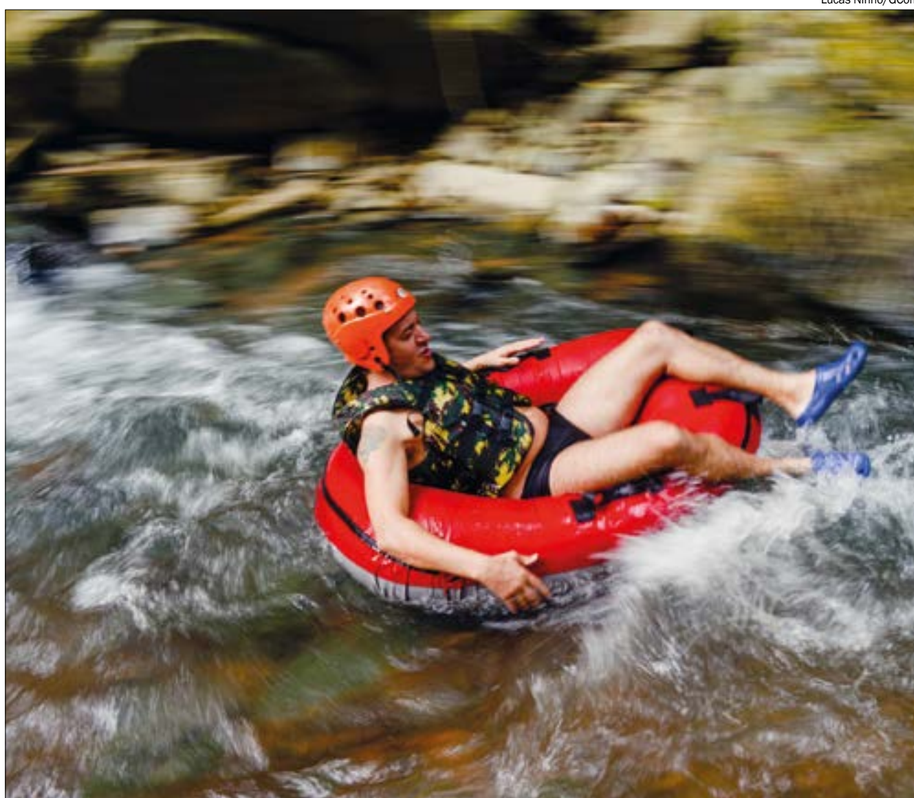
O retorno não abrangerá todos os atrativos turísticos e em alguns só irão atender com agendamento