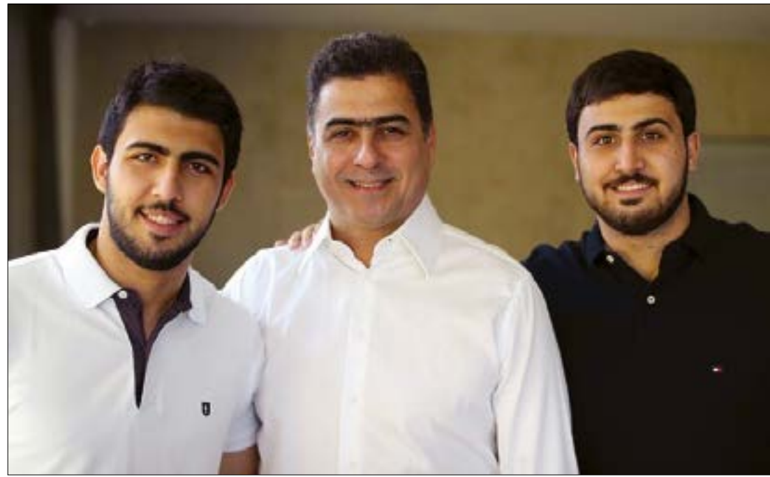
Prefeito de Cuiabá Emanuel Pinheiro e seus filhos, o deputado federal Emanuel Pinheiro Neto e Elvis Pinheiro