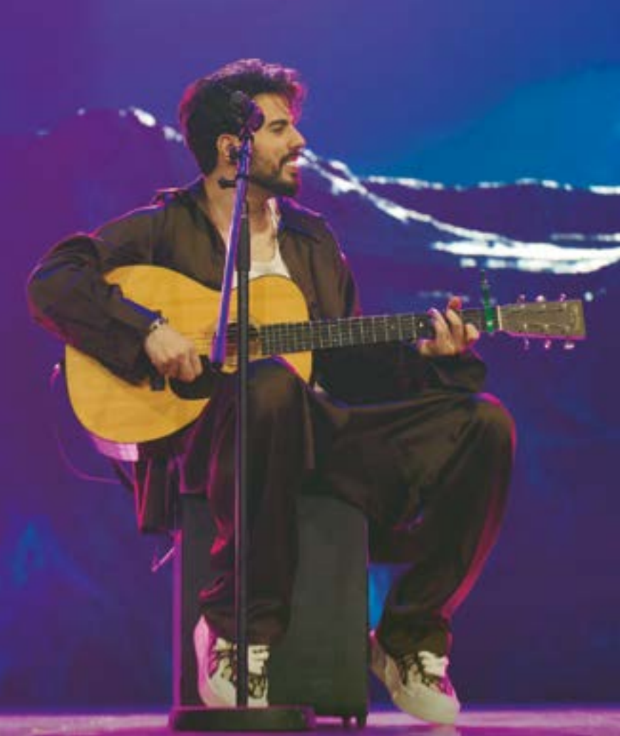
Com ingressos esgotados, Raffa Torres grava novo DVD em São Paulo