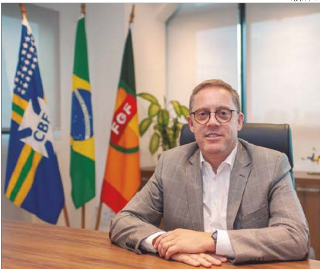
Hocsman tem chegada prevista o Mato Grosso na próxima segunda-feira, 2 de junho

A CBF, porém, alerta para os riscos dessa nomeação. Em sua petição, a Confederação argumenta que a decisão judicial, apesar de compreender a