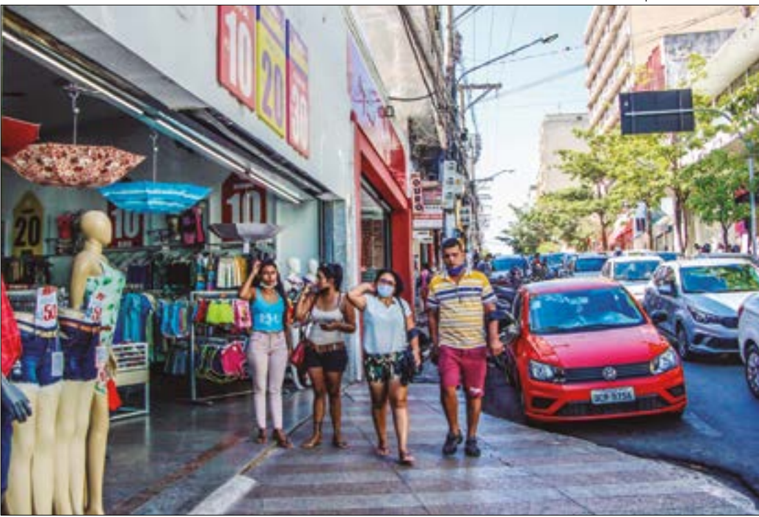
Escalada nos preços de produtos essenciais segue minando a disposição de compra dos cuiabanos

Outro ponto que reforça o cenário de pessimismo é a desaceleração do setor de serviços, um dos principais termômetros para o Banco Central na definição da taxa básica de juros (Selic). A inflação dos serviços caiu de 0,62% em março para