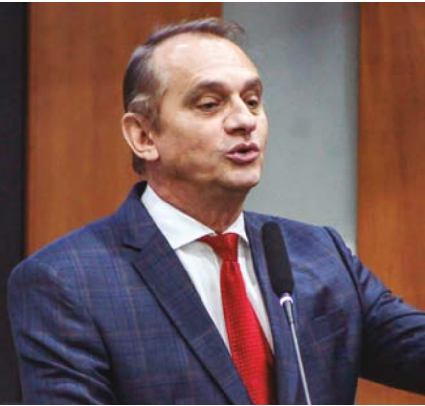
Segundo Wilson, Estado fica com o percentual de 7,8% sobre os empréstimos consignados