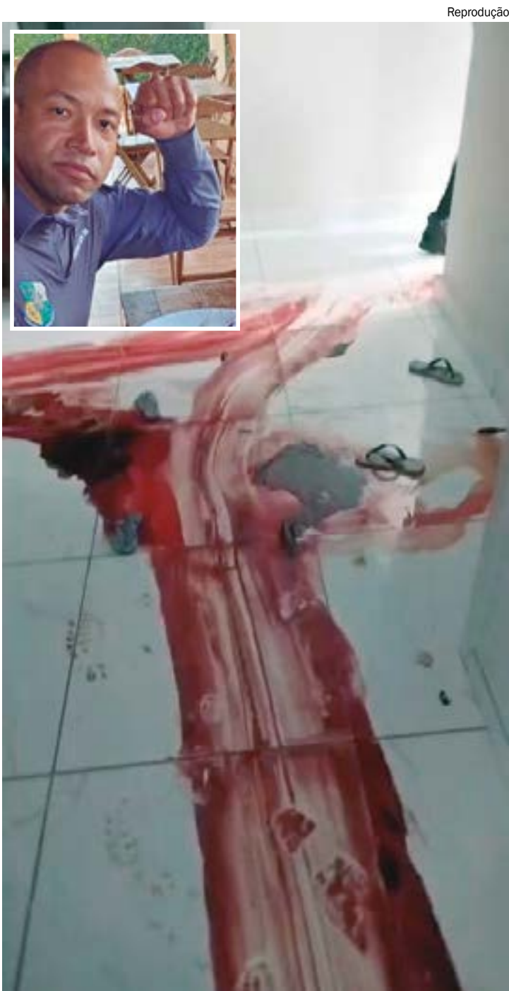
Casa de Gabriele apresentava rastros de sangue e família aponta indícios de tortura antes de assassinato

“Aí ele a abraçou e aí acho que aquele ar de ciúmes, de ciumento doentio cresceu, não sei o que aconteceu e ele puxou a arma para os primos e falou algumas coisas, asneiras, loucuras e os primos ficaram revoltados com ele e naquela mesma noite eles saíram para