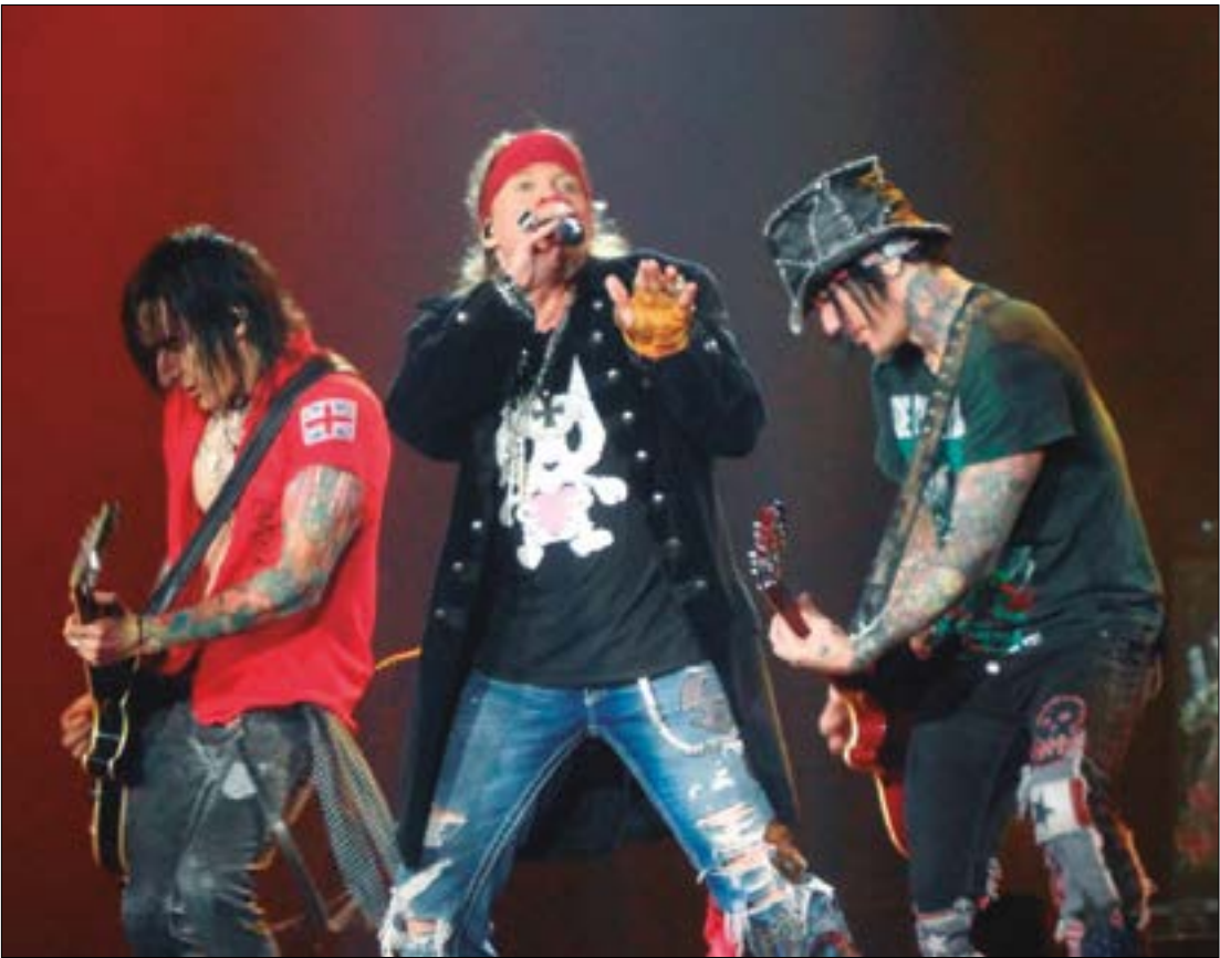
Secretário confirmou que está em fase final de acertos para o show da banda Guns N' Roses em Cuiabá

Com quase quatro décadas de estrada, a banda continua arrastando multidões por onde passa, a atual turnê marca o retorno aos palcos com par-