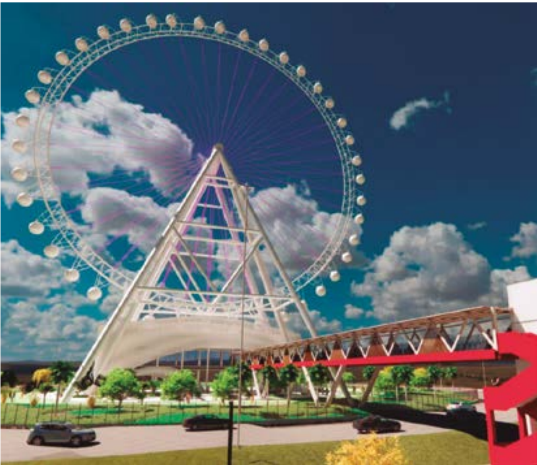
Primeiras peças que chegaram incluem placas de base e insertes, que serão instalados na fundação

A roda gigante terá 42 cabines que carregam entre 6 e 8 pessoas por vez e cada giro na roda leva entre 30 e 35 minutos.