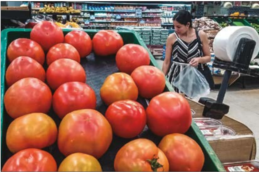
Gilberto Leite | Estadão Mato Grosso

“Apesar do alívio apresentado nesta semana, itens como o café e a manteiga apresentaram aumento, pressionando o custo do café da manhã das famílias cuiabanas”,