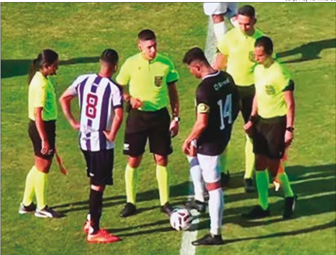
Tanto o Luverdense quanto o Mixto conquistaram vitórias fundamentais para suas campanhas

No segundo tempo, o Mixto administrou a vantagem e ampliou o placar aos 32 minutos. Geovani sofreu pênalti em contra-ataque rápido e converteu, selando a vitória por 3 a 1. Com o resultado, o Tigre da Vargas chegou a nove pontos e entrou no G-4 da chave, assumindo a quarta posição.