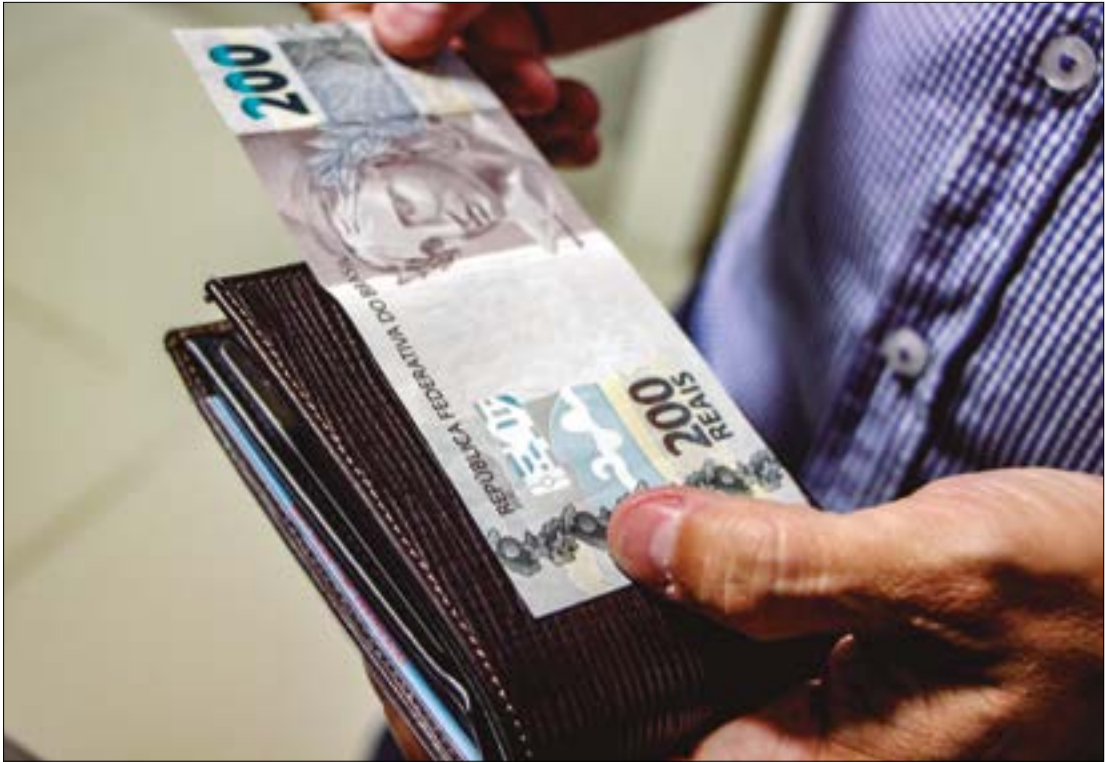
Governo fez reunião de emergência para discutir o IOF após fortes críticas do mercado financeiro

“Este é um ajuste na medida – feito com equilíbrio, ouvindo o país e corrigindo rumos sempre