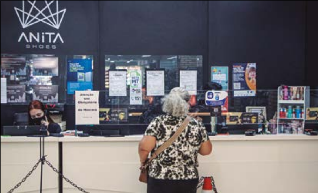
Cenário de incerteza atrapalha o planejamento das empresas e compromete a confiança dos empresários

Outro ponto criticado pela CDL Cuiabá é a tentativa de alteração repentina da tributação sobre remessas para investimentos e aplicações de fundos no exterior. Embora revista parcialmente, a iniciativa demonstra, segundo Macagnam, que o governo federal “está improvisando” com a política fiscal. “Essa instabilidade afeta a ima-