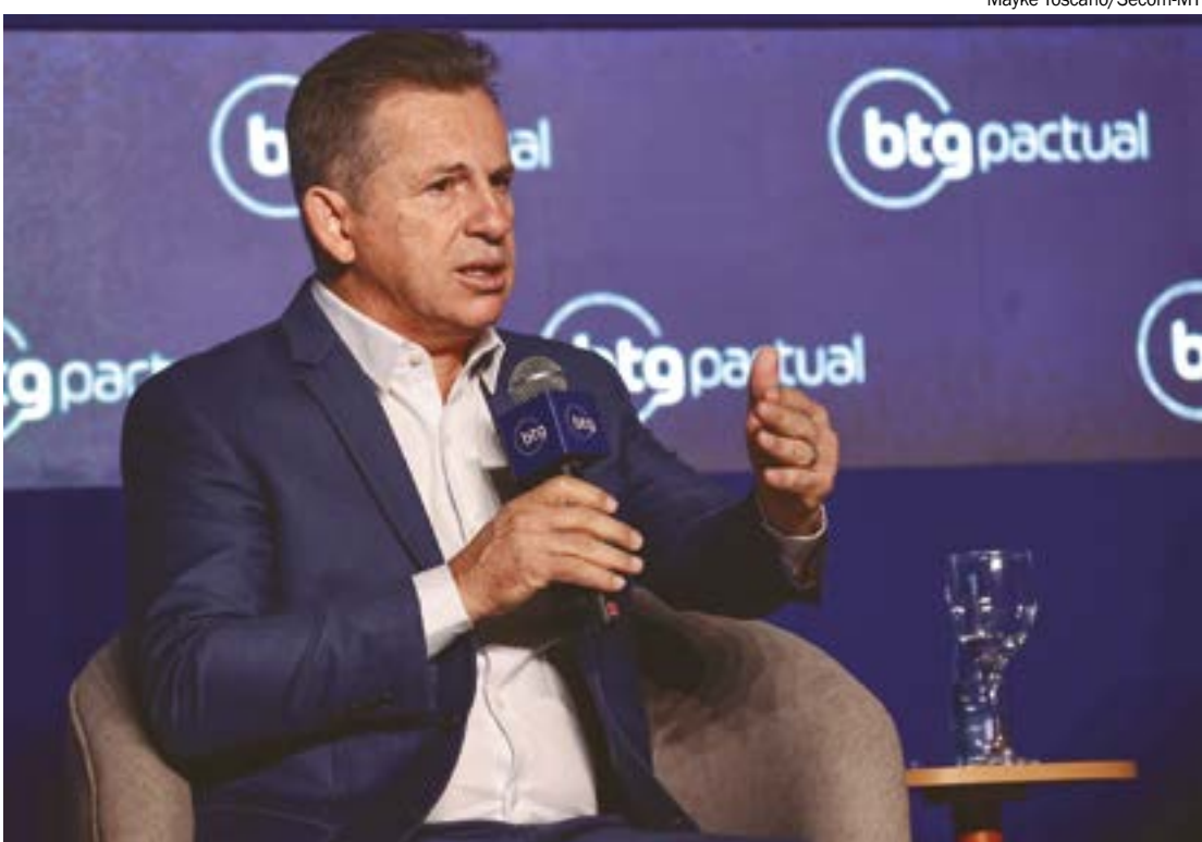
Governador diz que iniciativa de pedir a investigação nos consignados surgiu após denúncias de fraudes no INSS

Além disso, há registro de empréstimos feitos aci-