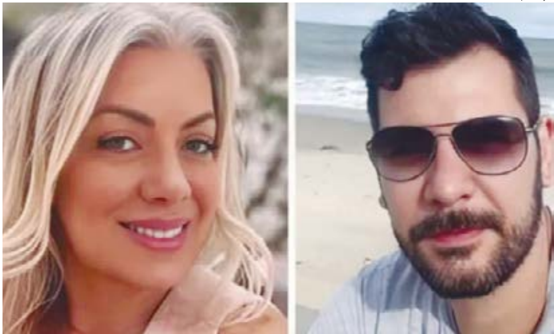
Casal de empresários é investigado por calote contra mais de mil estudantes de 40 turmas de cursos superiores

A empresa, que encerrou suas atividades em Cuiabá no mês de janeiro deste ano, recebeu valores de centenas de formandos e seus familiares e deixou de cumprir os contratos, deixando diversas vítimas que tiveram seus sonhos destruídos, ficando sem suas celebrações de colação de grau e formatura.