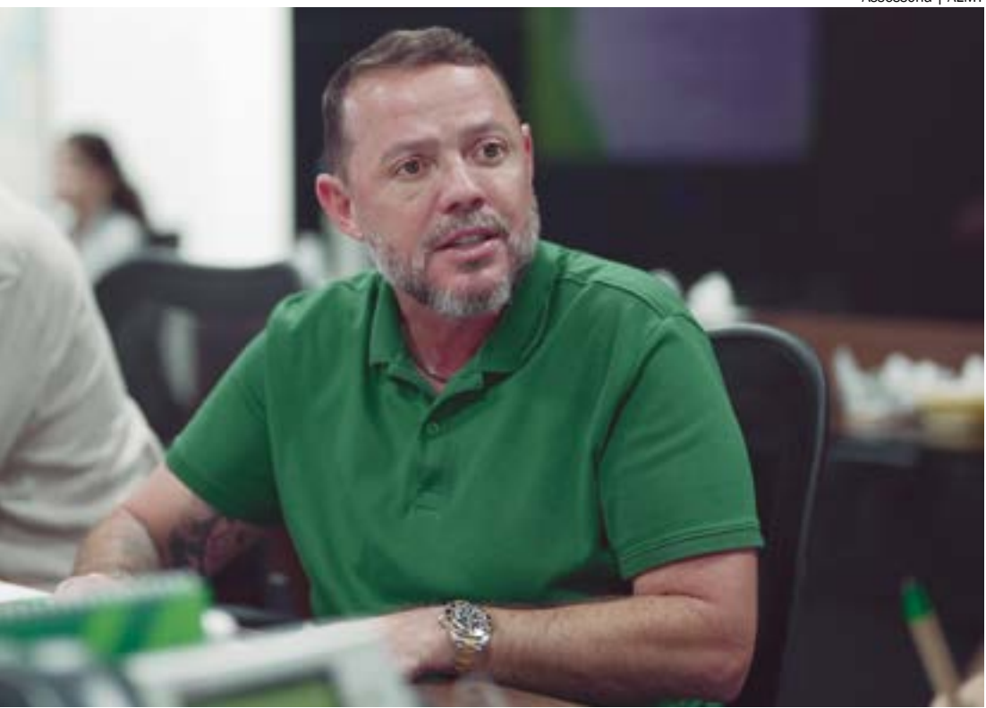
Projeto de irrigação para agricultura familiar teve a colaboração direta, em sua concepção, da Aprofir