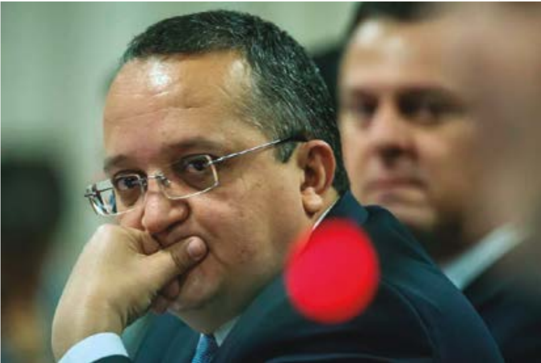
José Medeiros | Secom-MT

de infração penal envolvendo organização criminosa. O caso se deu em 2017, quando Taques ainda era governador. À época, ele acionou a Procuradoria-Geral de Justiça (PGJ), acusando Zaque de falsificação de documento público, prevaricação e denúncia caluniosa. O esquema dos grampos foi revelado em uma reportagem do Fantástico. O então governador afirmou que Zaque, em 2015, havia recebido a denúncia sobre a existência de um esquema de interceptações telefônicas ilegais nas comarcas de Sinop e Cáceres e até chegou a protocolar as denúncias, mas que esses documentos simplesmente desapareceram do Sistema de Gerência de Protocolo e Postal – GPP da Casa Civil. Taques afirmou não ter recebido a denúncia de Zaque, que tinha como princi-