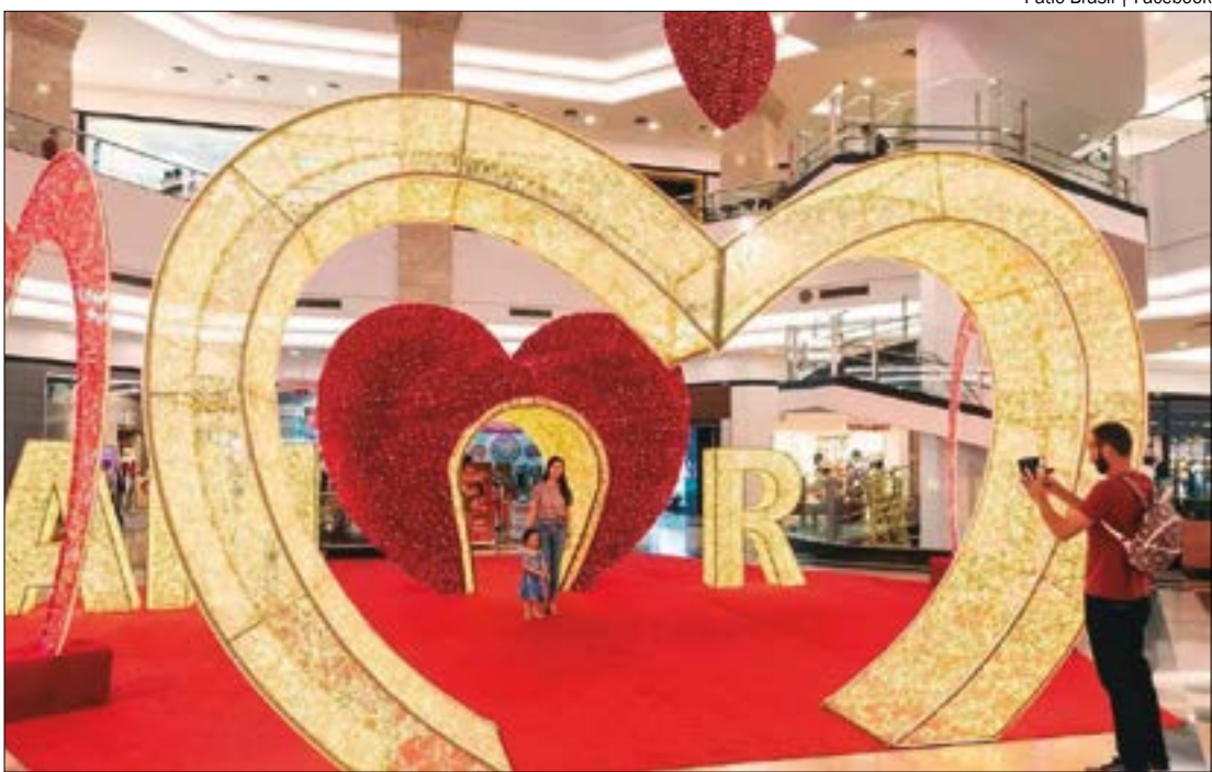
Movimentação prevista para este ano representa uma queda de 43% em relação a 2024

De acordo com a pesquisa, os consumidores pretendem investir, em média, R$ 350 em presentes e comemorações. Perfumes lideram a lista de preferência com 63% das menções, seguidos por chocolates (35%), roupas e acessórios (27%) e flores (16%). Além dos produtos tradicionais, experiências como jantares, idas ao cinema e viagens também estão entre as opções, sendo citadas por 13% dos entrevistados.