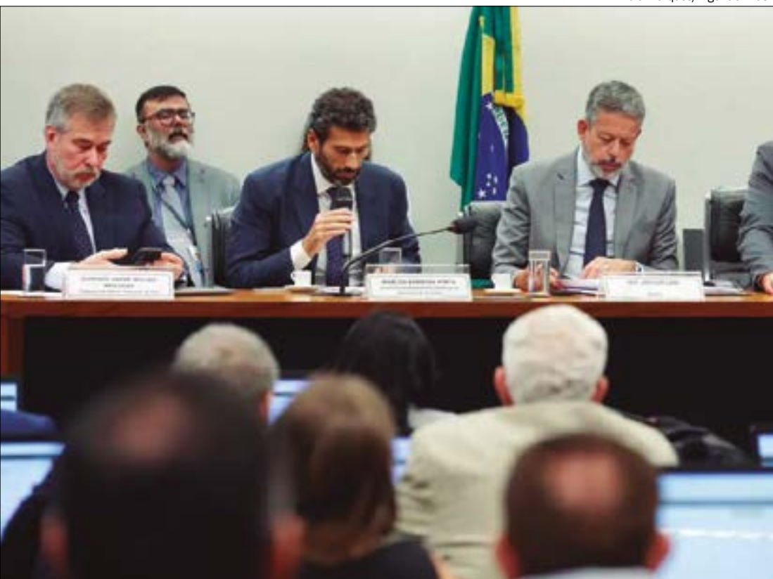
Atualmente, a tabela do Imposto de Renda acumula defasagem média de 154,67%