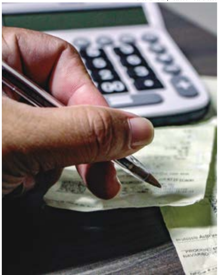
Gilberto Leite | Estadão Mato Grosso