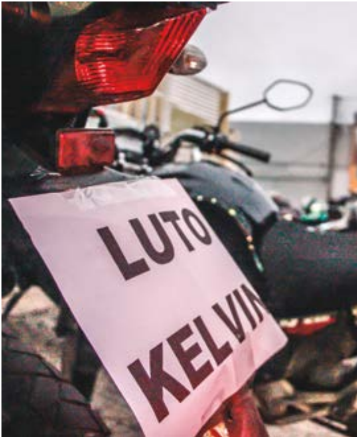
Gilberto Leite | Estadão Mato Grosso

João critica a falta de políticas públicas voltadas à segurança dos motoboys. Ele cita como exemplo positivo a implantação da faixa azul em outras capitais, que ajudou a reduzir — e em alguns casos até zerar — o