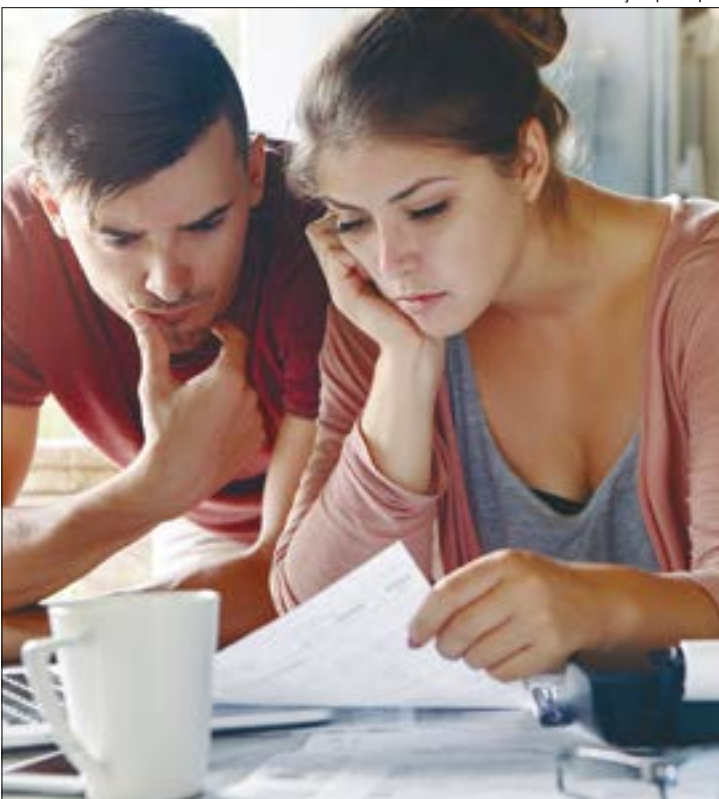
Ilustração | Freepik

O levantamento é um termômetro do comportamento de consumo e da saúde financeira das famílias, e ajuda o comércio a entender o ambiente em que atua.