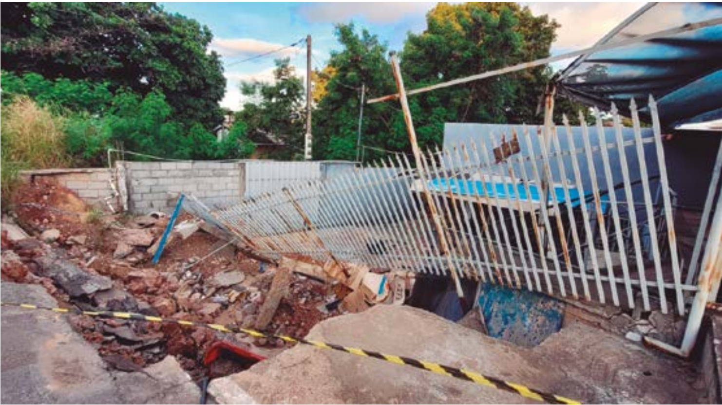
Pista apresenta sinais de erosão e rachaduras, e há risco iminente de deslizamento com novas chuvas

“Sobre a situação envolvendo uma moradia na Av. Jurumirim, a Secretaria Municipal de Meio Ambiente e Desenvolvimento Urbano informa que a demanda foi encaminhada para a Defesa Civil do Município e para a Secretaria Municipal de Obras para avaliação e providências”, diz a nota.