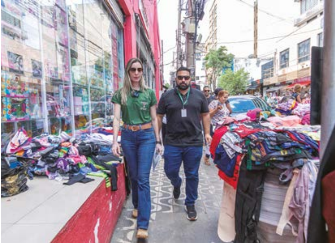
Prefeitura determinou o prazo até 5 de junho para a desocupação voluntária das calçadas do Centro

O Programa Ambulantes em Ordem visa garantir o cumprimento das normas urbanísticas e reorganizar o comércio informal em espaços públicos, conforme