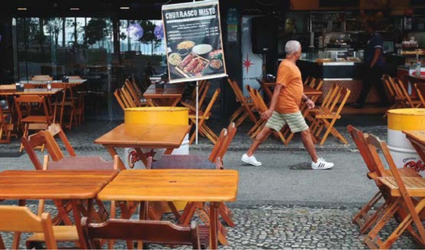
Além da perda de alimentos, empresários precisam lidar com frustração de turistas pela falta de energia