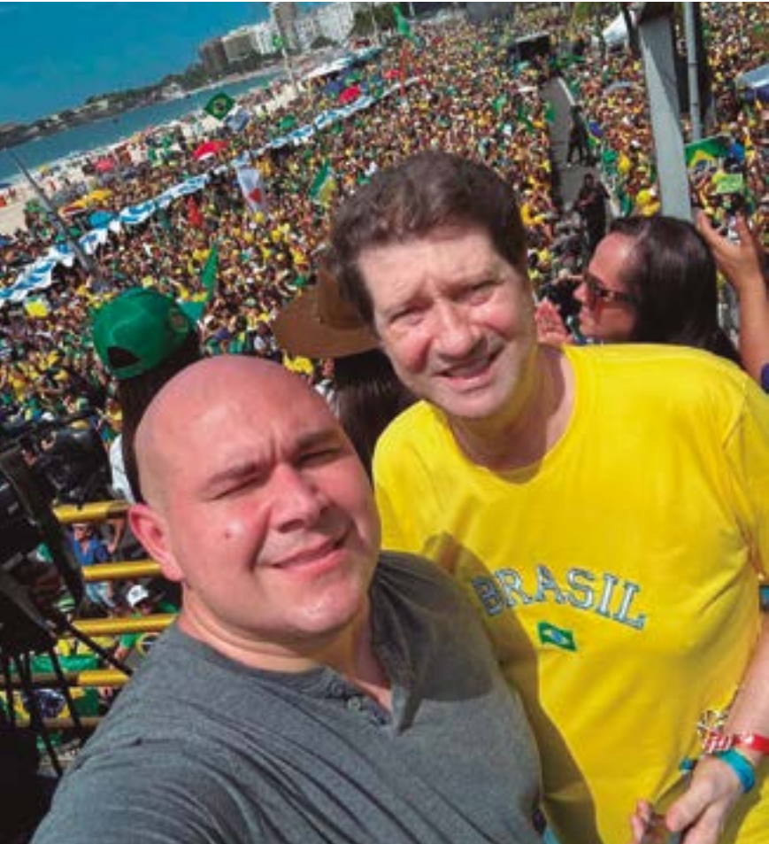
Abilio disse duvidar de filiação de Odílio ao Novo, já que empresário recebeu convite do PL