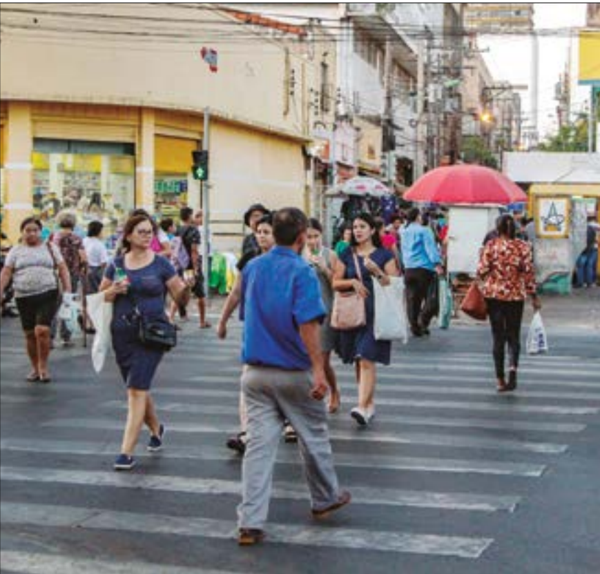
Varejo conseguiu aproveitar a segunda data mais importante do calendário comercial para atrair consumidores