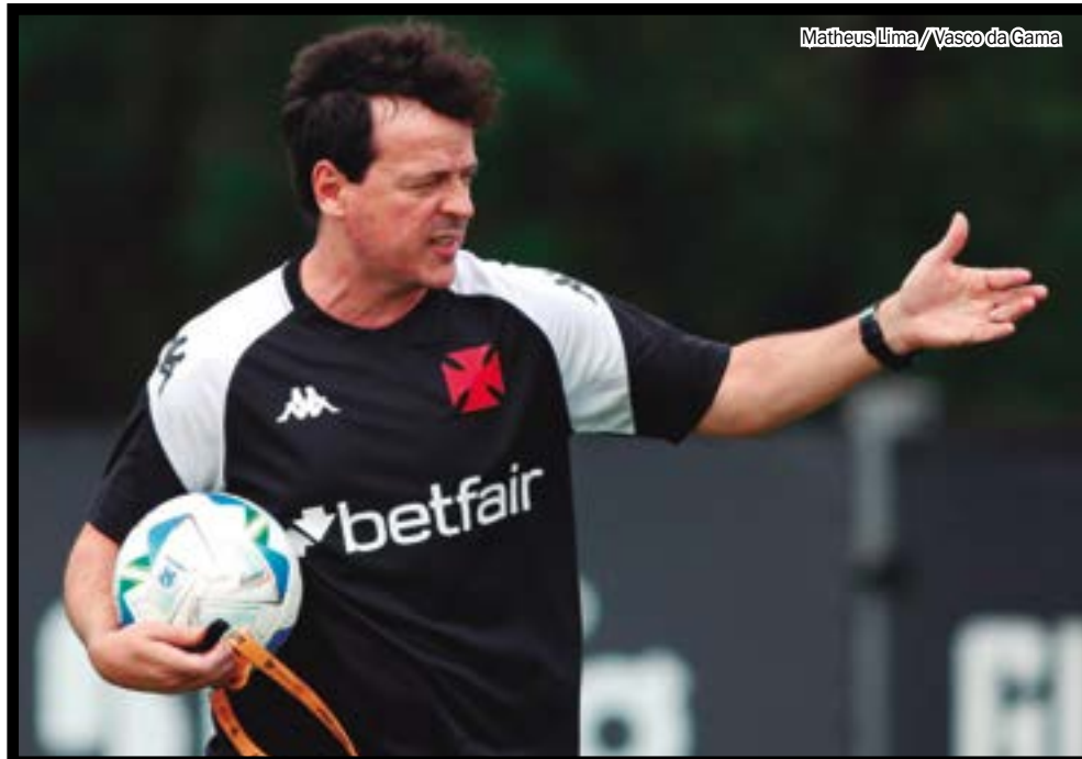
Matheus Lima/Vasco da Gama

DINIZ PERDE EM ESTREIA NO VASCO, MAS MANTÉM OTIMISMO: “TEMOS TIME PARA PRODUZIR MAIS”