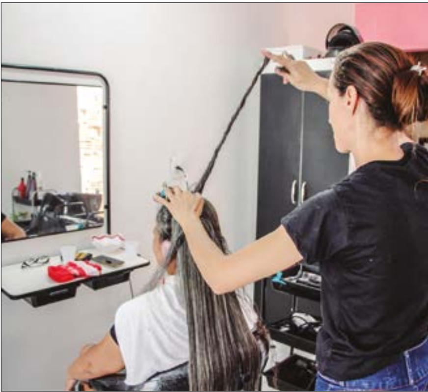
Setor de serviços acumula ganho de 1,2% nesse período de dois meses, aponta IBGE

A receita nominal dos serviços cresceu 1% em relação a fevereiro deste ano, 7,5% na comparação com março do ano passado, 7,6% no acumulado do ano e 7,7% no acumulado de 12 meses.