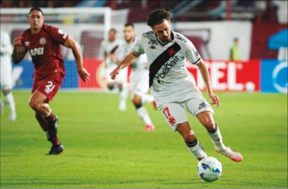
Mesmo com pouco tempo de trabalho, Diniz conseguiu imprimir um pouco de seu estilo no Vasco

A estreia de Fernando Diniz no comando do Vasco não trouxe o resultado esperado. Jogando na Argentina, o time cruz-maltino foi derrotado por 1 a 0 pelo Lanús, na noite desta terça-feira (13), e perdeu a chance de terminar em primeiro lugar no Grupo G da Copa Sul-Americana. Com o revés, a equipe terá que disputar os playoffs caso vença o último jogo. Mesmo com pouco tempo de trabalho — Diniz teve apenas um treino com o grupo completo —, o Vasco apresentou sinais de mudança. A equipe demonstrou mais paciência na posse de bola, maior aproximação entre os jogadores e uma postura mais agressiva na marcação, principalmente no primeiro tempo. “No 1º tempo, o time jogou bem, com a bola, marcou bem e alto, principalmente no começo do jogo, quando o time estava mais fresco. O que faltou no 1º