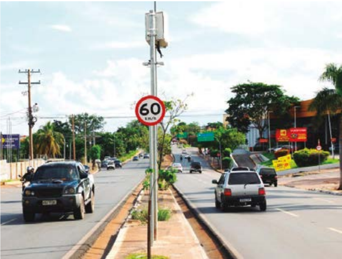
Segundo Abilio, Prefeitura está realizando um estudo sobre os locais de onde seria possível remover os radares

Segundo o presidente, há uma percepção consolidada na população de que os radares operam como uma “indústria de multas”, gerando penalidades em série contra motoristas sem a devida transparência.