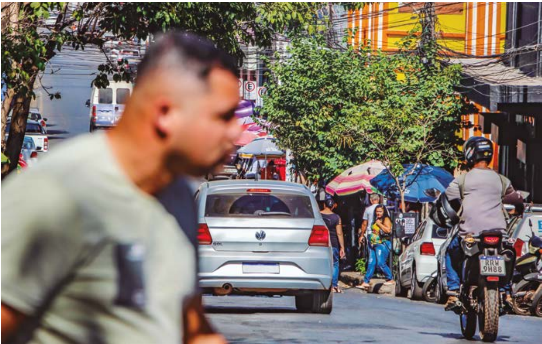
Gilberto Leite | Estadão Mato Grosso

A inadimplência em Mato Grosso continua elevada, mesmo com leve recuo registrado em abril. De acordo com dados do SPC Brasil, 1,224 milhão de consumidores estavam negativados no estado no mês passado. Isso representa 46,93% da população adulta. Na variação mensal, o número de inadimplentes caiu 0,04% em relação a março. O valor total das dívidas em aberto chega a R$ 6,4 bilhões, com uma média de R$ 5.270,33 por inadimplente. O tempo médio de atraso é de 2,2 anos. Ainda segundo o levantamento, 38,6% dessas dívidas têm mais de um ano. Cada consumidor com restrição no CPF possui, em média, 2,26 pendências financeiras, o que soma 2,67 milhões de registros de débito no estado