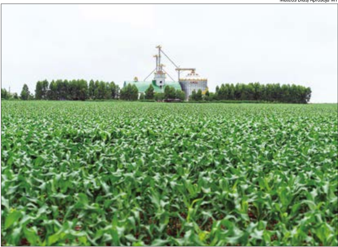
Mateus Dias/Aprosoja MT

Nos últimos 10 anos, dados da Conab indicam que a produção estadual aumentou em 51,6 milhões de toneladas, enquanto a capacidade de armazenagem saiu de 37,82 milhões de toneladas em 2015 (safra 13/14), para 52,29 milhões em 2025 (safra 23/24), um crescimento que não acompanha a evolução do volume de grãos produzidos. Considerando a expectativa de aumento de produção, o IMEA