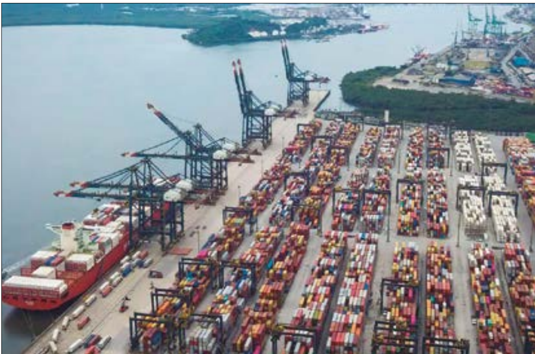
Porto de Santos

a quantidade exportada caiu 10,6%, puxada pela manutenção de plataformas de petróleo, enquanto os preços médios recuaram 4,9%.