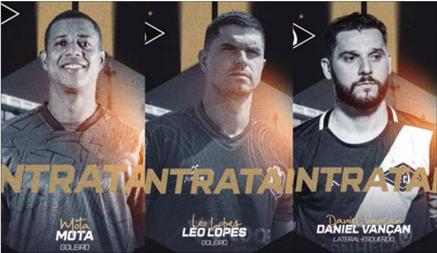
Após se classificar para a Série D do Campeonato Brasileiro e Copa do Brasil de 2026, o Mixto EC passa por reformulação