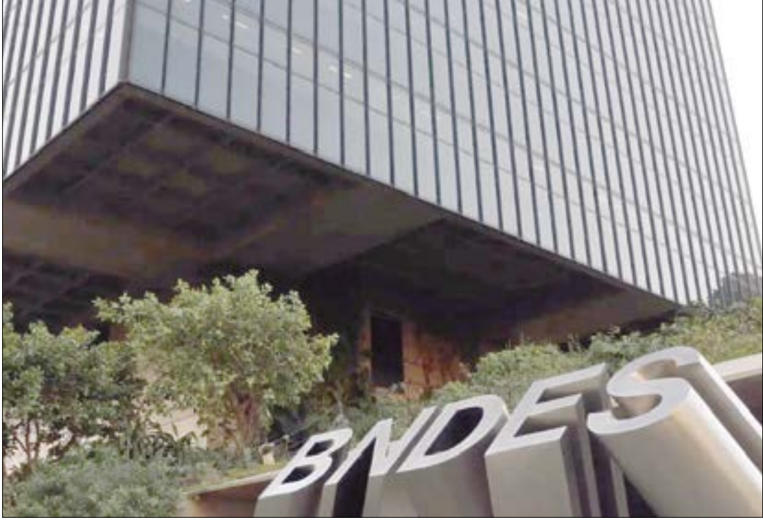
O financiamento faz parte do programa Fornecedores SUS - linha de crédito destinada a empresas que atendem à demanda do SUS