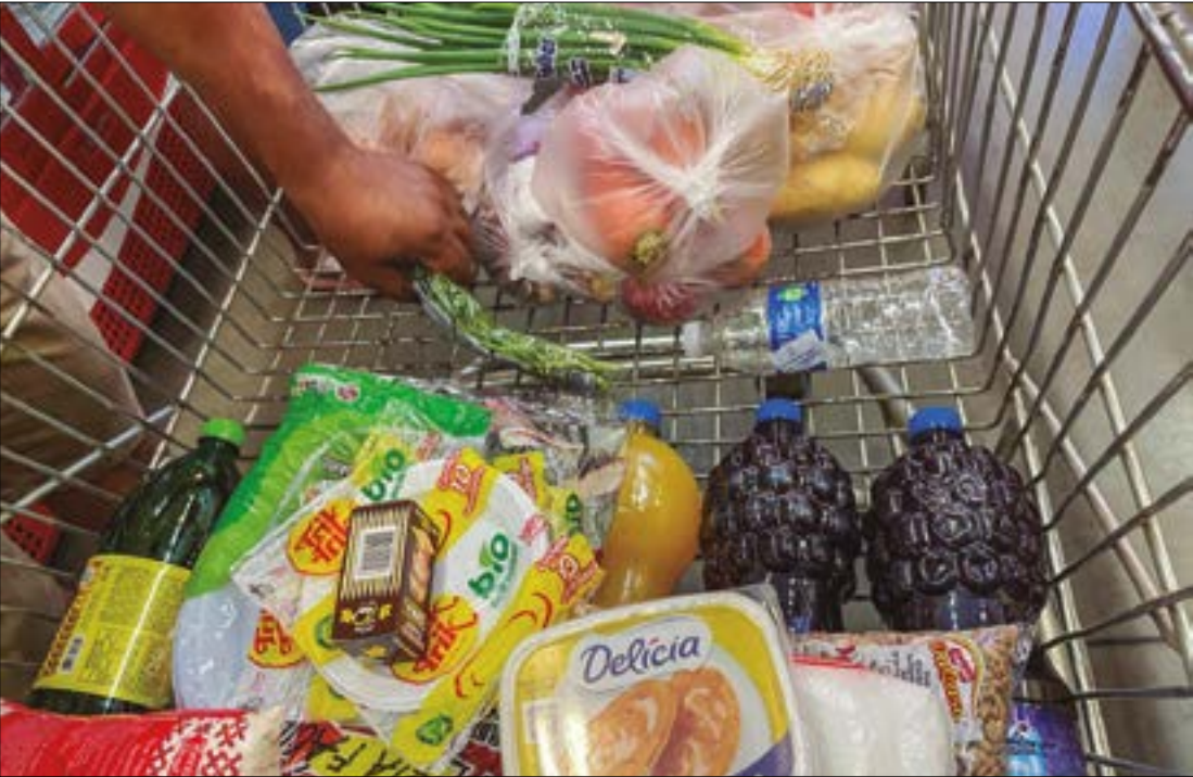
Entre os produtos que mais contribuíram para essa elevação, a batata segue liderando os aumentos, apresentando, nesta semana, um acréscimo de 7,50%

Pela terceira semana consecutiva, a cesta básica em Cuiabá segue com aumento no preço e continua quebrando recordes. Os consumidores da capital mato-grossense têm sentido no bolso o impacto dessas elevações, que comprometem cada vez mais o orçamento familiar. Na primeira semana de abril, um levantamento realizado pelo Instituto de Pesquisa e Análise da Fecomércio Mato Grosso (IPF-MT) apontou uma nova alta, desta vez de 0,62% em relação à semana ante-