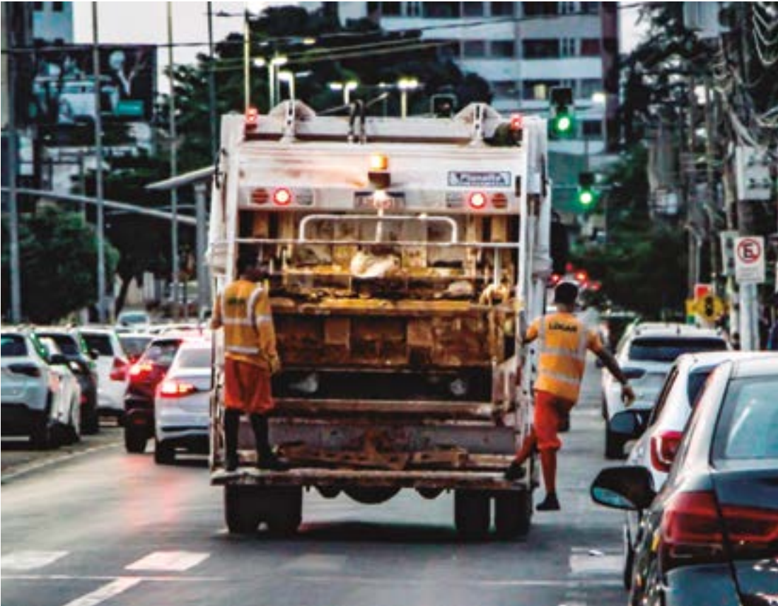
Com o fim da Taxa de Lixo, os grandes geradores de resíduo voltarão a pagar uma alíquota exclusiva para a coleta em seus estabelecimentos

feito, o valor estimado já é o mesmo, se comparado as duas alíquotas, e segundo porque a legislação brasileira não permite que órgãos públicos renunciem a receitas sem apresentar novas fontes. Ou seja, a Administração Pública não pode reduzir a arrecadação geral de impostos. Esta futura taxa de grandes geradores deverá ser aplicada a grandes estabelecimentos, como restaurantes e condomínios. A taxa, cujos valores ainda serão calculados, deverá levar em consideração o metro cúbico de lixo coletado. Esses estabelecimentos têm seus resíduos recolhidos por meio de contêineres, diferente das residências, cujos lixos são colocados em sacolas e coletados individualmente pelos garis. A partir de agora então, a Prefeitura vai mapear os estabelecimentos classificados como grandes geradores e a quantidade