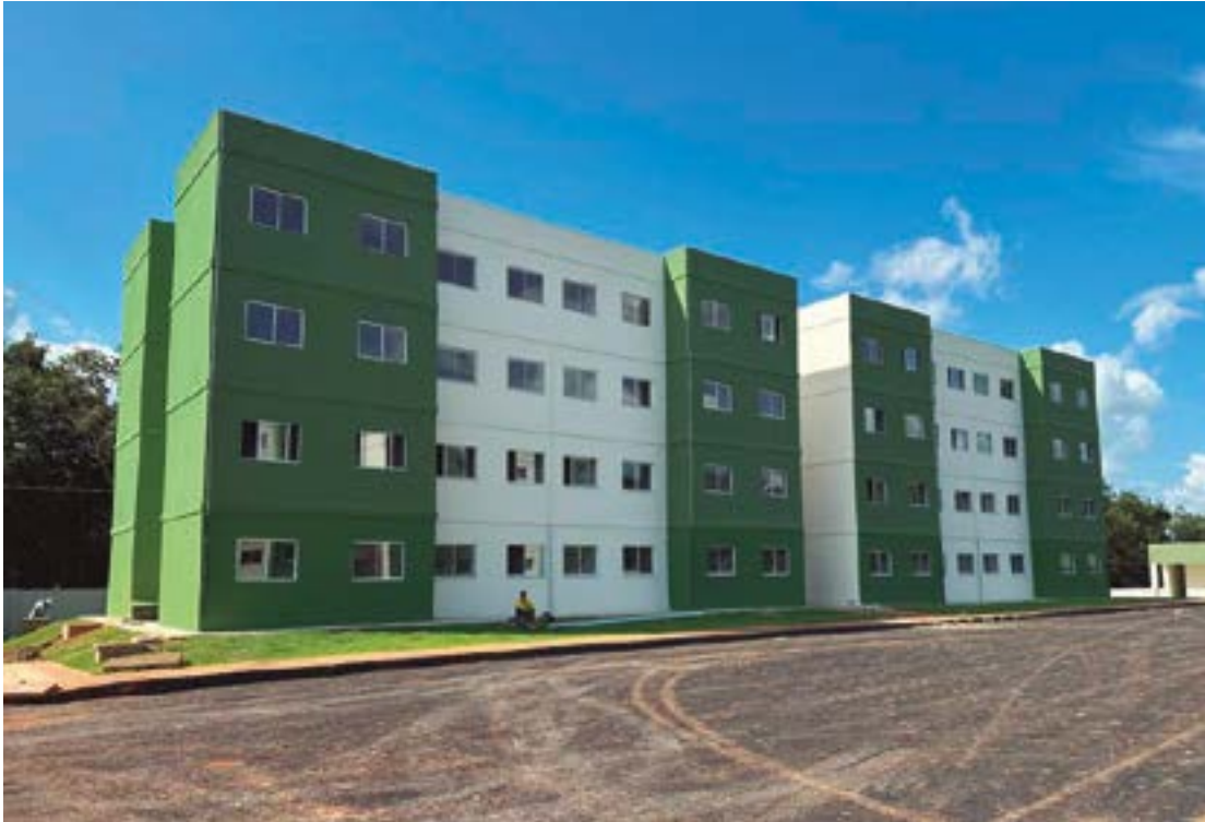
Os interessados devem acessar o site da MT Par, responsável pela modalidade, e fazer a inscrição no Sistema de Habitação

Os interessados no empreendimento devem acessar o site da MT Par, responsável por operacionalizar a modalidade, e realizar sua inscrição no Sistema de Habitação de Mato Grosso (Sihab-MT). No sistema, é possível manifestar interesse no empreendimento e obter um número de protocolo para atendimento na construtora.