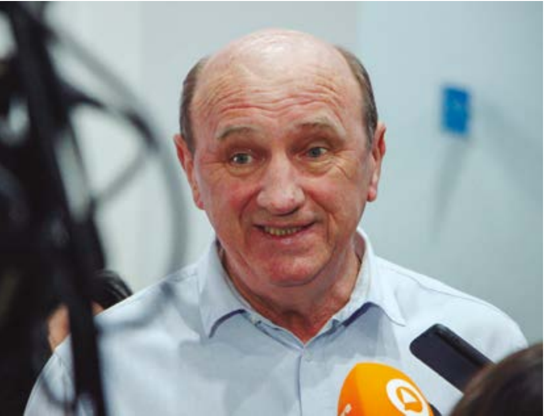
Neri disputou para o cargo de senador em 2022, na chapa do presidente Lula, mas teve a candidatura indeferida pela Justiça