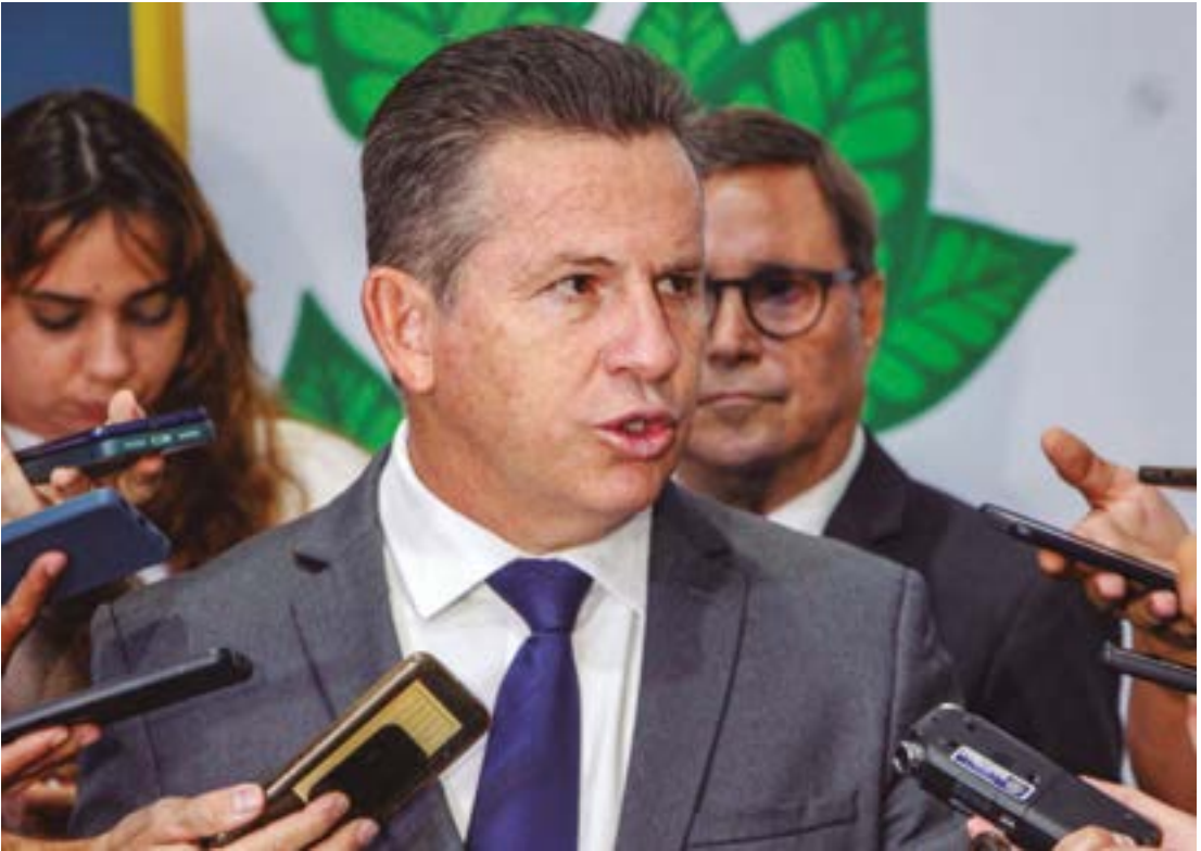
O projeto está paralisado em razão de uma decisão do Supremo Tribunal Federal que exigiu mais estudos de impactos ambientais da obra

federal teria dificuldades em viabilizar a construção da ferrovia. Segundo ele, é necessário que haja uma postura mais objetiva e pragmática por parte das