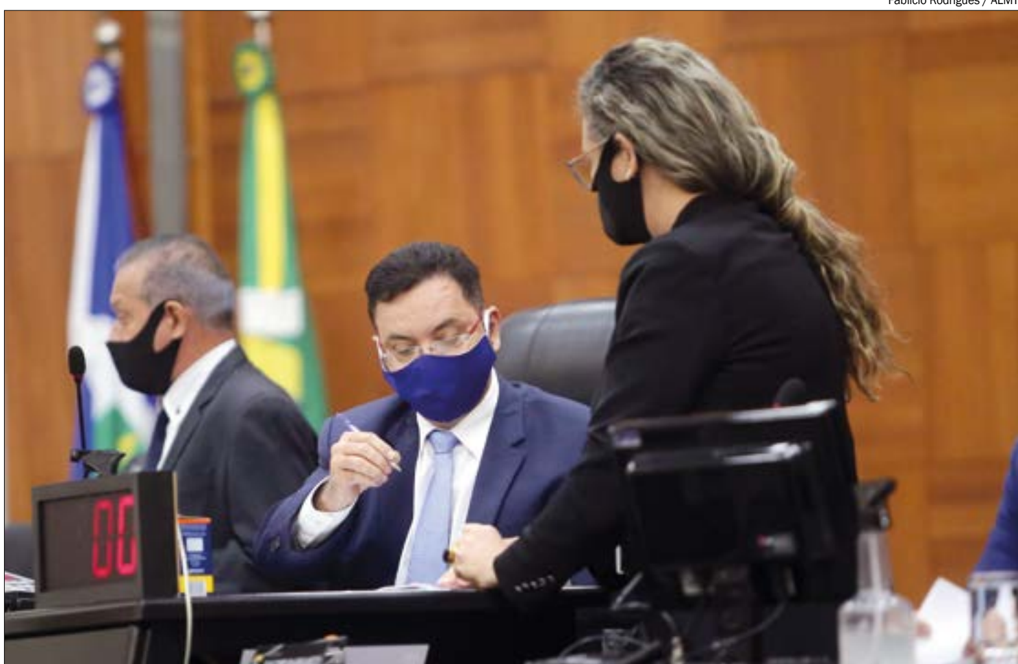
Com pedido de vista coletivo, votação da reforma da Previdência é adiada mais uma vez

Os professores também terão regras diferentes: as mulheres poderão se aposentar aos 57 anos e 25 anos de contribuição, já os homens deverão ter pelo menos 60 anos. A aposentadoria compulsória permanece aos 75 anos para todos os servidores.