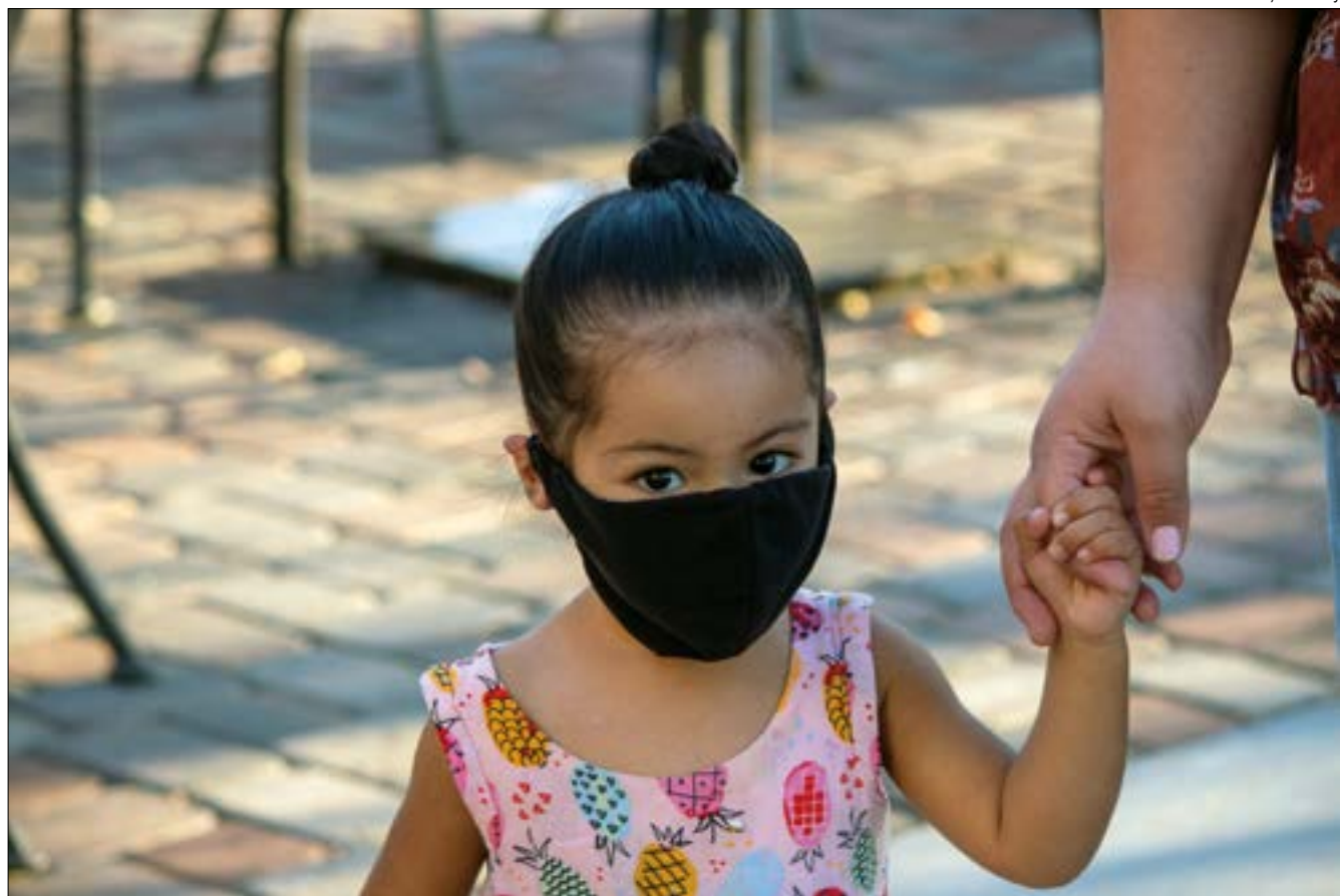
Os pais ou responsáveis podem proteger as crianças adotando uma rotina saudável e seguindo as regras básicas de higiene e proteção

Enquanto as buscas científicas ainda não são conclusivas para dar segurança ao convívio social e até mesmo familiar, as regras básicas de higiene e proteção – definidas pela Organização Mundial de Saúde (OMS) – seguem fazendo parte da nossa rotina como um conselho de mãe, que nunca deixa de ser repetido: lave as mãos, use máscaras e mantenha-se a uma distância segura entre as pessoas.