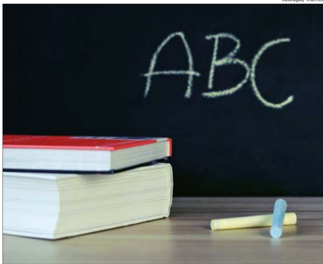
Os membros do comitê estarão monitorando as escolas, garantindo que as medidas de prevenção proporcionem um ambiente seguro

(Com informações da Assessoria de Imprensa)