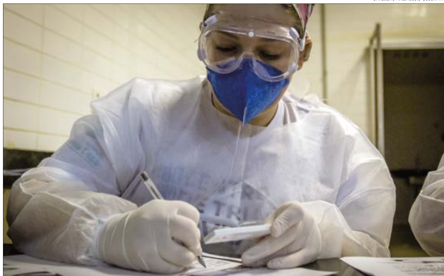
O Ministério da Saúde aponta que até o dia 27 de julho 182 bebês com menos de 1 ano morreram no Brasil vítimas da covid