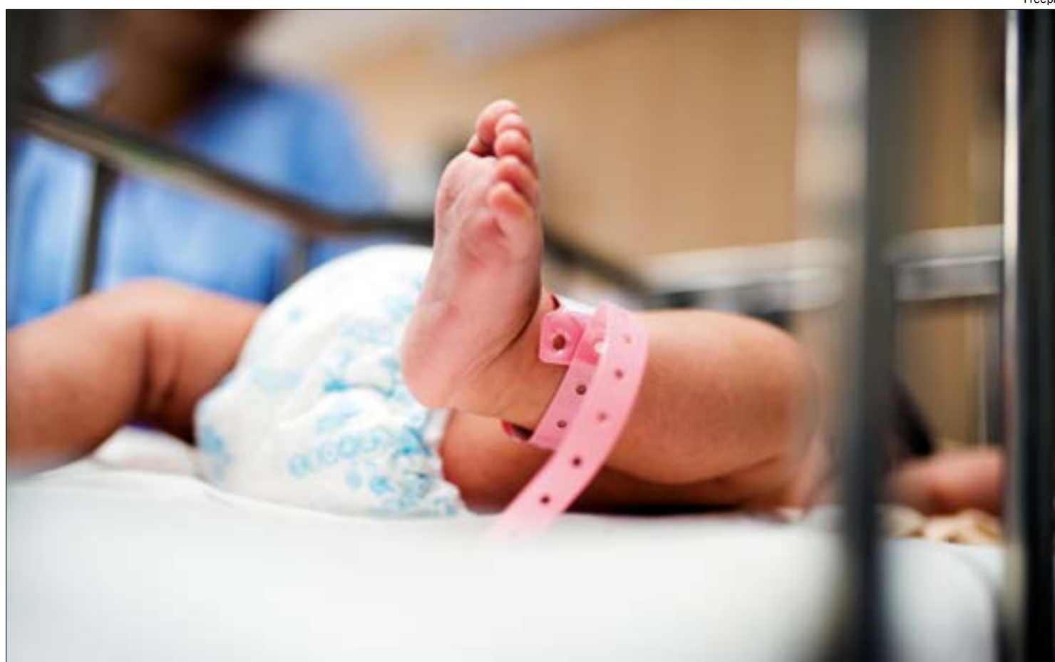
O estado já registra 496 casos de covid-19 em crianças desde o início da pandemia, sendo 9 mortes registradas

A quantidade de vidas perdidas em menos de 24 horas em Mato Grosso atingiu seu maior pico na tarde de terça-feira (4). Foram 70 ocorrências de óbitos confirmados pelas secretarias municipais de Saúde de 31 municípios. Um deles, de um bebê