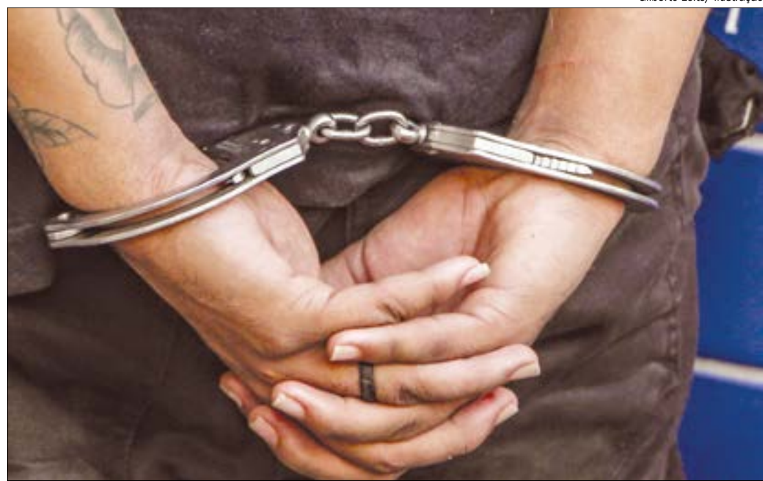
A criança, de apenas 4 anos, contou à mãe que o tio teria oferecido chocolate a ela para que não contasse sobre os abusos