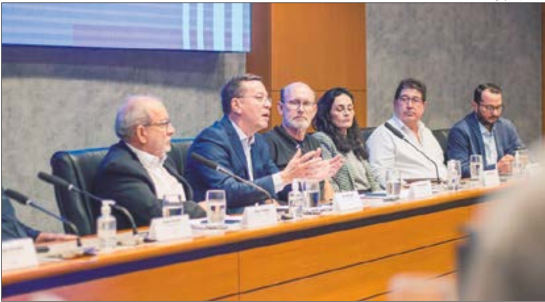
Empresários veem avanços com o Crédito do Trabalhador, mas temem possibilidade de superendividamento