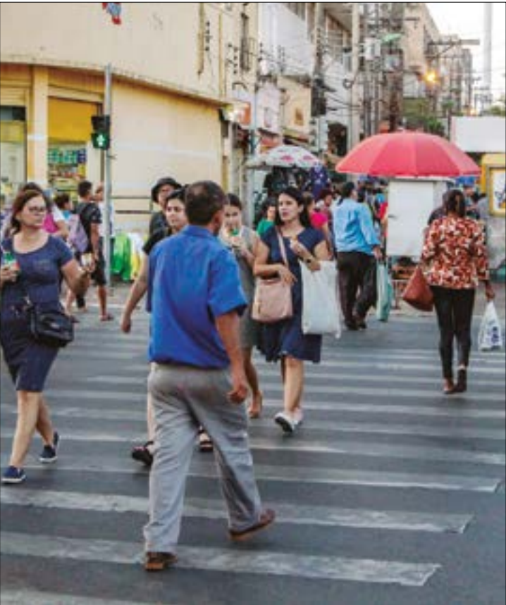
Para este ano, a estimativa para o crescimento da economia caiu para 1,97%