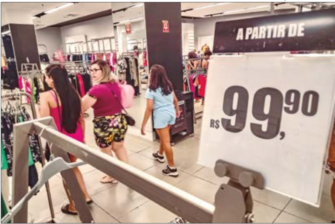
Pessimistas com a economia, empresários de Cuiabá já começam a ‘segurar’ investimentos e contratações

A queda na confiança afetou todos os segmentos do varejo, com destaque para supermercados, farmácias e lojas de cosméticos, que registraram uma retração de 4,4%. A CNC destacou