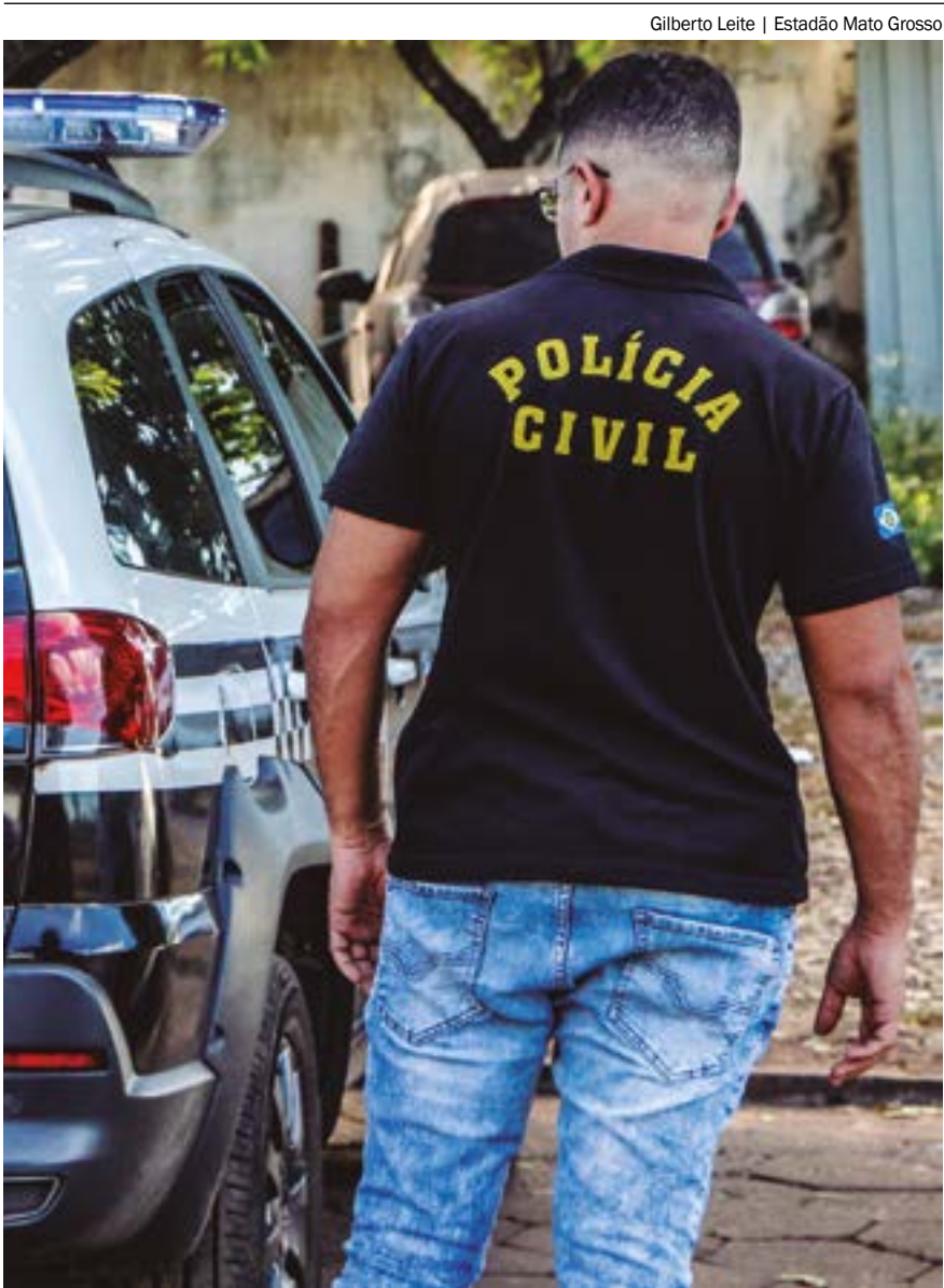
Gilberto Leite | Estadão Mato Grosso