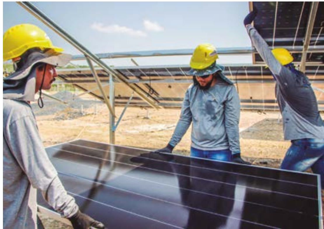
Energia solar atraiu mais de R$ 54,9 bilhões em novos investimentos durante o ano de 2024