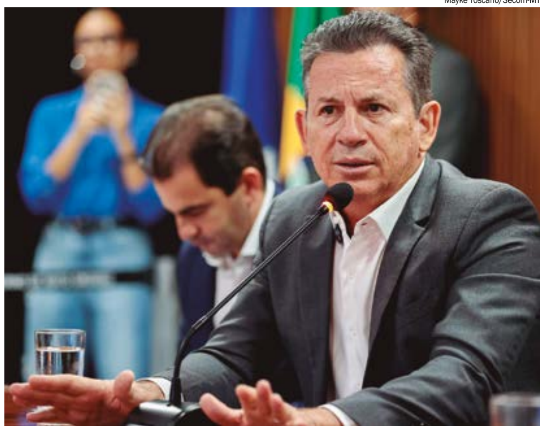
Decisão de Mendes veio após análise técnica e debate com os setores produtivos de MT

"Precisamos resolver essa questão com critérios claros para os técnicos da Sema e vamos adequar o que for necessário, até para evitar judicializações futuras. Então, vamos tratar esses critérios dentro do grupo de trabalho com o compromisso de encontrarmos um meio termo que proteja e atenda aos técnicos e aos produtores e respeite a legislação", disse.