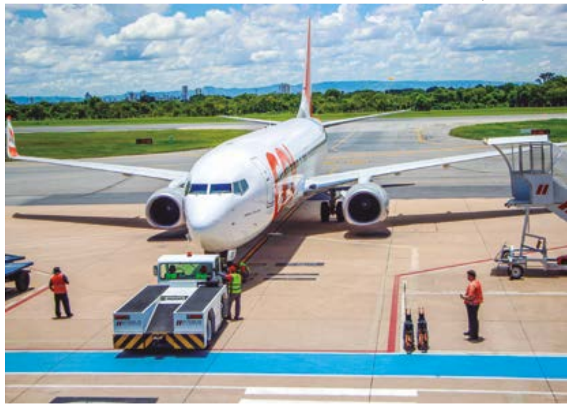
Cuiabá terá mais quatro destinos com voo direto neste ano, saltando de 15 destinos para 19