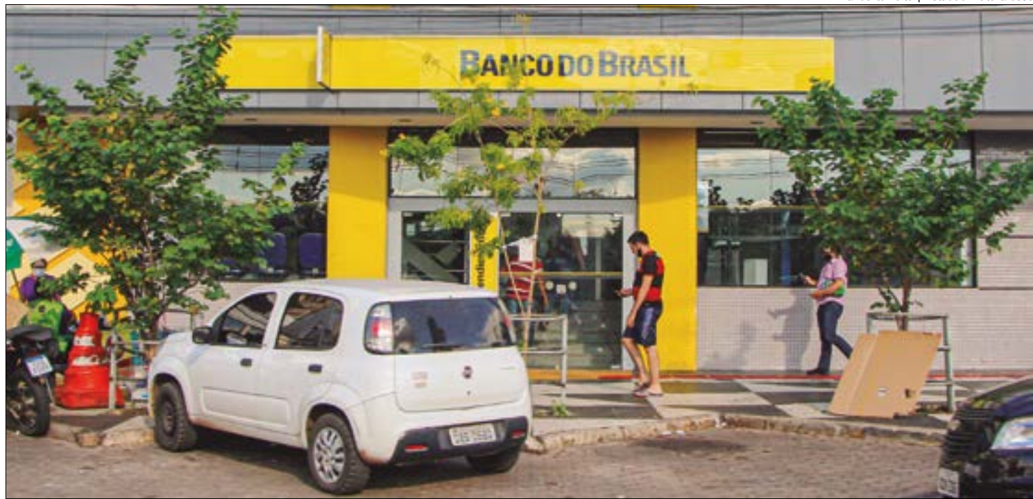
Gilberto Leite | Estádio Mato Grosso

EMPRESAS BUSCAM CRÉDITO - O setor empresarial também tem sido um dos principais motores desse crescimento do crédito. Muitas empresas, especialmente as de pequeno e mé-