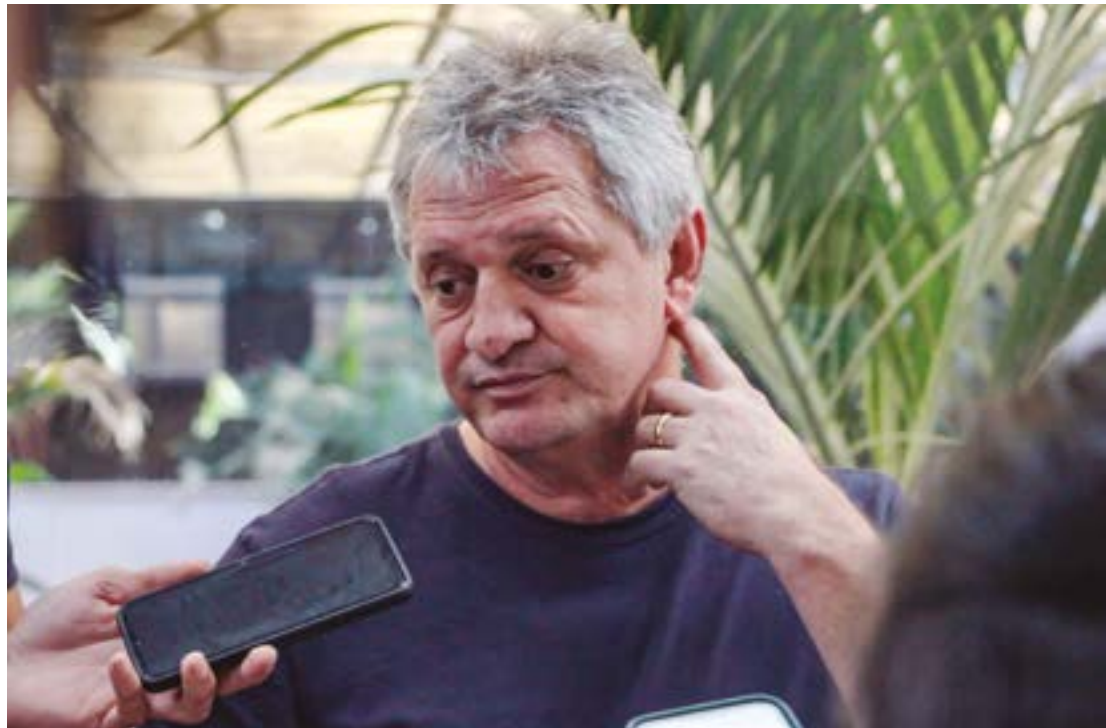
Dilmar diz que RGA de 20% colocaria em risco equilíbrio fiscal e paralisaria obras no estado