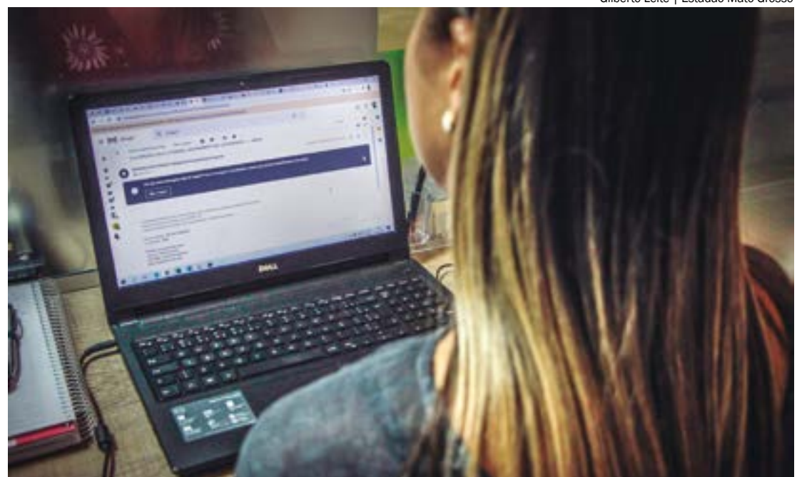
Golpistas criam sites que imitam as plataformas oficiais do governo e confundem os usuários

A analista destaca que não existem cobranças para abertura do MEI ou envio de Declaração Anual. A única responsabilidade dos MEIs é em relação ao recolhimento mensal, que tem uma contribuição fixa, independentemente do faturamento. O Documento de Arrecadação do Simples Nacional (DAS-