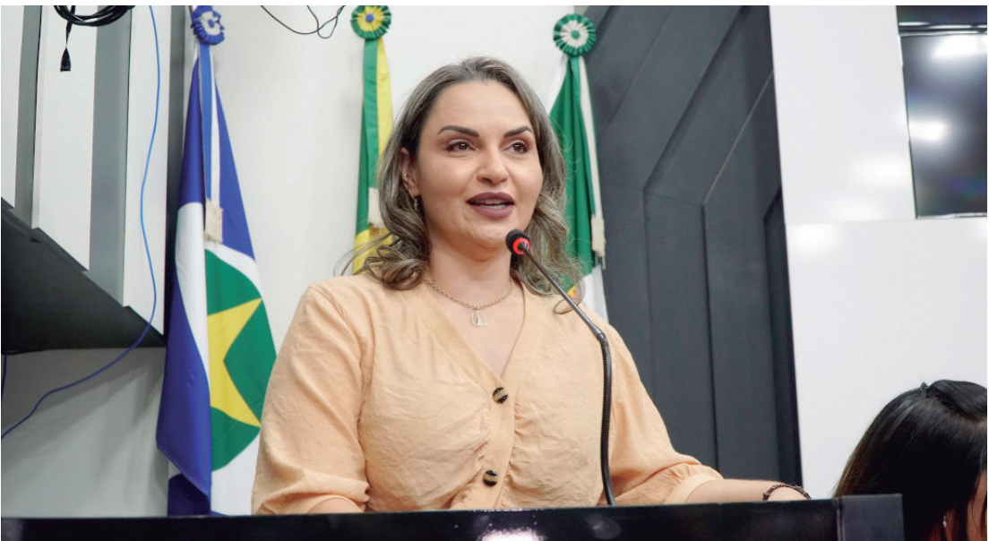
Câmara de Cuiabá