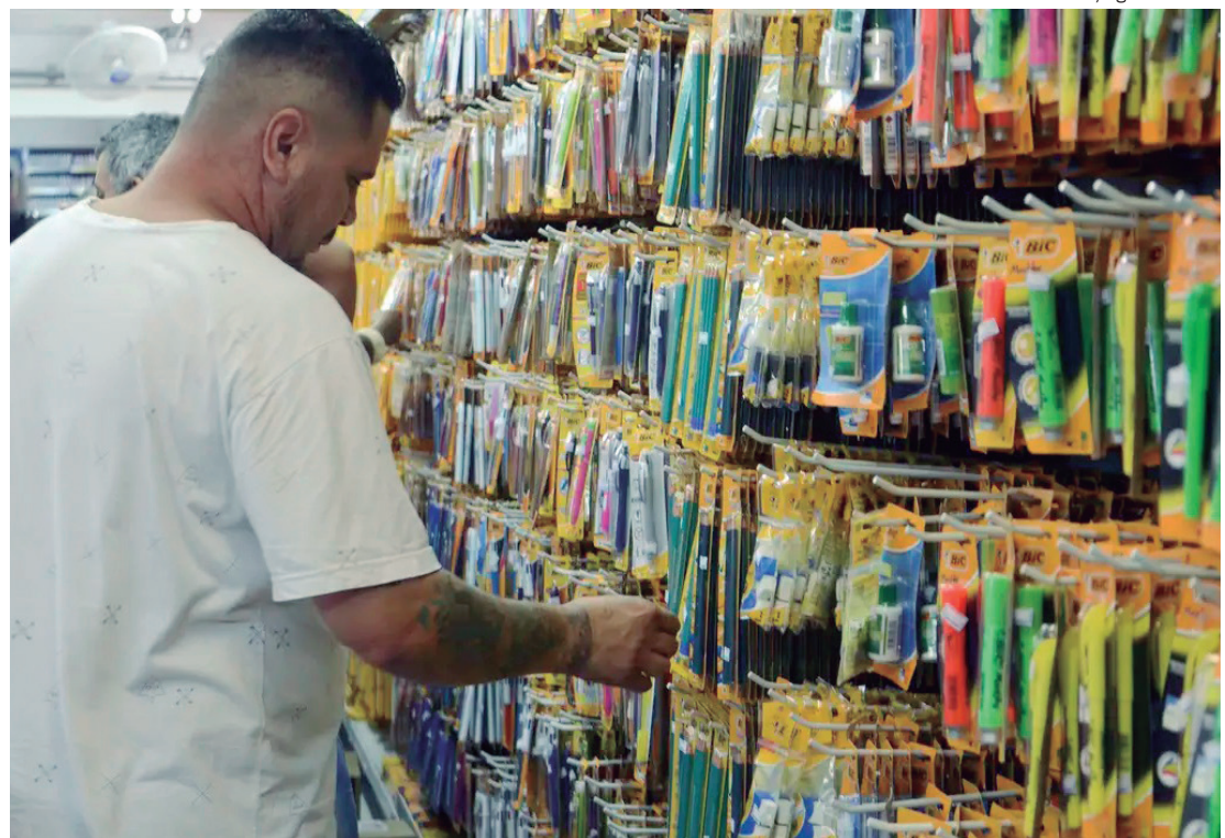
Advogado alerta que instituições de ensino não podem solicitar aos pais itens de uso coletivo