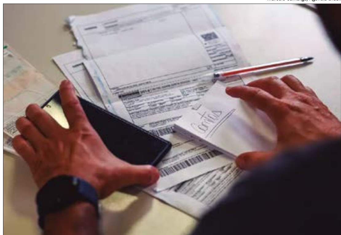
Futuro IVA será de 28,55%, superando a Hungria, país que atualmente cobra 27%

número poderá subir após o secretário extraordinário da Reforma Tributária no Ministério da Fazenda, Bernard Appy, apresentar os cálculos definitivos.