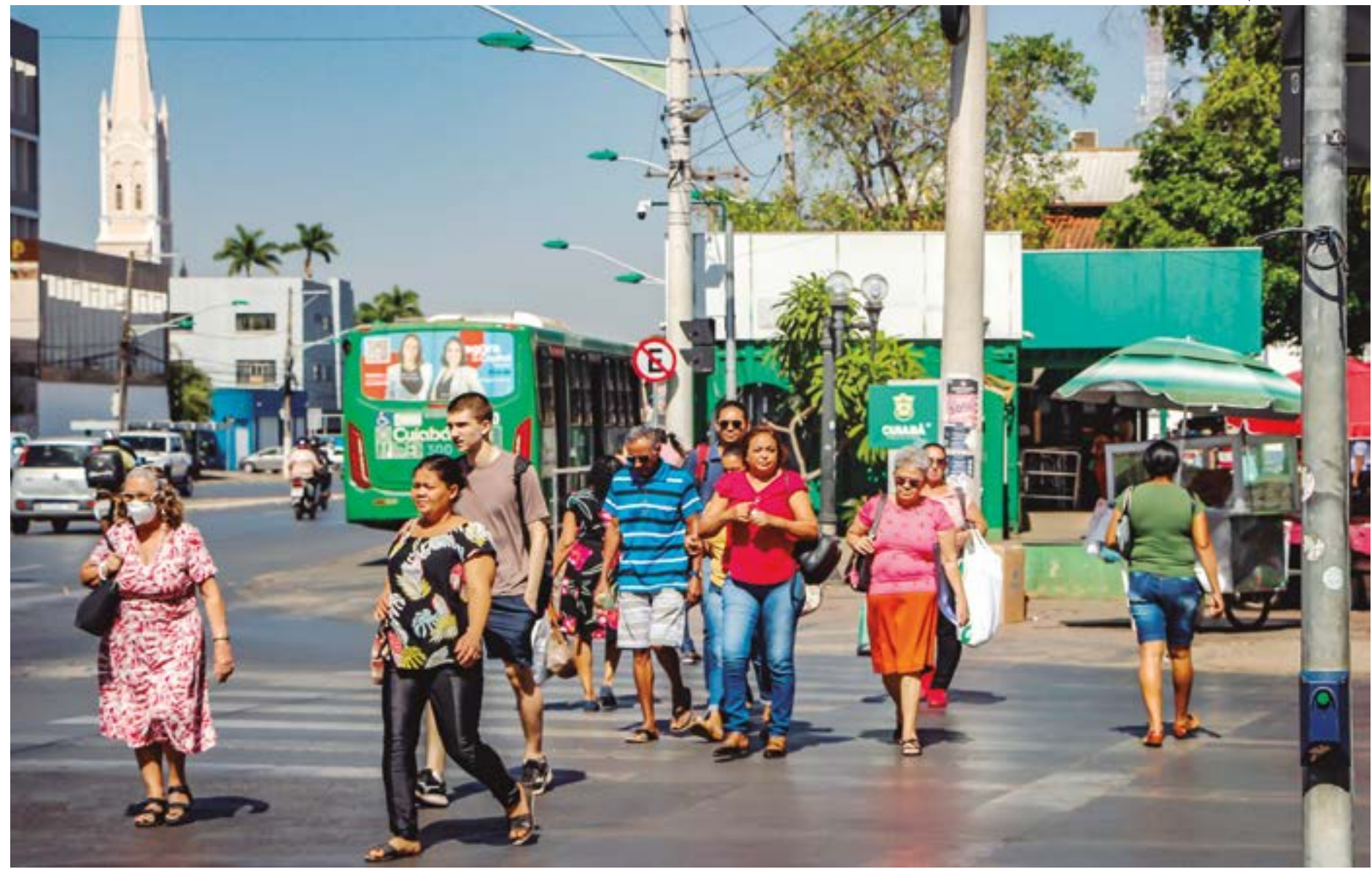
Gilberto Leite | Estadão Mato Grosso