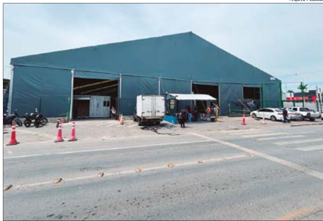
Estrutura adaptada e temporária busca garantir o conforto e a segurança de todos os clientes

Onde: Shopping Popular - Av Carmindo de Campos