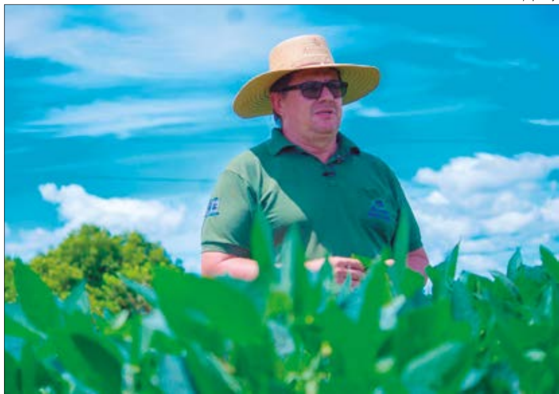
Em depoimentos, produtores destacaram os desafios enfrentados devido às condições climáticas