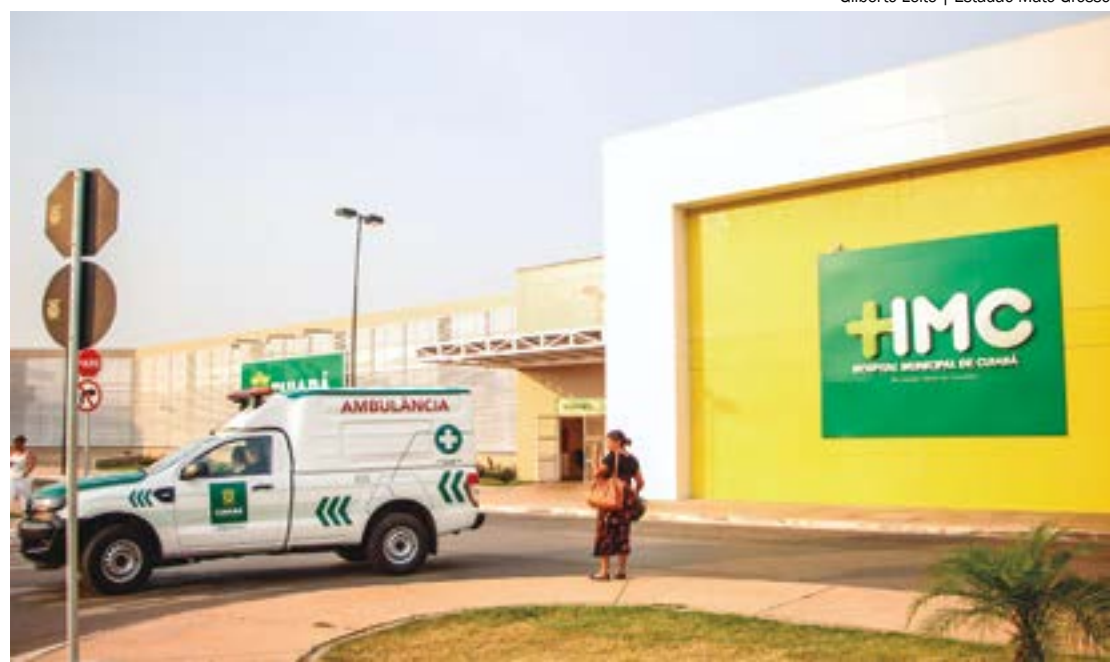
Gilberto Leite | Estadão Mato Grosso

"A empresa Cuiabana, ela está devendo R$ 200 milhões. Ela vai entregar para gente repasse dos médicos terceirizados, atrasados desde outubro. Ai a gente vai ter que sentar em janeiro com as empresas e renegociar as dívidas. Sem falar que aqui [HMC] tem R$70 milhões que nem empenhado foi ainda. Vai ficar em resto a pagar. Então eles estão deixando um rombo para nós da Empresa Cuiabana e estão deixando um rombo da Secretaria de Saúde", disse.