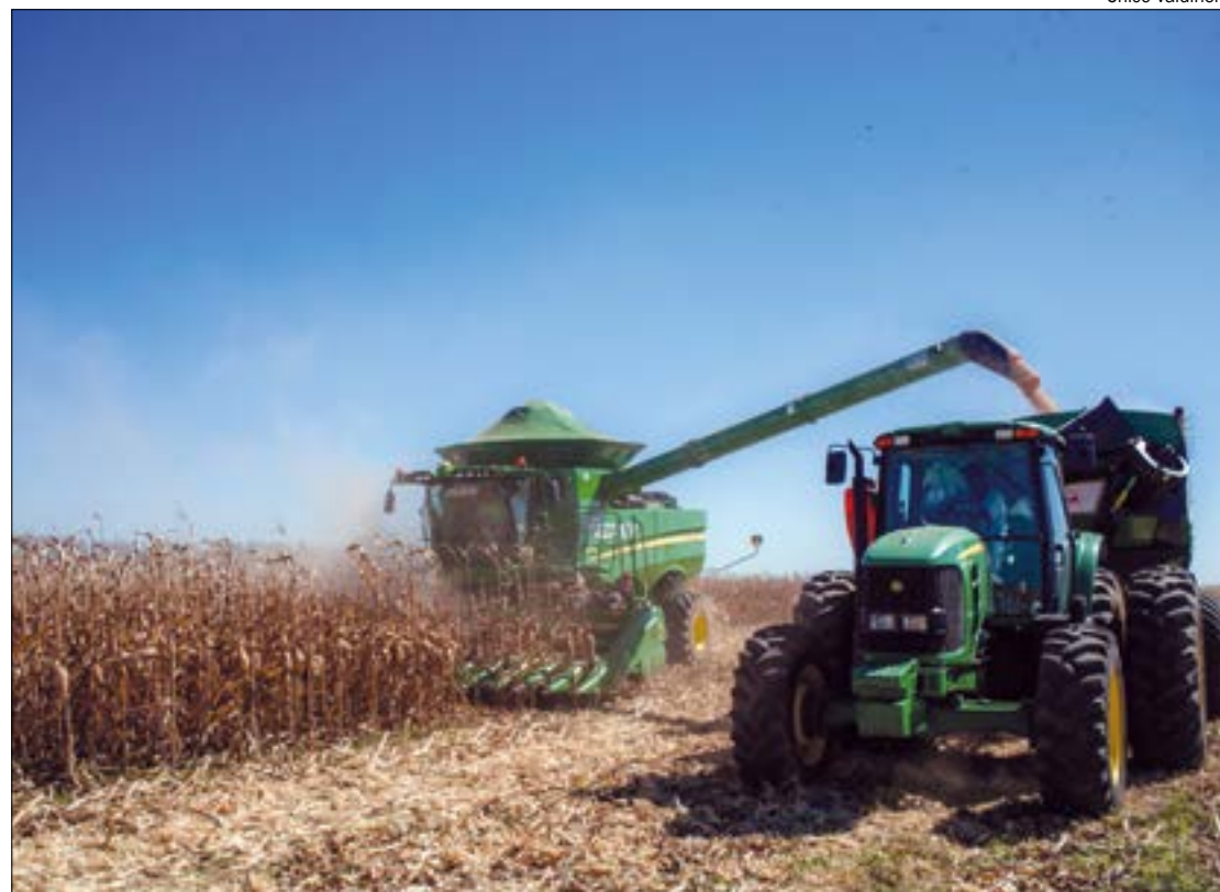
O Ministério da Agricultura prevê o crescimento de 27% na produção de grãos do país na próxima década