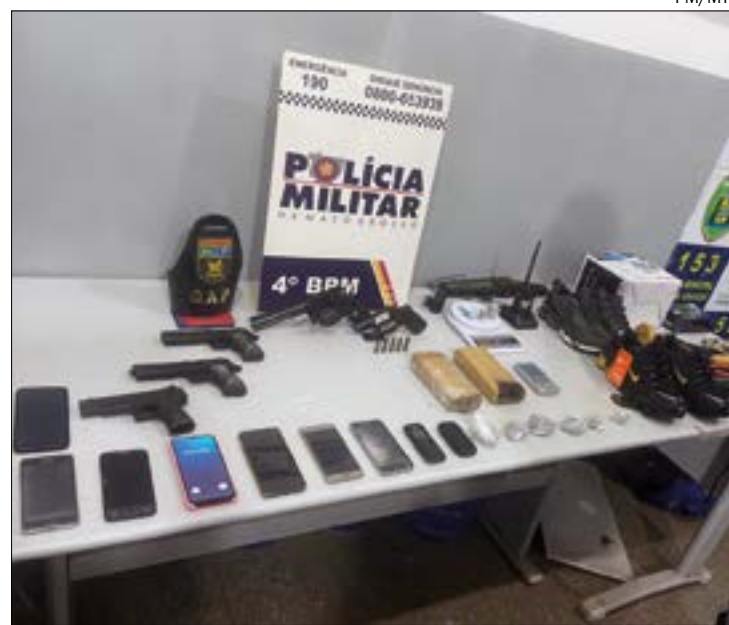
Seis homens e três mulheres foram presos após ação rápida da PM