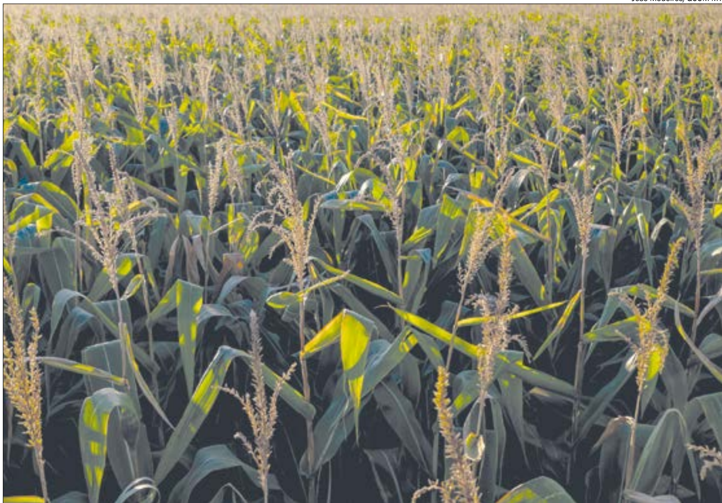
A valorização do cereal em Mato Grosso é influenciada por diversos fatores

“Apesar da desaceleração econômica mundial, o preço do cereal mato-grossense pode ser sustentado nos próximos