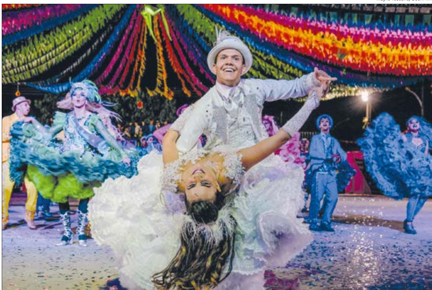
Enquanto a gente não pode sair para dançar, dá pra curtir a quadrilha junina em casa ao som da Associação Pirilampos do Vale