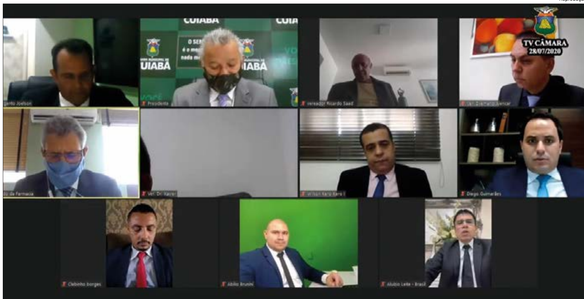
Câmara aprovou a reforma da Previdência e ainda livrou a prefeitura de pagar contribuição patronal durante a pandemia

Embora desgastante para os parlamentares, já que o projeto atinge diretamente o bolso do servidor, a proposta recebeu o apoio da maioria, inclusive do algarz do prefeito na