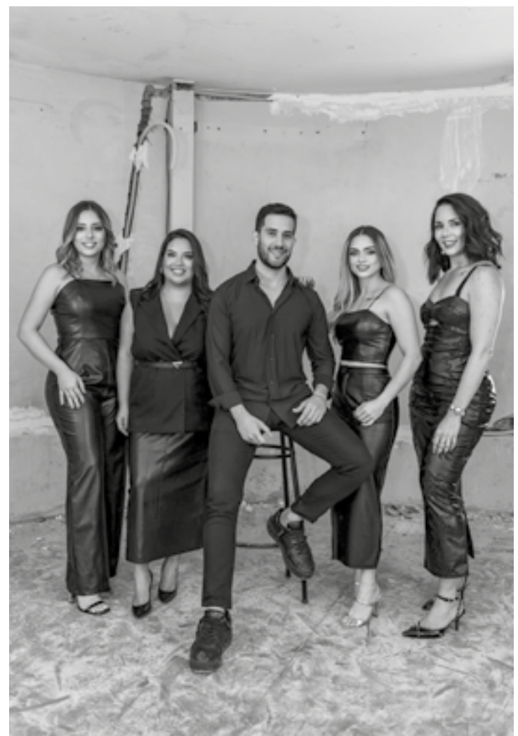
O Projeto Mais Ousado ficou para o Home Office, do arquiteto Filipo Madeira