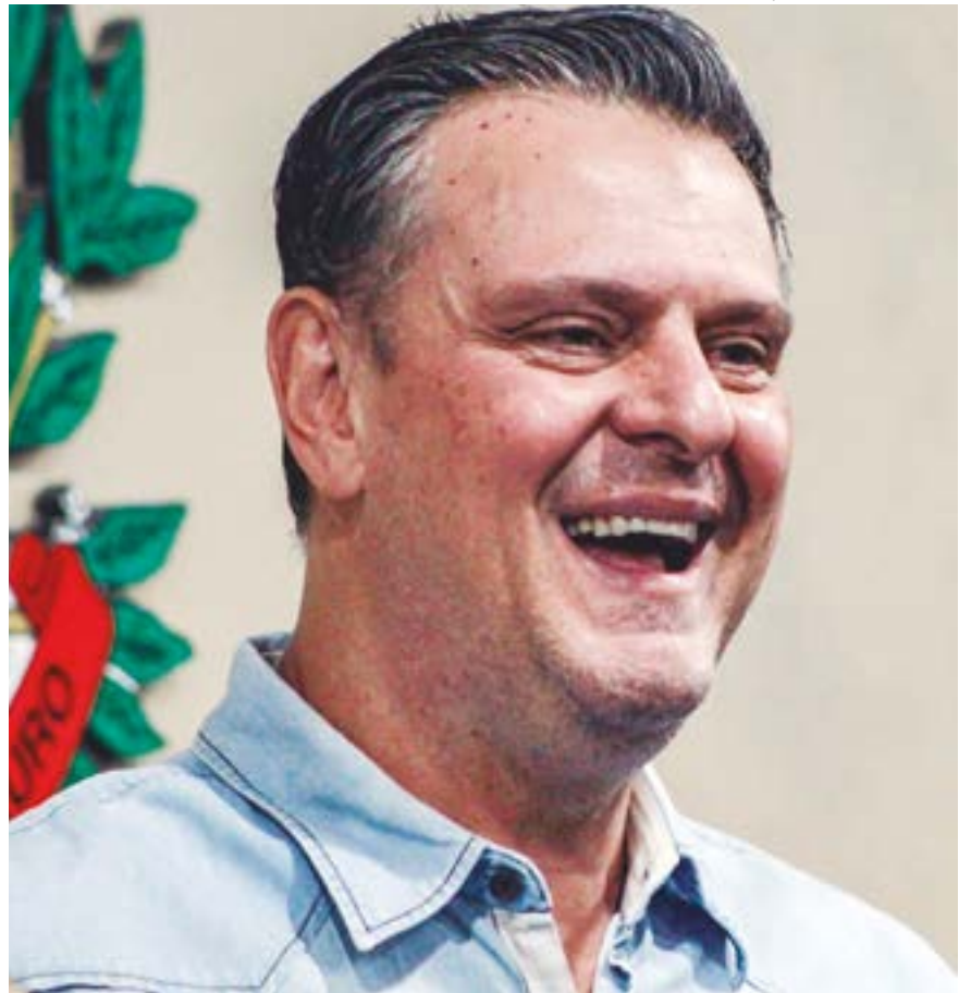
Fávaro diz que governo quer se aproximar dos gestores municipais, por meio de parcerias para projetos