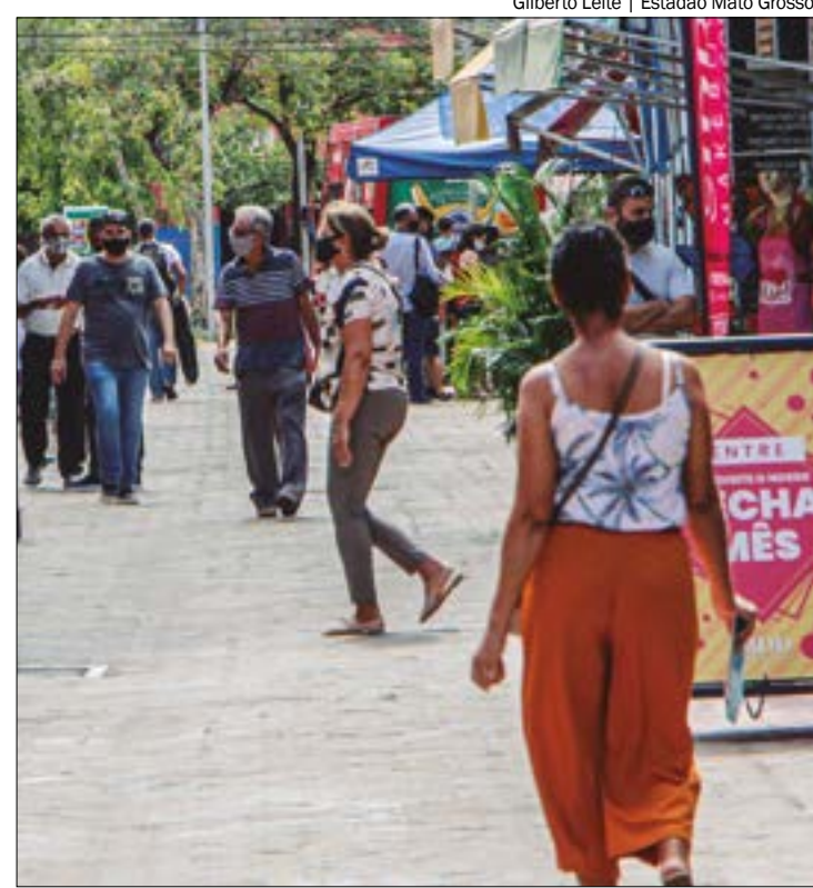
Gilberto Leite | Estádio Mato Grosso

Para o fim de 2025, a estimativa é que a taxa básica suba para 12,63% ao ano. Para 2026 e 2027, a previsão é que ela seja reduzida para 10,5% ao ano e 9,5% ao ano, respectivamente.