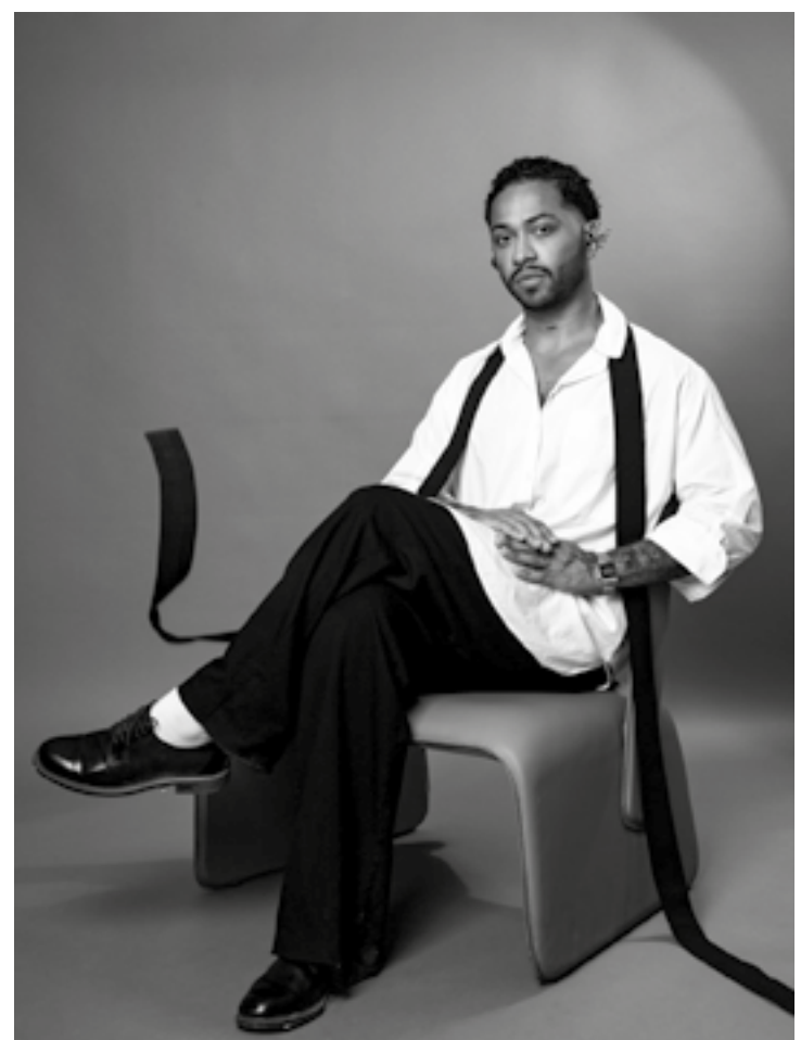
Melhor Projeto de Uso Público ficou com o ambiente Café O Sorriso do Gato, do arquiteto Nicholas Oher