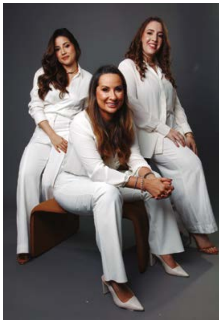
Melhor Paisagismo para o Espaço Gourmet, da arquiteta Rubia Moraes, da Casa Cinque Arquitetura