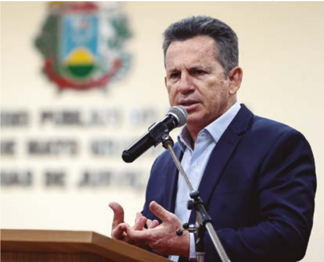
Governador também acusou o presidente francês de usar discurso ambientalista para criar barreiras contra o agronegócio

“O Brasil tem compromisso com respeito ao meio ambiente, rastreabilidade e boa sanidade. Não negamos discutir sustentabilidade, mas a nossa