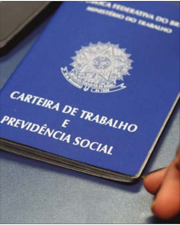
Com 1.012 vagas ativas em setembro, MT se destaca na criação de vagas com pagamento por horas trabalhadas