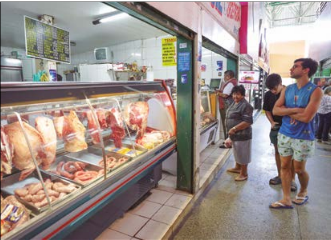
Carne bovina foi a principal responsável pelo encarecimento da cesta básica, com alta de 24,19% no ano

A carne bovina também havia registrado alta significativa na segunda semana de novembro, com o preço médio subindo para R$ 42,00 por quilo. Além disso, o óleo de soja manteve sua escalada de preços pelo sexto mês consecutivo, tornando-se um dos itens que mais pesam no orçamento familiar.