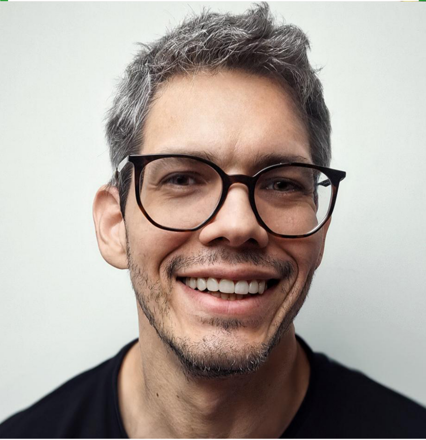
O talentoso fotógrafo Bruno Oliveira

O fotógrafo Bruno Oliveira, conhecido por suas imagens de casamento impactantes e emocionantes, tem deixado sua marca de bom gosto ao retratar profissionais em fotos corporativas e publicitárias.