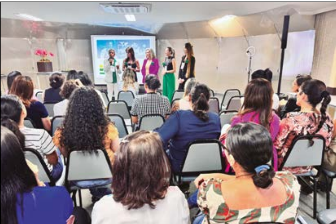
Número de mulheres empreendedoras no estado cresceu 32% em 2024 em comparação a 2023

O CME organiza eventos, encontros e treinamentos voltados para as empresárias associadas, fortalecendo redes de apoio e parcerias. Além disso, a ACCuiabá segue engaja-