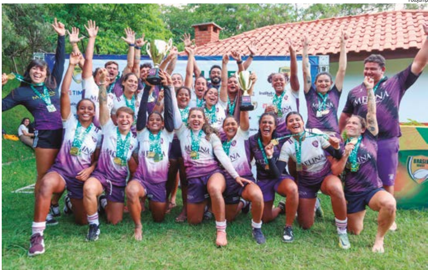
Com um desempenho dominante, as cuiabanas garantiram o título da elite nacional com um dia de antecedência

Com a temporada 2024 encerrada, os olhos se voltam agora para o Brasil Sevens, em dezembro, onde equipes lutarão por vagas na elite do Super Sevens 2025. Além disso, o torneio juvenil M19 formará as seleções que disputarão a Copa Cultura Inglesa, consolidando o futuro do rugby nacional.