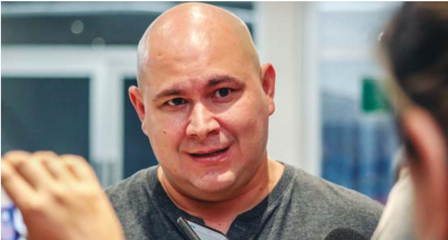
Brunini desmente artista trans e assegura que não haverá o encerramento da Secretaria da Mulher