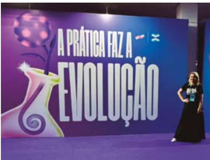
O evento tinha muitos espaços insta gramáveis e renderam muitos clicks