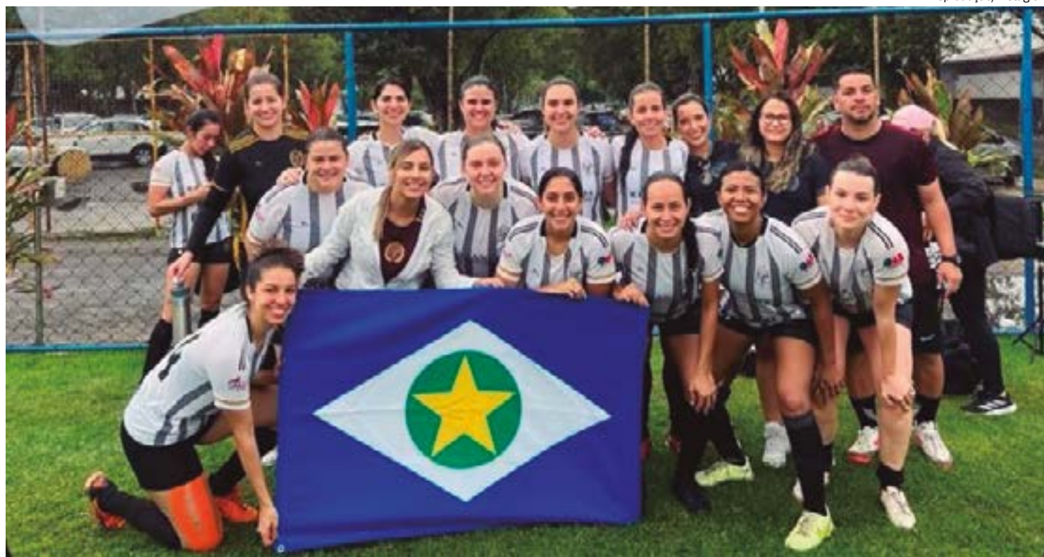
Seleção de advogadas de MT fez campanha brilhante rumo à final e faturou a taça nos pênaltis

O segundo tempo, supassumo da partida, contou com a Delação Premiada, reduzindo a vantagem em poucos minutos. Apesar da boa atuação do time, o 1x1 não permaneceu por muito tempo e logo, a seleção mineira virou o placar. Contudo, as representantes de Mato Grosso não desistiram e garantiram o 2x2, levando a decisão para os pênaltis, onde a Delação Premiada levou a melhor.