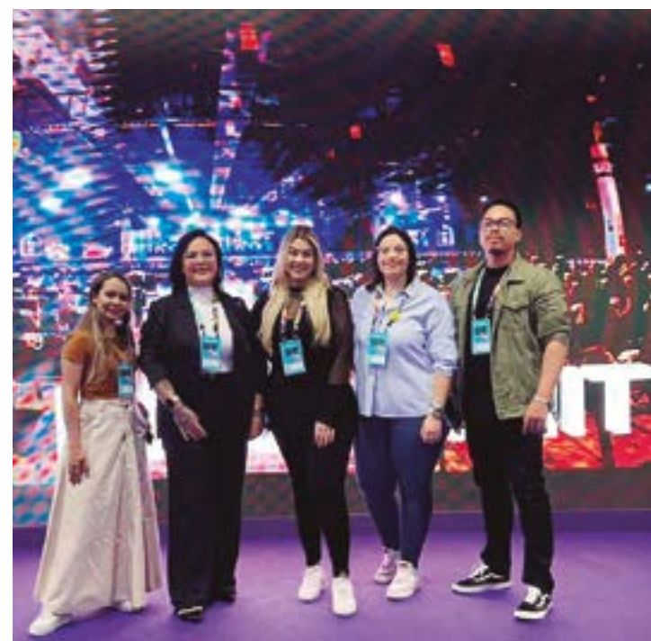
Levar parte da equipe para eventos como este é uma forma de valorizar o profissional!