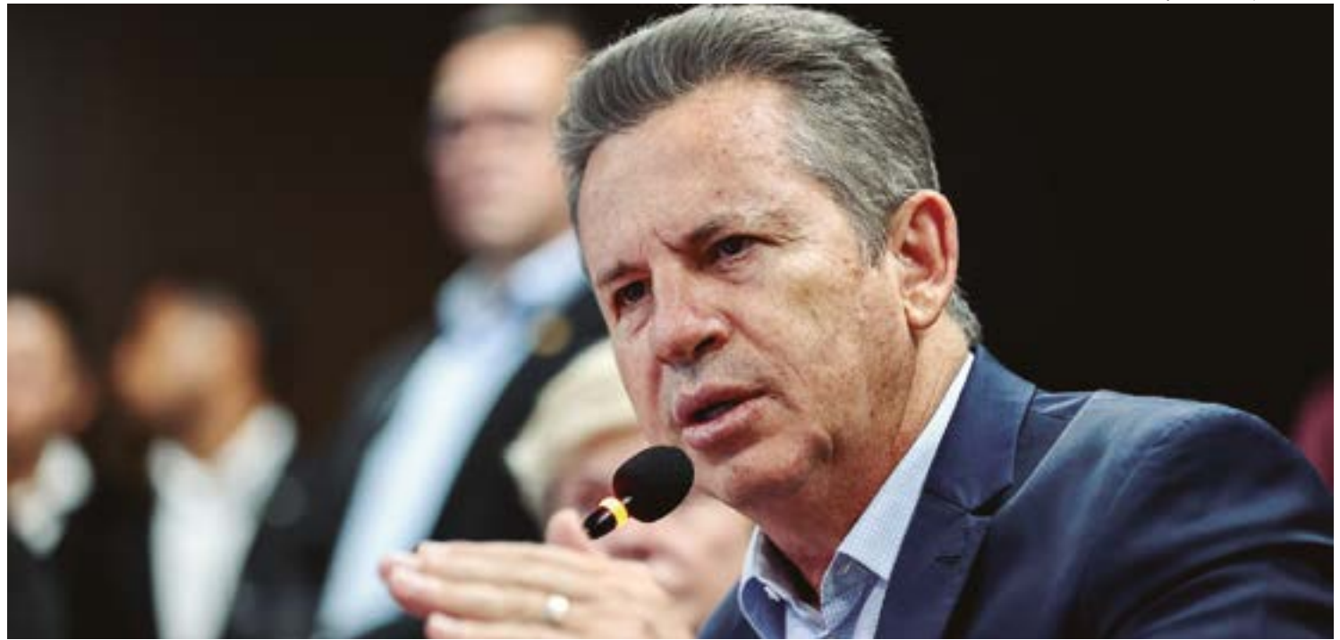
Mauro garante que não medirá palavras ao exigir leis mais severas aos ministros do STF em visita a Cuiabá

Mais recentemente, Mauro tem engrossado o coro de políticos que defendem a adoção do mode-