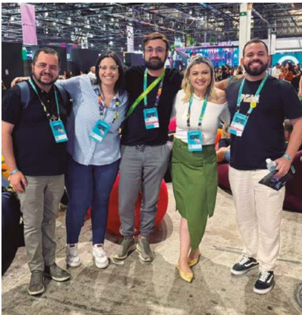
Equipe Webflavia e equipe do Colégio Salesiano Santo Antônio, clientes WF

Com a participação no RD Summit, a Agência Webflavia reafirma seu compromisso em oferecer serviços de alta qualidade e estar sempre à frente das necessidades do mercado. A agência está pronta para aplicar os novos conhecimentos em prol do sucesso dos seus clientes. Confira fotos