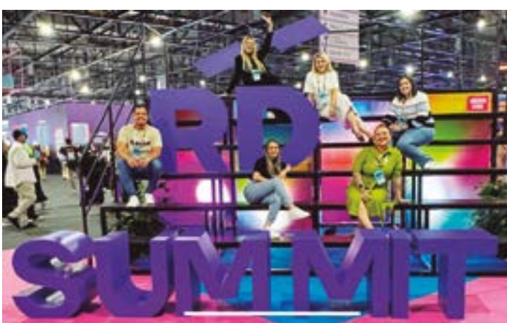
Toda equipe Webflavia reunida no último dia do RD SUMMIT 2024