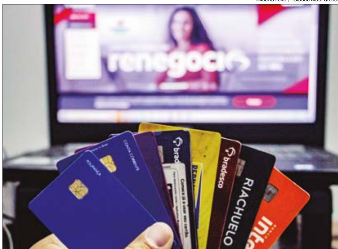
Cartão de crédito é o principal fator de endividamento, respondendo por 78,6% das dívidas

Em comparação com o mesmo período de 2022, os números reforçam essa tendência de alívio no endividamento: há um ano, 89,6% das famílias estavam endividadas e 22,3% delas inadimplentes, ou seja, com dificuldades para quitar suas contas.