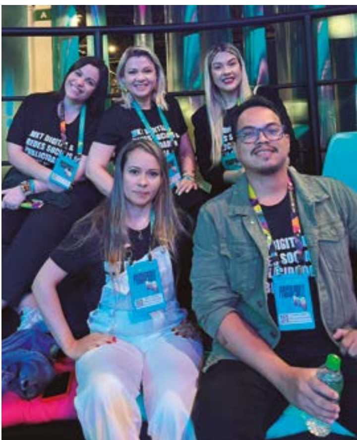
Equipe Webflavia Publicidade no espaço TikTok para Negócios