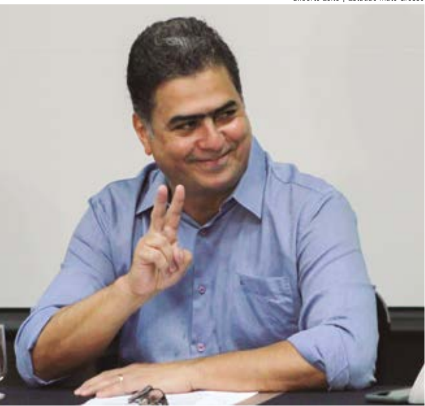
Emanuel foi afastado duas vezes pelo TJ, mas retornou ao cargo em pouco tempo