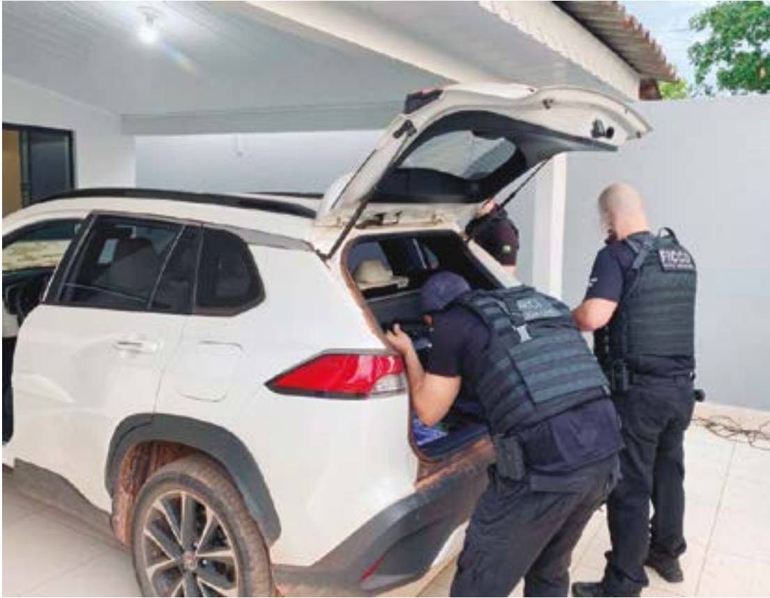
Segundo as investigações, Djavan se escondia em uma residência de luxo no bairro CoopHEMA

A Força Integrada de Combate ao Crime Organizado (Ficco-MT), com apoio do Batalhão de Operações Especiais (Bope), coordenou a operação, reunindo agentes da Polícia Federal, Polícia Rodoviária Federal, Polícia Civil,