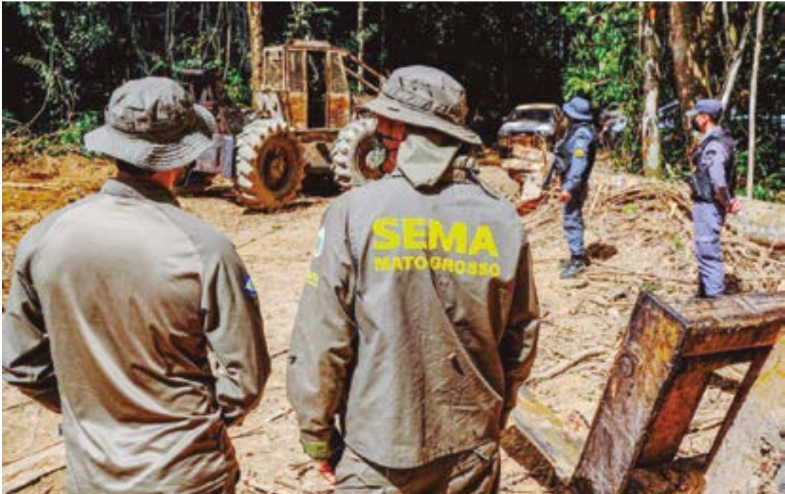
Entre janeiro e outubro, mais de 300 mil hectares de áreas foram embargadas por crimes ambientais

“Estamos intensificando nossas ações de combate aos crimes ambientais com uma fiscalização rigorosa, resultando não apenas na aplicação de multas, mas também no embargo das áreas onde foram constatadas ilegalidades, e na emissão de autos de infração. Esses procedimentos são essenciais para coibir que as práticas criminosas continuem ocorrendo, uma vez