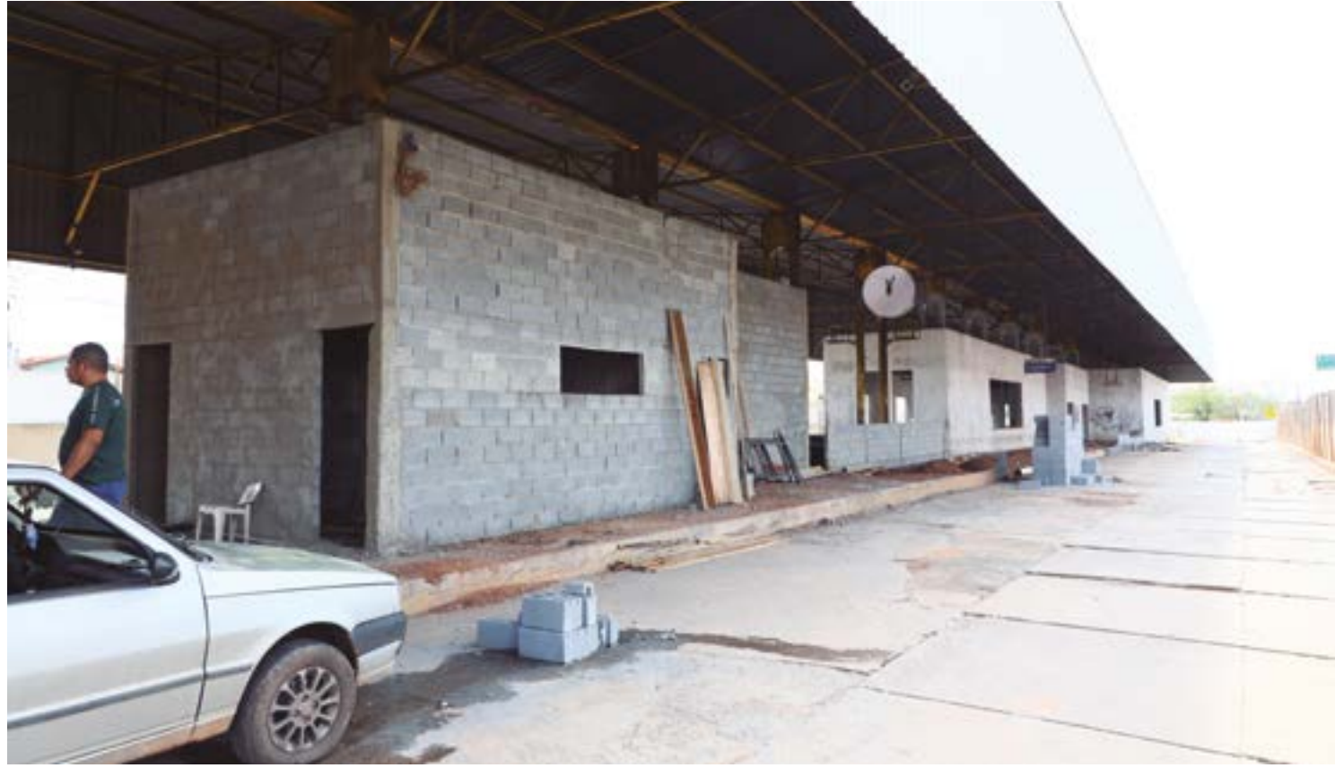
Terminal receberá uma estrutura completa e moderna, incluindo áreas de atendimento, banheiros e cantinas