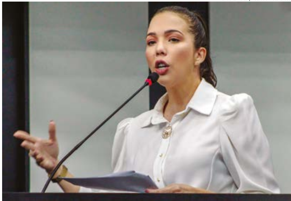
Gilberto Leite | Estadão Mato Grosso

A divulgação traz, ao menos, duas curiosidades. A primeira é a presença do vereador reeleito Sargento Joelson e da vereadora