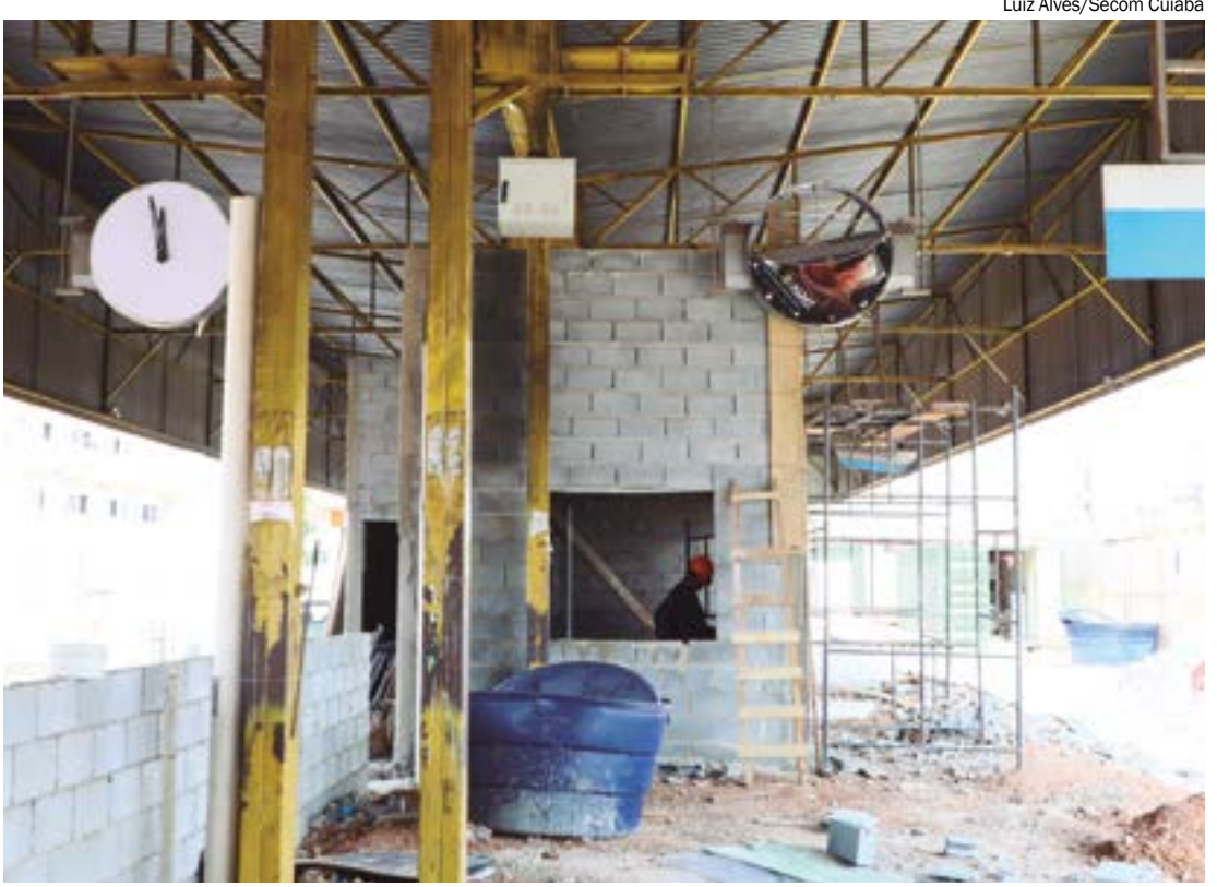
Luiz Alves/Secom Cuiabá