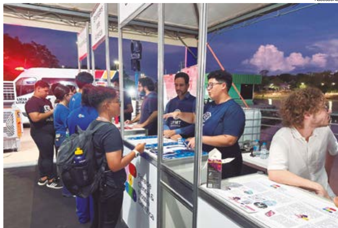
Feira contou com a participação de 28 escolas públicas de Cuiabá, cujos alunos apresentaram projetos científicos

"Alunos que participam de feiras e olimpíadas tendem a formar em cursos superiores. Então, hoje temos muitas olimpíadas, como a de matemática e a