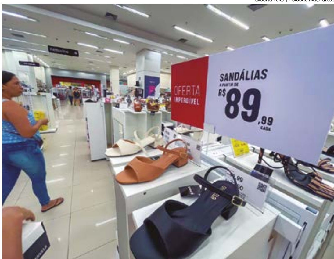
Gilberto Leite | Estadão Mato Grosso

As campanhas digitais, como e-mail marketing e promoções nas redes sociais, devem ser pensadas para fortalecer o relacionamento com o cliente. Além