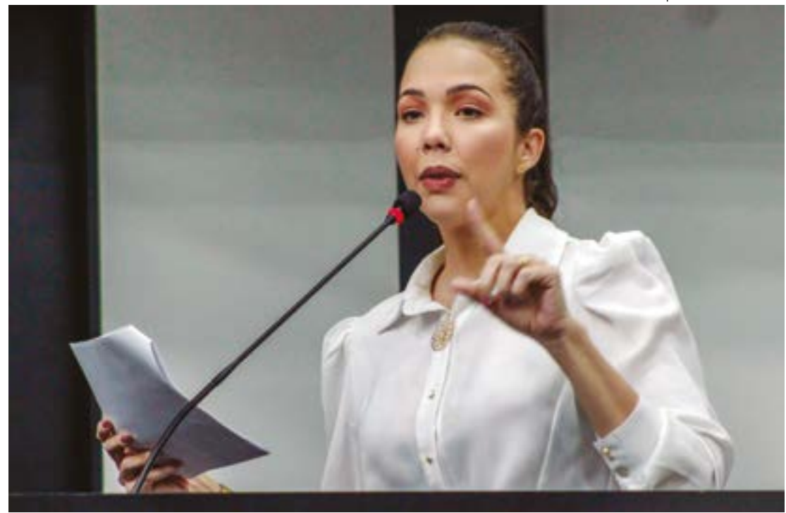
Gilberto Leite | Estadão Mato Grosso