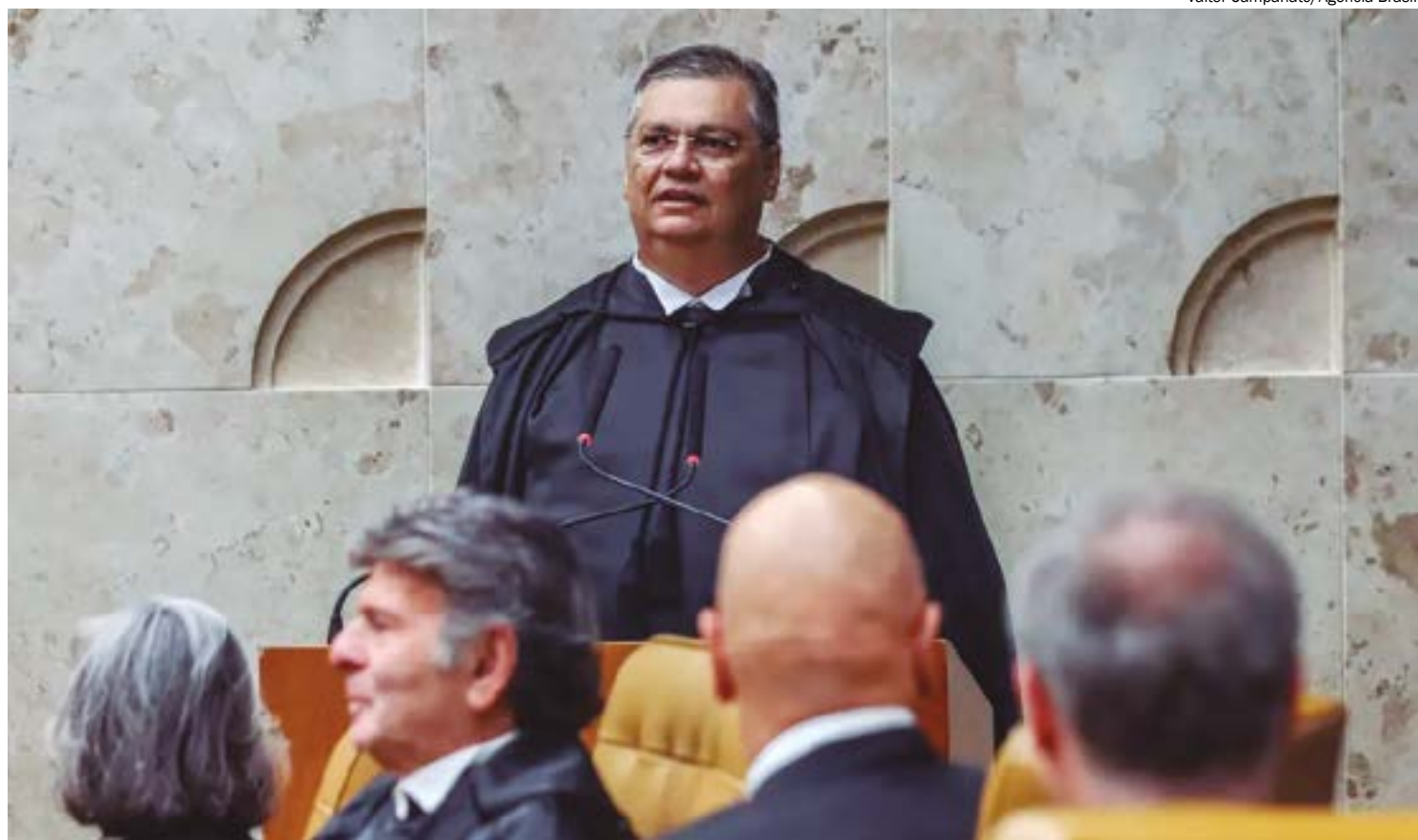
Entendimento de Dino para reduzir valor de emendas foi acompanhado pelo ministro Alexandre de Moraes

O procurador explicou que, como justificou Dino, a Assembleia tem semelhança com a Câmara Federal, pelo fato de ambas serem os representantes