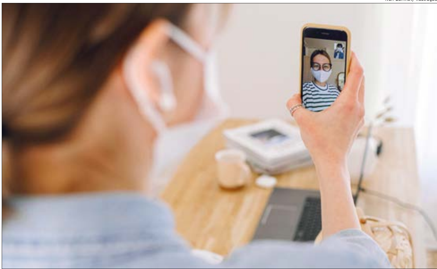
Plataformas digitais passam a oferecer tratamento via internet e relatam alta nas vendas

Segundo estudo feito pela Liga Insights, que traçou um mapa de startups brasileiras no mês de junho, as startups de saúde foram menos afetadas que as dos demais segmentos. “Embora otimistas,