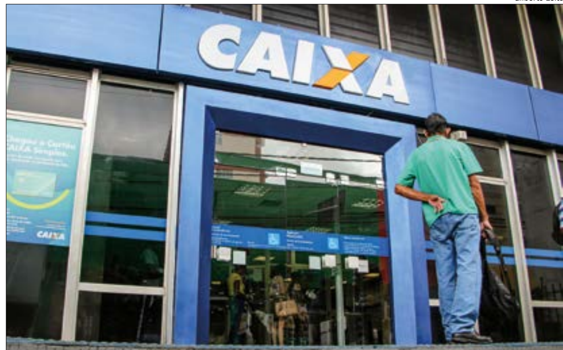
Os trabalhadores poderão antecipar até três saques a que têm direito na modalidade Saque-Aniversário