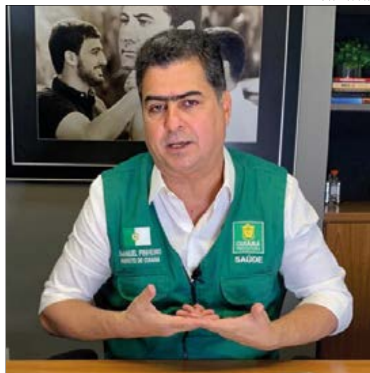
Emanuel aponta que quarentena dificultou a fiscalização e não surtiu o efeito desejado

"O Município é totalmente favorável à aplicação de ações de proteção à saúde pública, desde que as mesmas tenham um embasamento técnico e não sejam simplesmente estabelecidas por uma decisão judicial", diz trecho da nota.