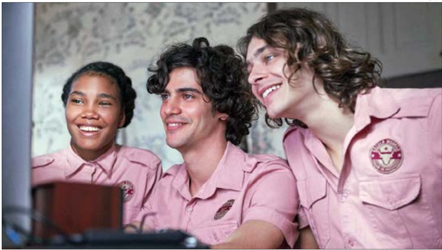
Chico, Fran e Alex são os aventureiros que vão sair em busca de respostas para a misteriosa epidemia que assola 'Progresso'

Para temperar o mistério, uma boa pitada de drama. Os adolescentes de Progresso enfrentam vários problemas familiares e preconceitos de todo