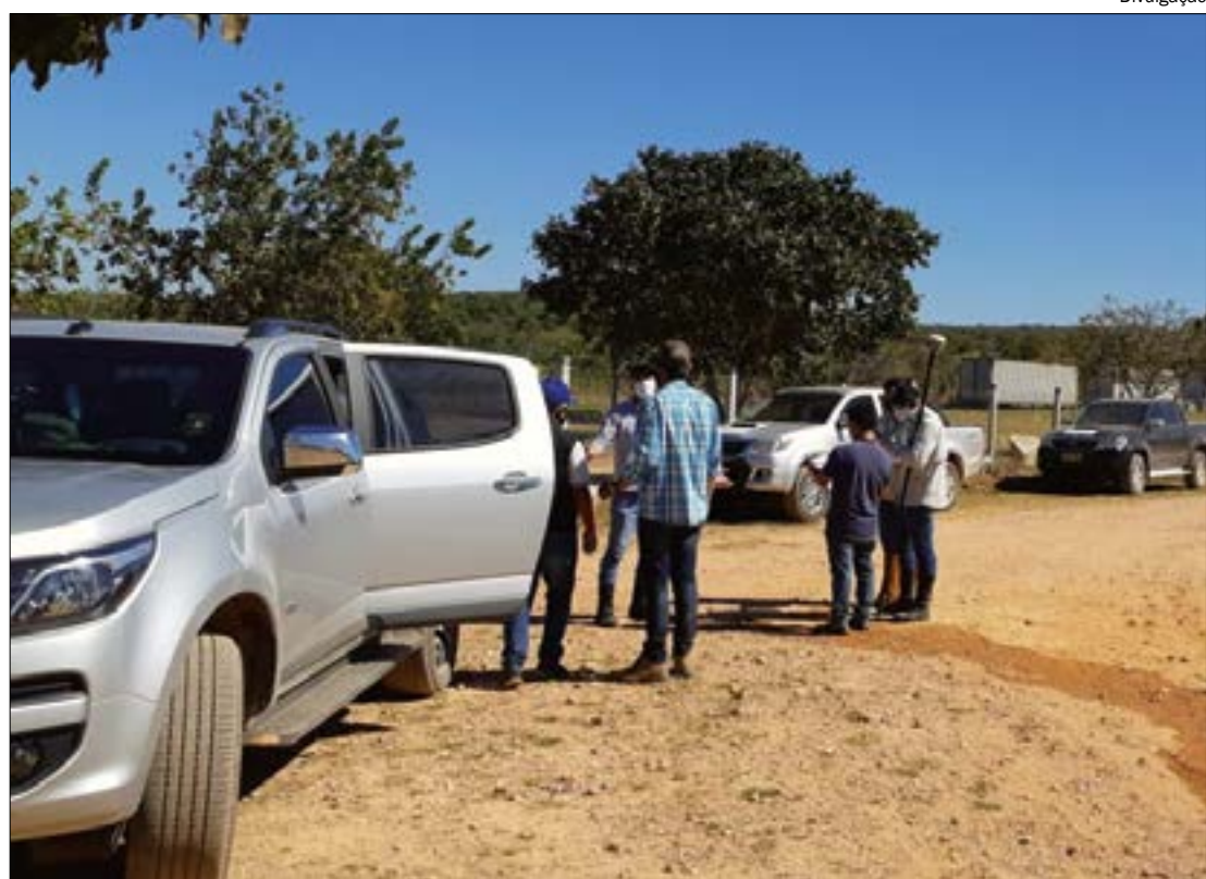
Oficiais de Justiça estiveram ontem no vilarejo de João Carro para cumprir mandados de desapropriação

Os moradores também pediram ao Ministério Público para entrar com ações contra Furnas