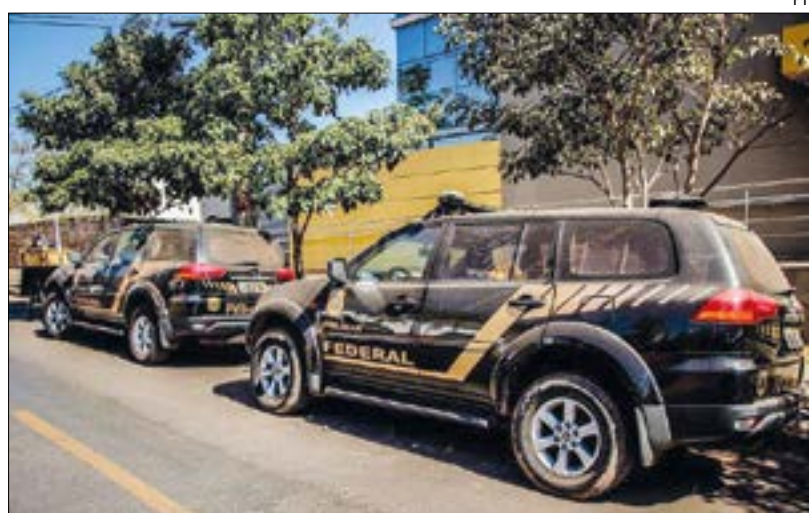
Os 18 mandados de busca e apreensão foram cumpridos em Cuiabá, Brasília, Itaúba, Porto Velho e São Paulo

A organização criminosa é composta por servidores públicos, advogados e empresários que, por meio de empresas e o pagamento de