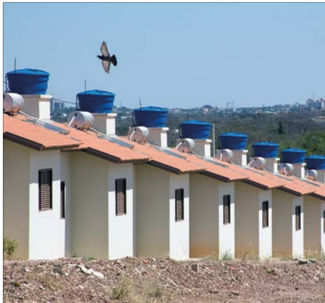
A medida faz parte das ações do banco para oferecer aos clientes alternativas para enfrentar os efeitos causados à economia pelo Covid-19