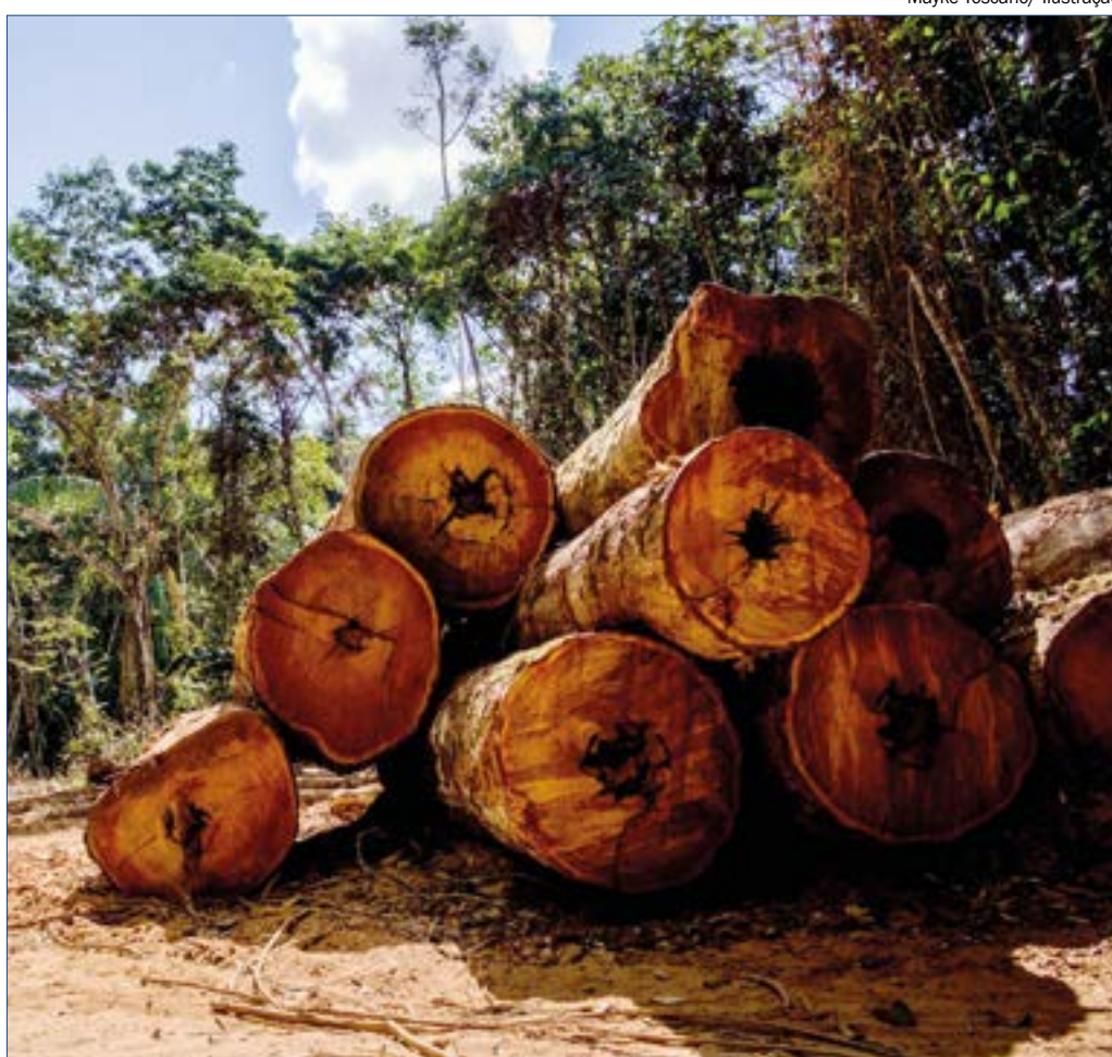
Mayke Toscano/ Ilustração