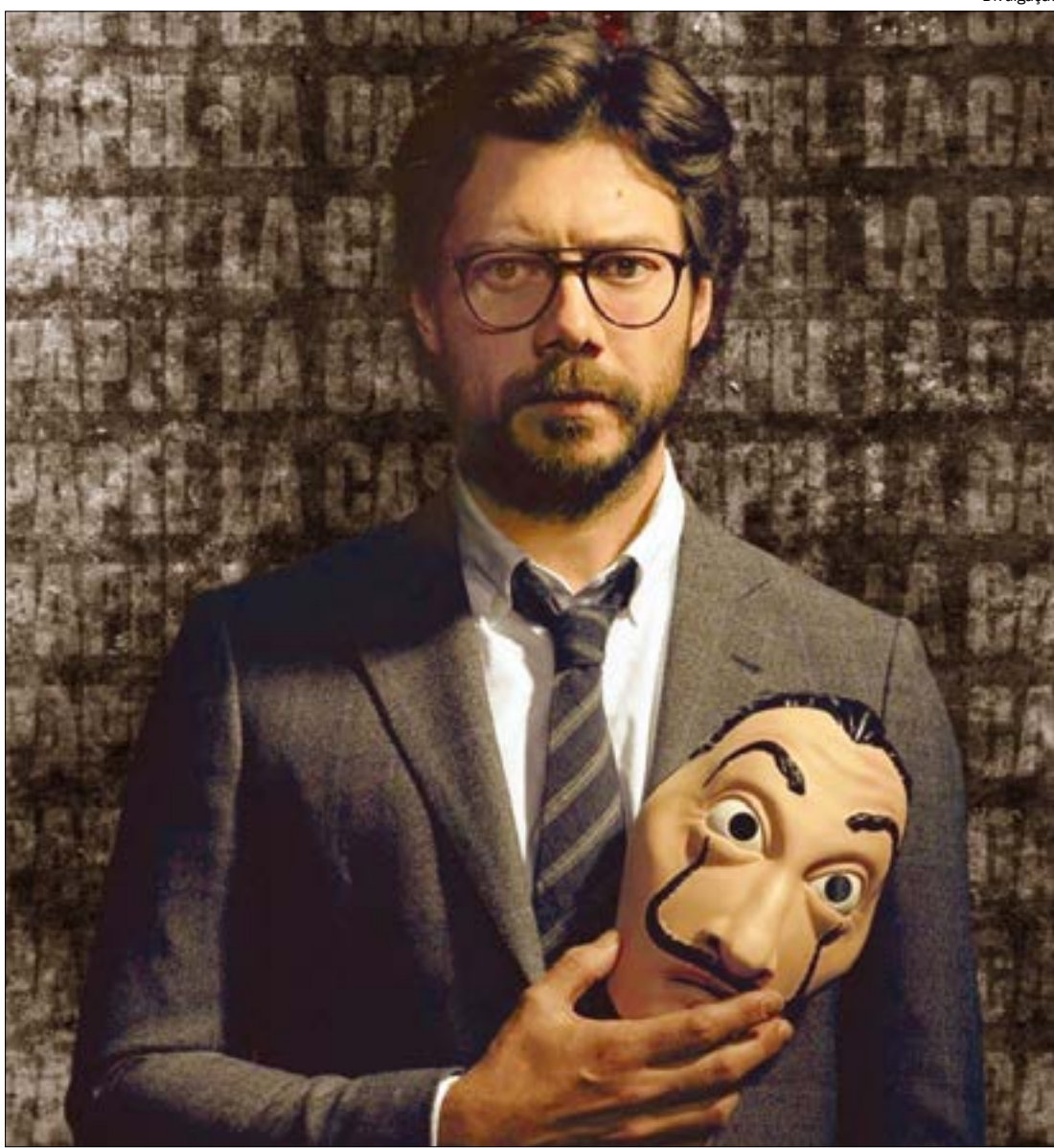
O Professor voltou para tranquilizar os fãs: 5ª temporada já está sendo gravada, apesar da pandemia