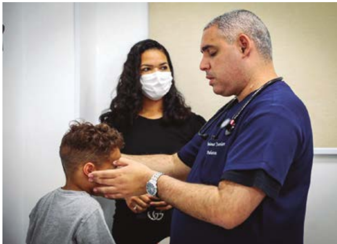
Unidade é equipada com tecnologia de ponta e conta com uma equipe multidisciplinar de pediatras

A reforma, que recebeu um investimento de R$ 3 milhões, transformou a antiga estrutura de mais de 200 anos do pronto atendimento em um espaço moderno e acolhedor, preparado para atender às