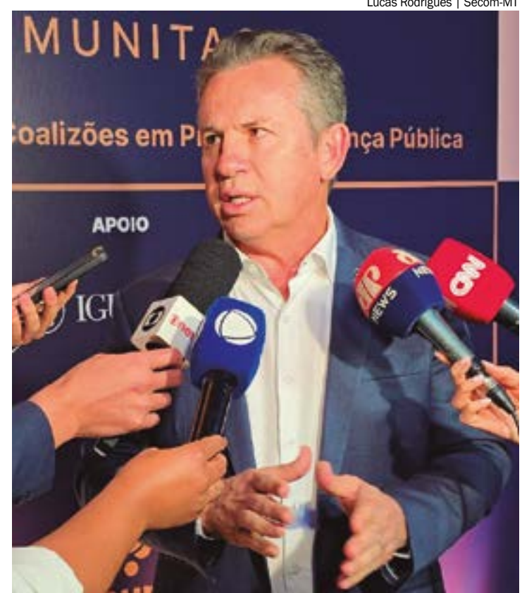
Mendes defendeu a necessidade de endurecer as leis como forma de enfrentar o avanço da criminalidade

O painel também contou com a participação dos governadores Eduardo Leite (Rio Grande do Sul) e Romeu Zema (Minas Gerais).