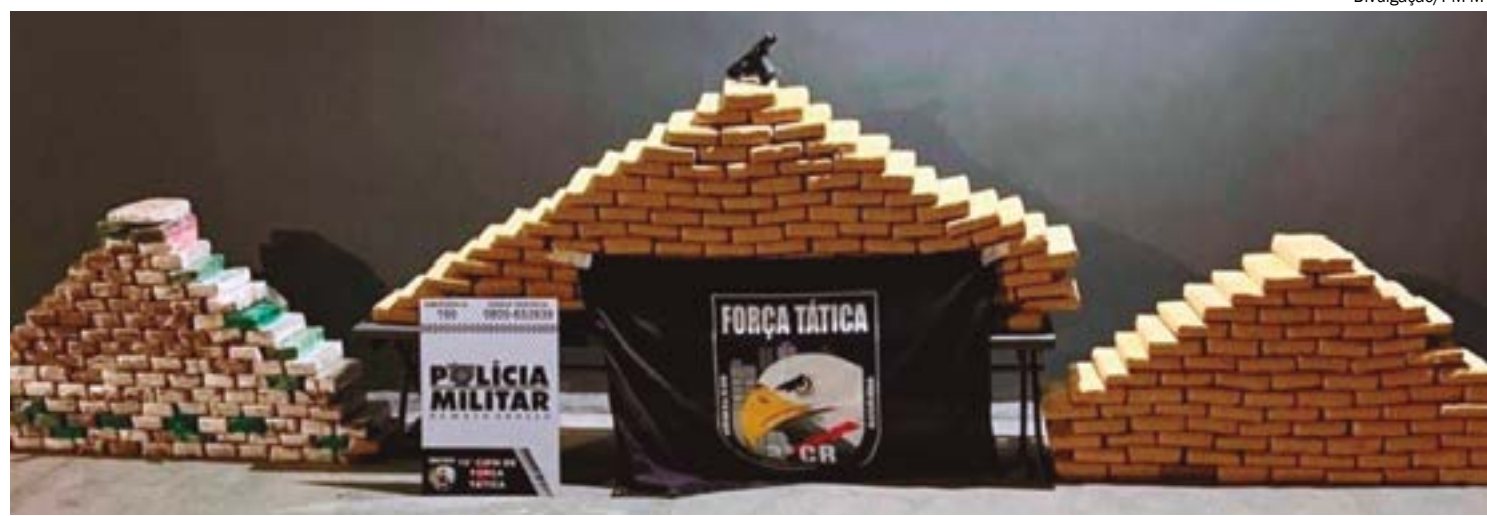
Forças de segurança do Estado já apreenderam quase 900 quilos de entorpecentes em 2024