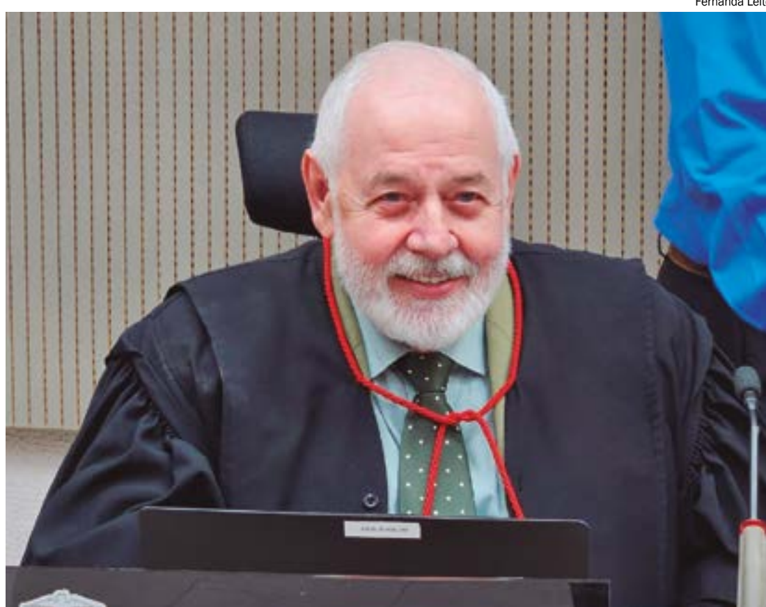
Para o presidente eleito do TJMT, Pacote Anti-STF evidencia o momento delicado do Poder Judiciário

Além disso, também há previsão para que os congressistas possam revisar as decisões do Supremo, o que poderia em tese fragilizar e intimidar a atuação do Poder Judiciário.