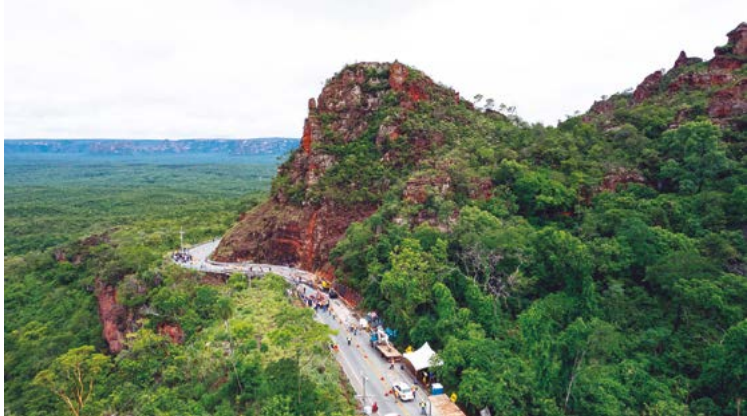
Trânsito no Portão do Inferno será fechado nesta terça e quarta-feira para retirada da vegetação