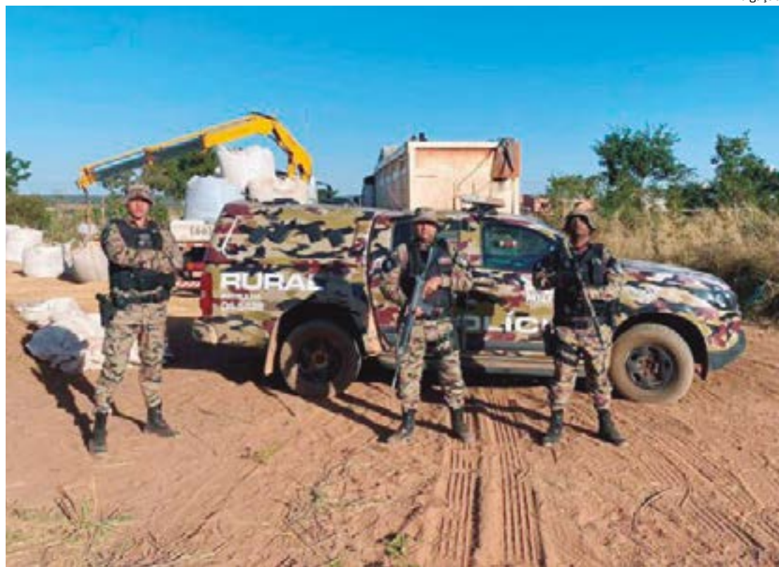
Estatísticas registram quedas significativas com a implantação dos serviços da Patrulha Rural

Somente em 2023, a Patrulha Rural recebeu cerca de R$ 18 milhões em investimentos em viaturas, fardamentos, armamentos e munições, e passou a usar o georreferenciamento no monitoramento das áreas rurais.