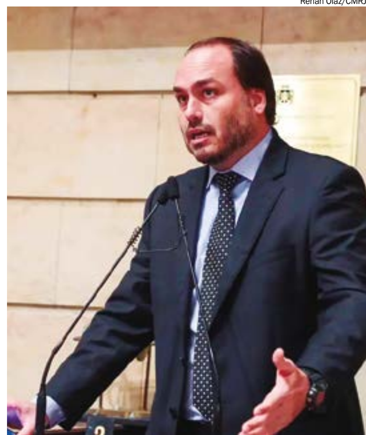
Candidatura de Carlos Bolsonaro ao Senado por MT está descartada, garante Eduardo

Mato Grosso foi apontado como uma possível alternativa devido ao fato de ter sido um dos estados onde Jair Bolsonaro teve grande apoio nas últimas duas eleições presidenciais.