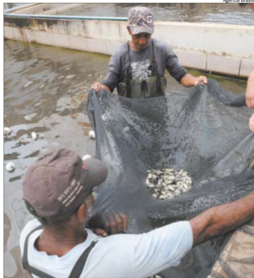
Produção de tilápia é regulamentada em Mato Grosso e deve ganhar novos adeptos