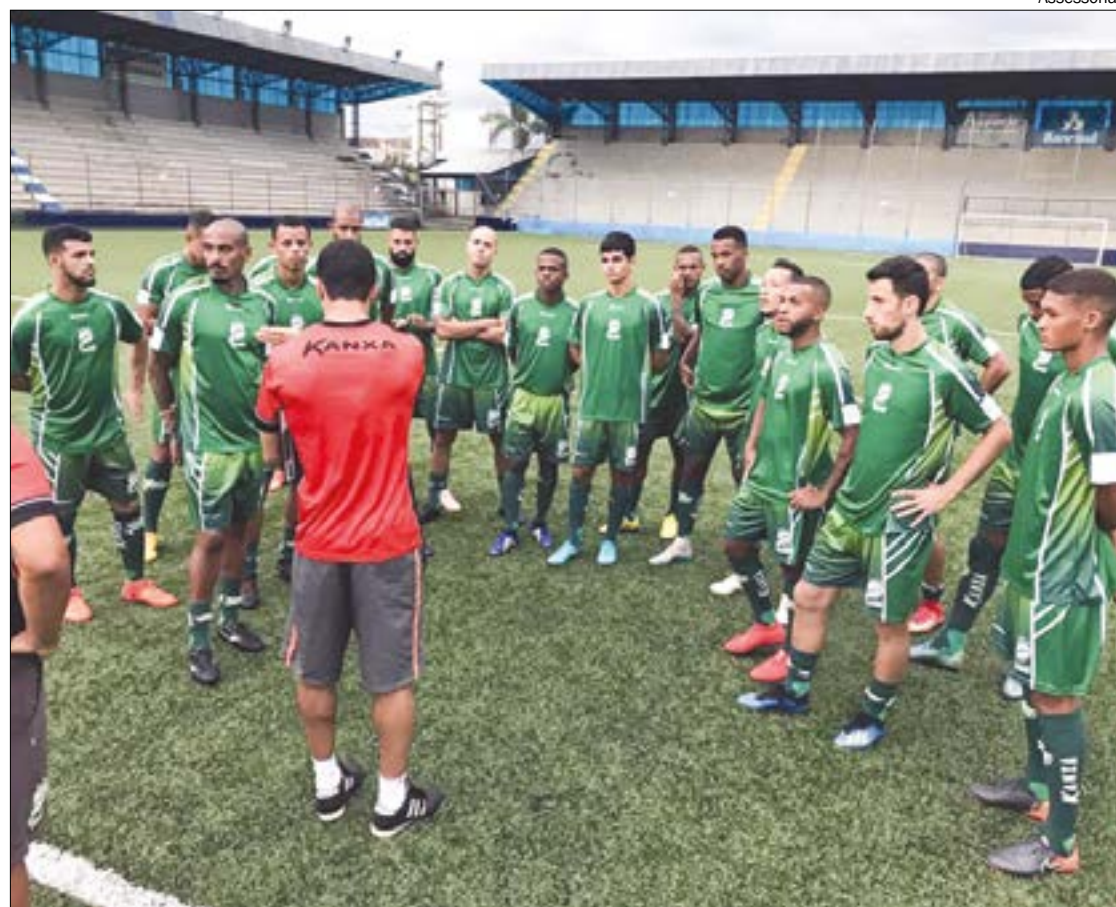
Sem vencer há quatro jogos, LEC tenta se recuperar com novo técnico e avalia contratação de reforços