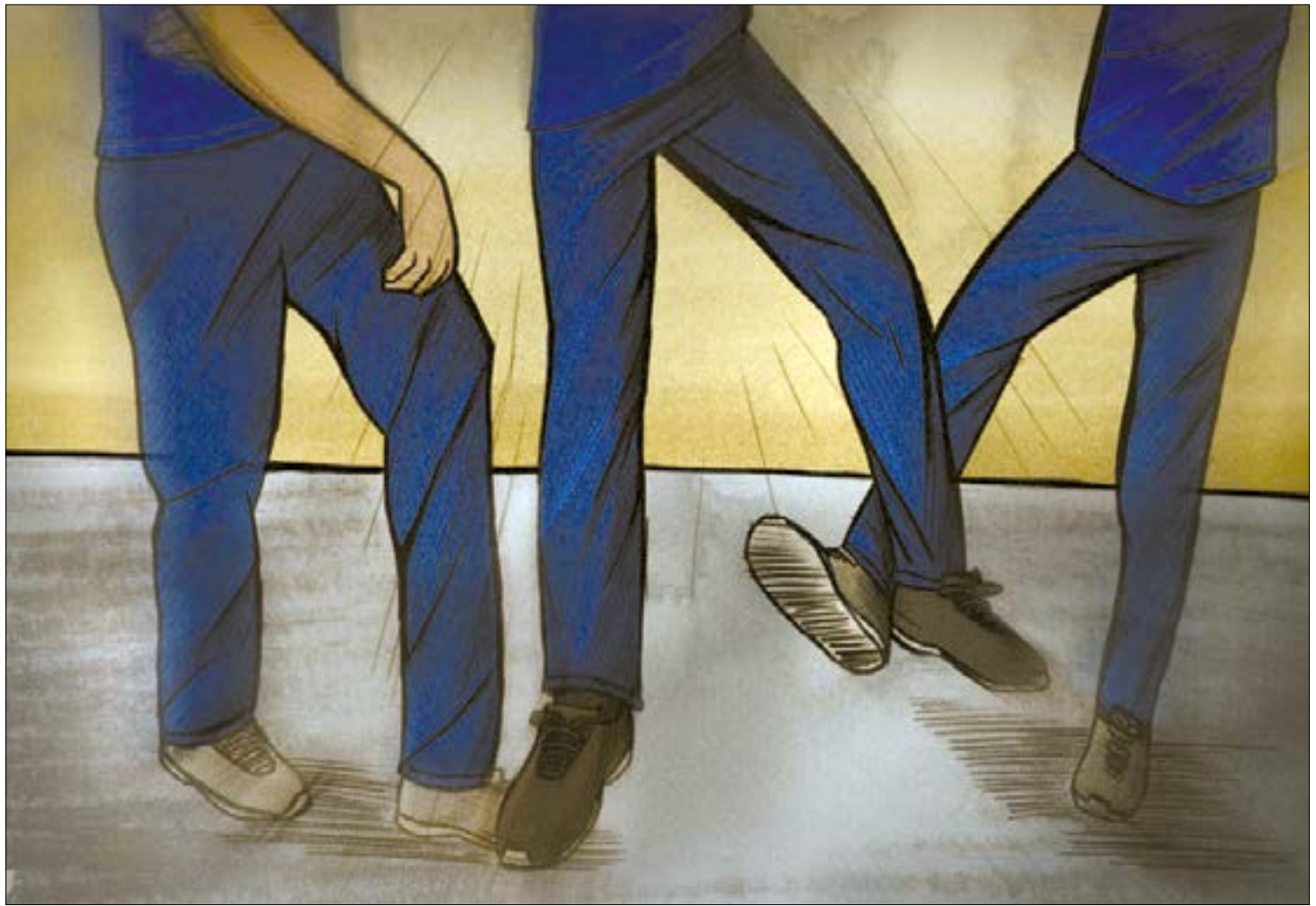
A brincadeira também ganhou o nome de “quebra crânio”, roleta humana e tem preocupado pais, educadores e profissionais da saúde

A coluna também pode ser afetada, embora o risco seja maior