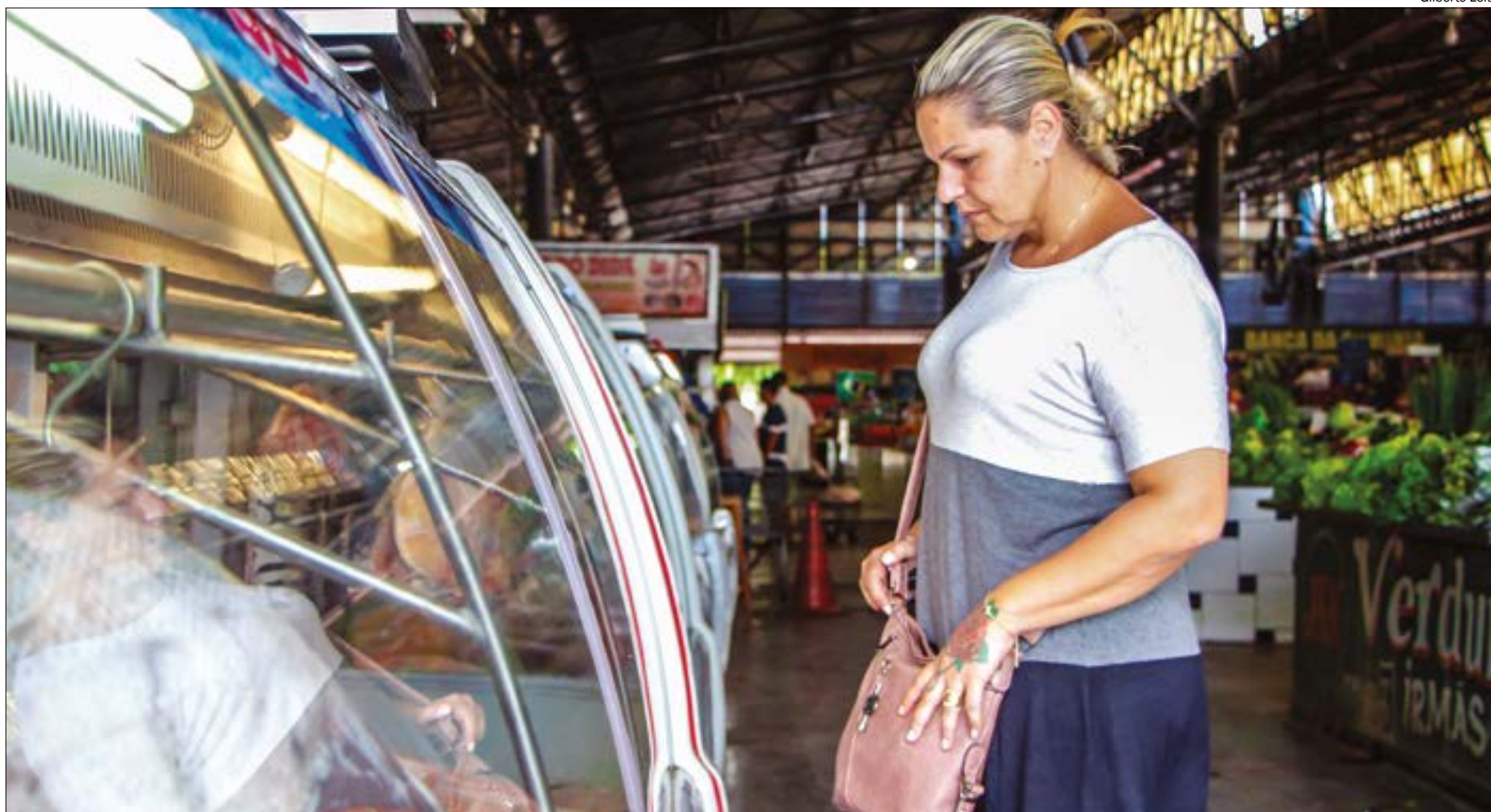
Varição do dólar influencia custo com alimentação e já aumenta preços nas gôndolas de mercados

A cotação do dólar tem se mantido acima dos R$ 4 desde o final do ano passado. Após a abertura do mercado nesta quarta-feira (13), a moeda americana chegou a R$ 4,38, uma reação negativa dos mercados aos comentários feitos pelo ministro da Economia, Paulo Guedes, sobre o câmbio. A nova alta pode se refletir em novo reajuste de preços da tilápia, pelo fato de o peixe ser considerado uma commodity.