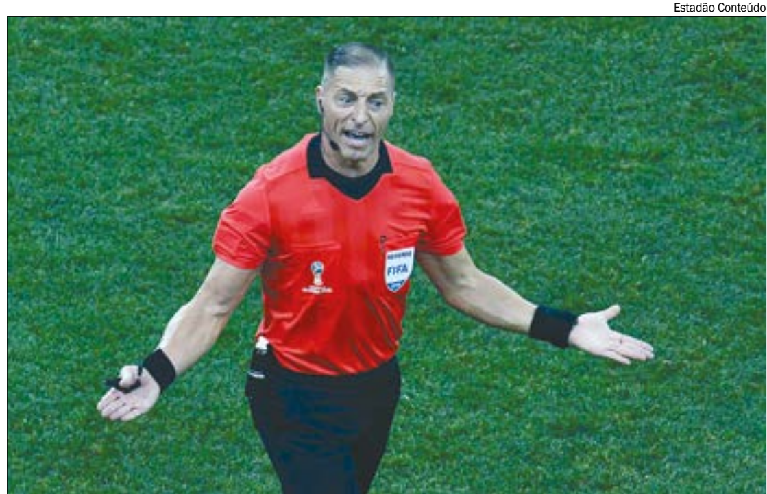
Néstor Pitana é figura conhecida dos corintianos e apitou as últimas quatro eliminações do time na Libertadores

a final disputada entre clubes da Europa e da América, como em 2019, quando o Liverpool superou o Flamengo em dezembro. A Fifa, porém, decidiu reformular o torneio, que a partir de 2021 vai ser realizado a cada quatro anos e com a presença de 24 participantes - atualmente, são apenas sete.