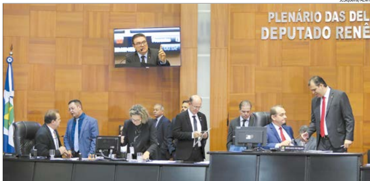
Deputados vão articular junto ao ministro Gilmar Mendes, no STF, para manter o Fethab

Segundo a ação do SRB, o Fethab vem causando um permanente aumento de custos para agricultores de Mato Grosso, que comercializam a produção para outros estados e para o exterior. De acordo com a entidade, produtores mato-grossenses