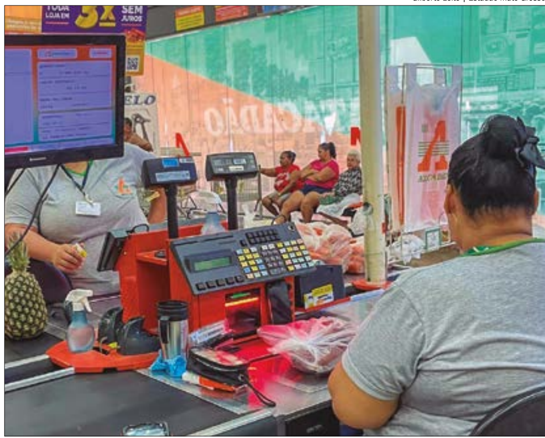
Alívio no preço da cesta básica é puxado pelos hortifrutis; carne atinge maior preço no ano

Outro alimento que segue apresentando crescimento no ano é o café em pó, que, de janeiro a setembro desse ano, já encareceu 31,5% e fechou o mês custando R$ 24,17 em média. A análise do IPF para o aumento de preço pode ter relação com a estiagem severa que afeta as principais regiões produtoras.