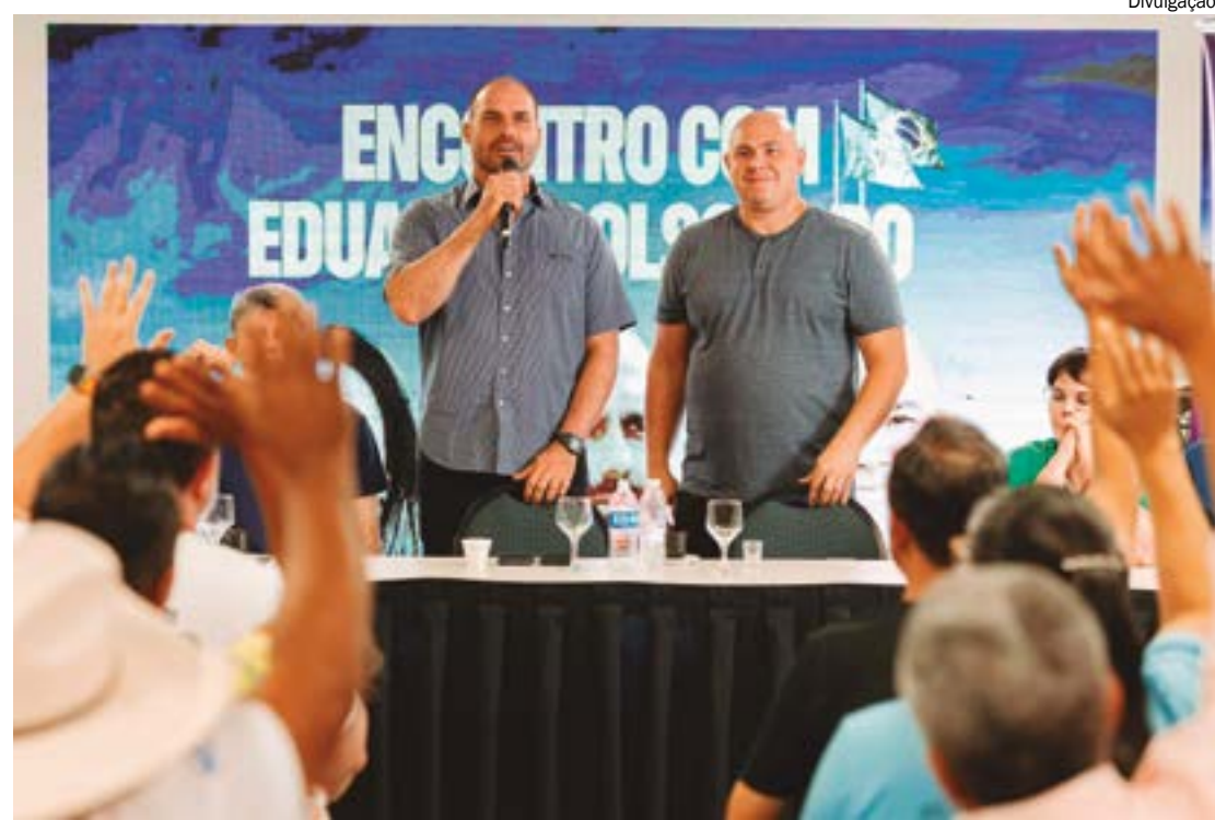
Eduardo Bolsonaro visitou Cuiabá na última semana para 'dar um gás' na campanha de Abílio

FORTALECIMENTO DO PL - Além de 'dar um gás' na candidatura de Abílio, Eduardo fez um apelo aos eleitores para eleger mais vereadores do Partido Liberal, com o objetivo de fortalecer a base política da sigla em Cuiabá. Atualmente, o partido conta com apenas duas cadeiras na Câmara Municipal, ocupadas por Chico 2000 e Felipe Corrêa, que buscam a reeleição. Com o apoio da família Bolsonaro e de puxadores de voto, a sigla projeta eleger cinco nomes para a Câmara.