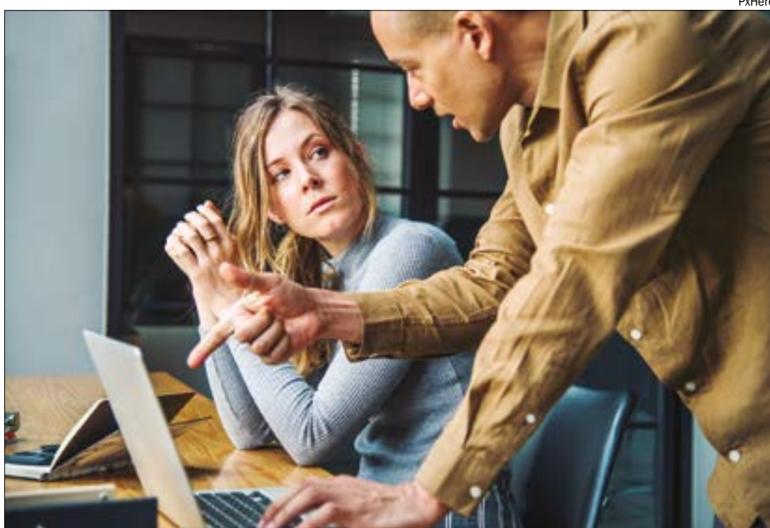
Em cargos de direção e gerência, a diferença salarial entre homens e mulheres chega a 38,6% em Mato Grosso

O documento também registrou que 55,2% das empresas mato-grossenses possuem planos de cargos e salários; 27% têm