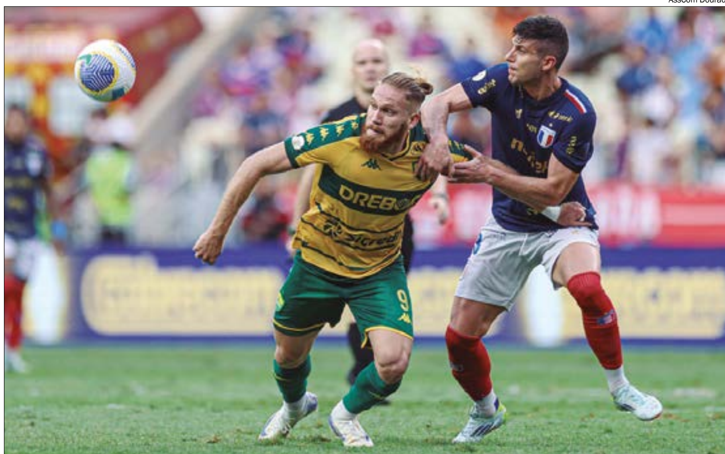
Dourado não conseguiu criar ofensivamente e sofreu nova derrota no Brasileirão, mas técnico vê pontos positivos

"Nosso plano de jogo passava por isso, em controlar melhor as situações de jogo do For-