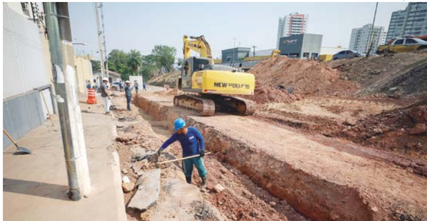
Adutora será realocada para escavação de um túnel sob a Avenida Miguel Sutil