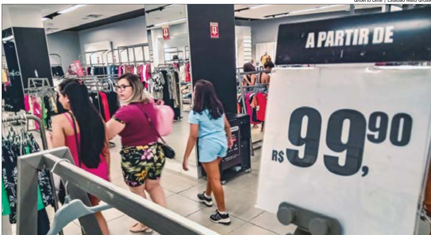
Melhora do indicador pode ter sido impulsionada pelo aumento na geração de emprego, aponta Fecomércio

O instituto também averiguou que o índice atual se mantém acima dos 100 pontos, o que indica um grau de satisfação para o consumo. Acima do registrado na média nacional,