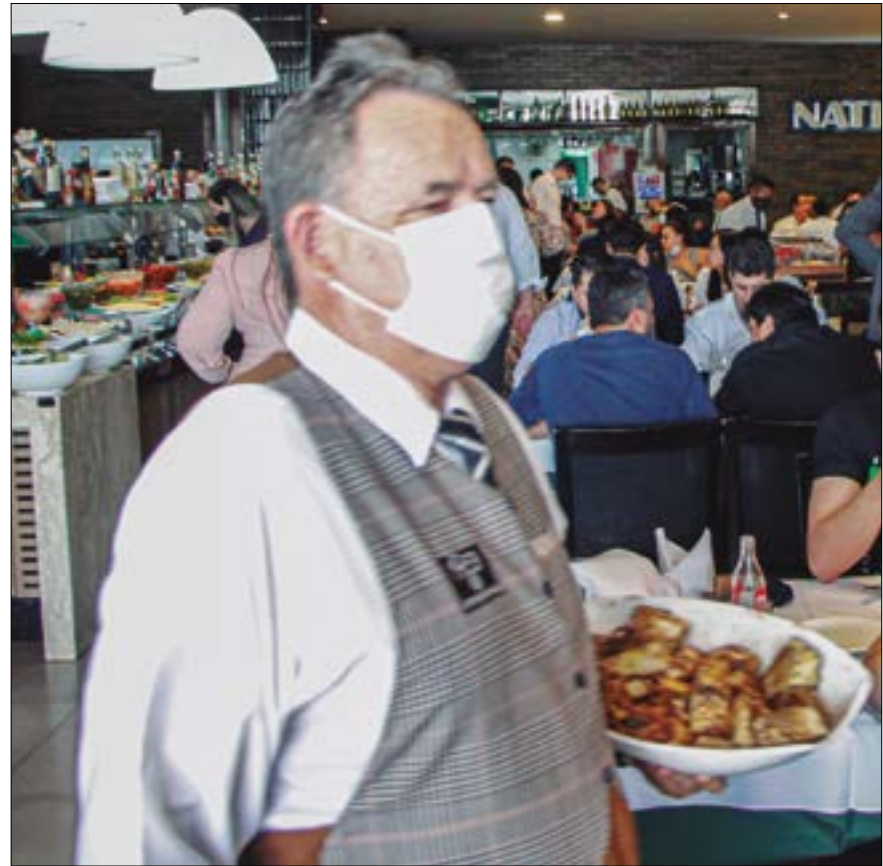
De acordo com o levantamento, 21% dos estabelecimentos registraram perdas no último mês