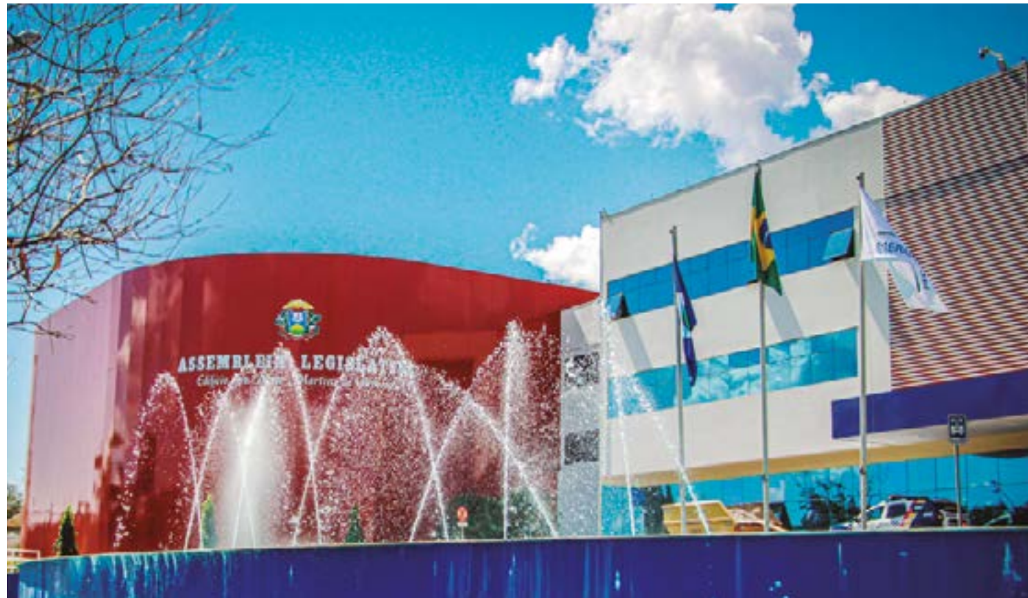
Casa afirmou ao STF que anulação do direito irá retirar contribuições da previdência, causando rombo no caixa estadual

Em petição ao STF, Assembleia defende aposentadoria de servidores contratados e cita risco ao caixa do Estado caso contribuição seja cancelada