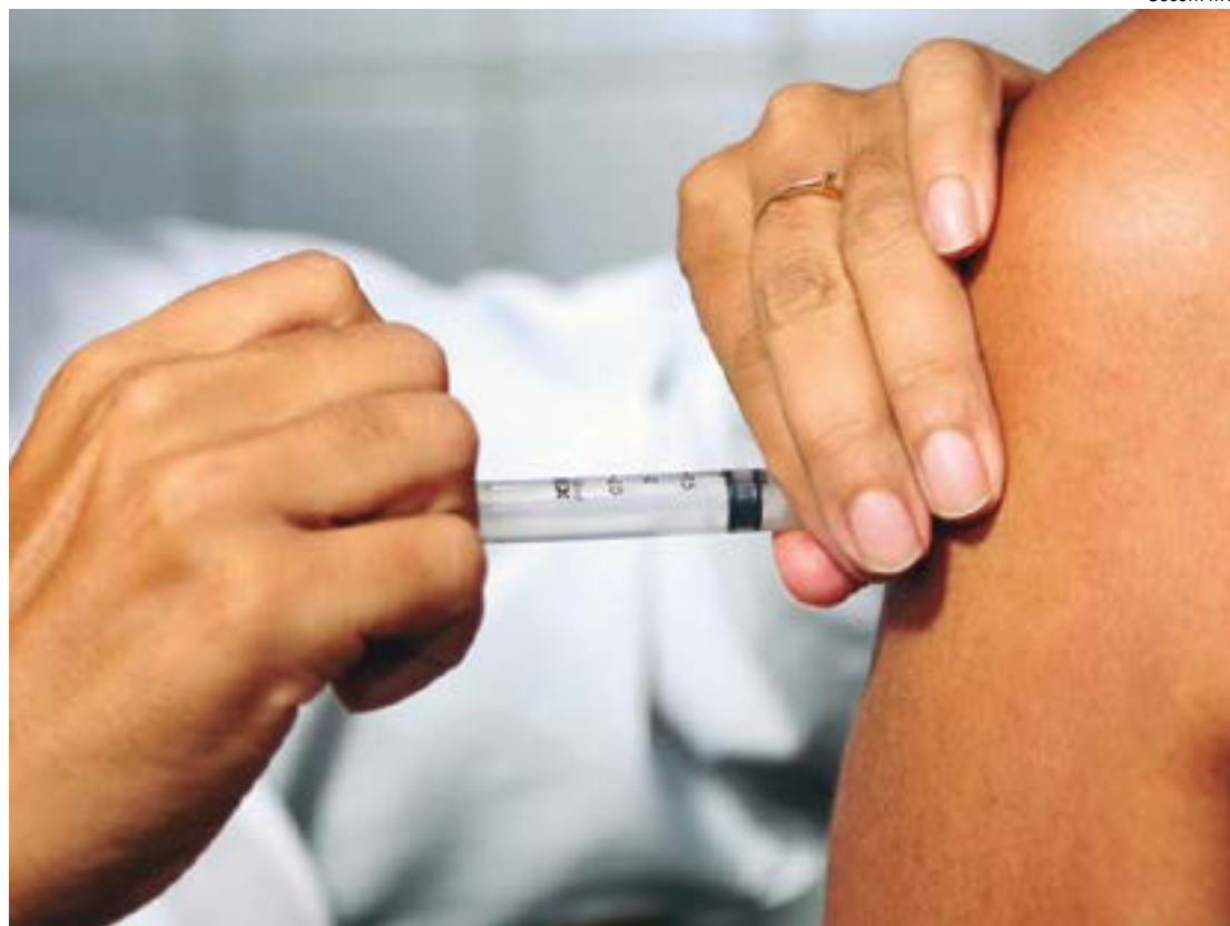
Até o momento, foram aplicadas 16.938 da primeira e apenas 1.624 da segunda dose em Mato Grosso

"Precisamos aumentar a adesão do público alvo, os adolescentes, que frequentemente não acessam os serviços de saúde de forma regular e tem o maior número de hospitalizações por dengue", acrescenta.