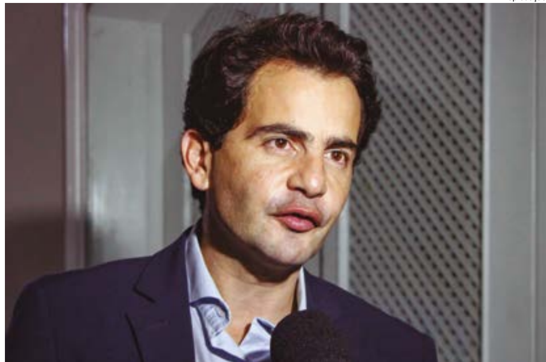
A fala de Garcia é contrariada por especialistas, que alegam que a presença de gado em áreas protegidas resulta em assoreamento