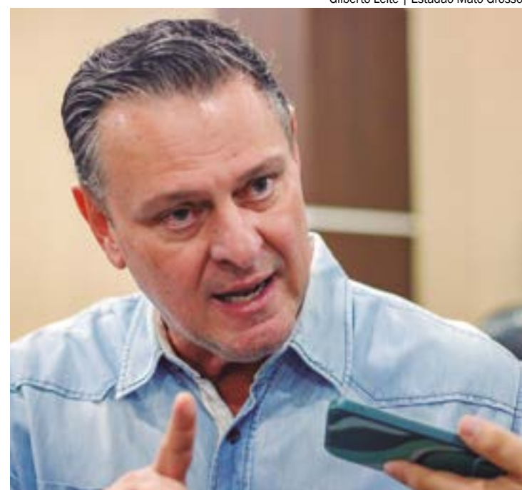
"A ideia é impulsionar o setor, sem promover mais desmatamento de florestas e do Cerrado", disse o ministro Carlos Favaro

Um exemplo disso é a grande quantidade de ondas de calor que têm se espalhado por diferentes regiões do planeta. Em Mato Grosso, por exemplo, as temperaturas elevadas têm aumentado o número de focos de incêndio, destruindo os biomas e tornando cada vez mais difícil seu combate.