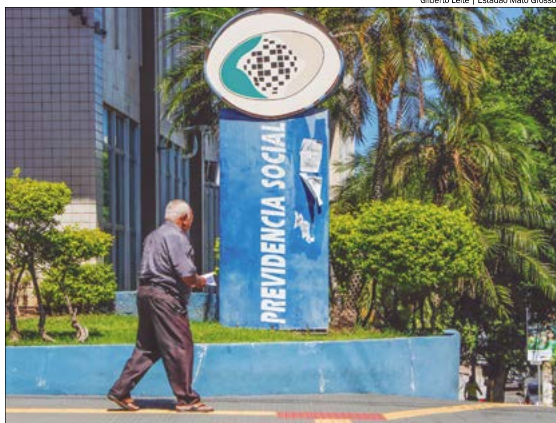
Atualmente, novos aposentados e pensionistas não podem contratar crédito consignado nos 90 primeiros dias após a concessão