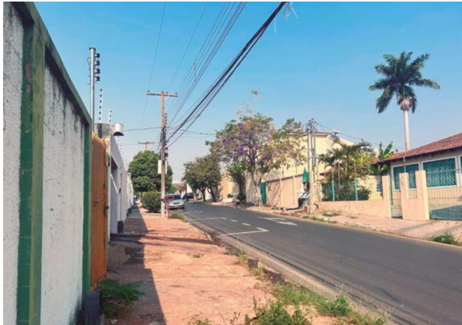
Estadão Mato Grosso

A arrecadação, que deve começar no dia 24, é estimada em R$ 500 mil a R$ 1 milhão por mês