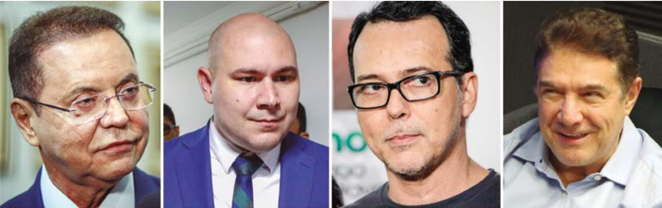
Botelho aparece com 31,2% das intenções de voto, seguido de Abílio com 23%, Lúdio com 17% e Kennedy alcançando 8,4%, sendo destaque

O levantamento aponta que houve pouca mudança no cenário político, com destaque para o candidato do MDB, que dobrou as intenções de voto