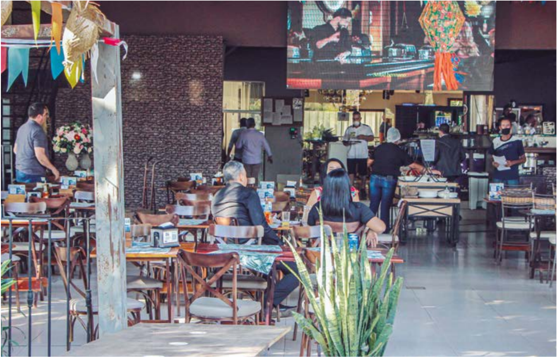
Gilberto Leite | Estadão Mato Grosso