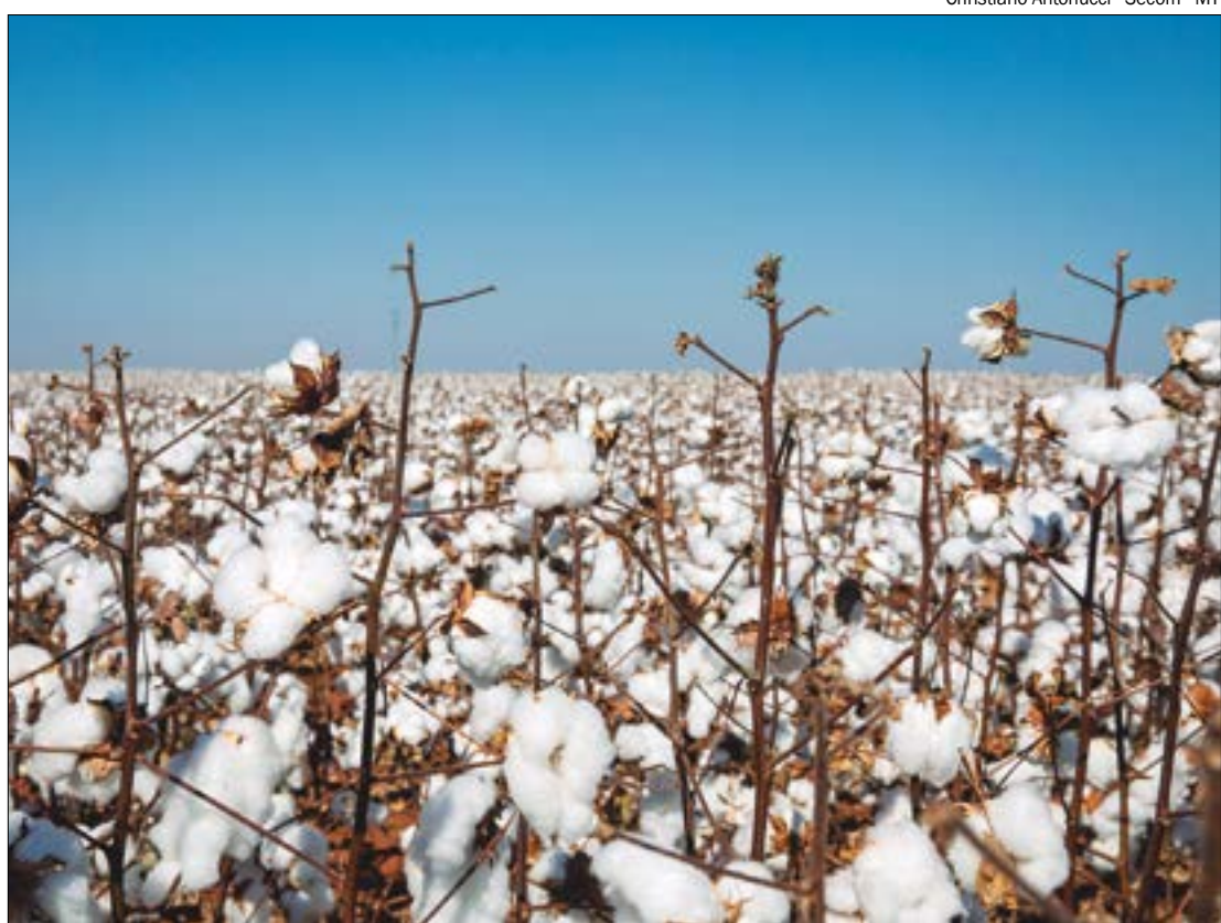
Uma das maiores indústrias do setor será inaugurada em Nova Mutum neste ano em um investimento de R$ 261,4 milhões

Além da Icofort Agroindustrial, outras indústrias do segmento poderão ter diferimento de ICMS na entrada do óleo bruto de algodão destinado ao processo industrial de óleo vegetal para alimentação humana.