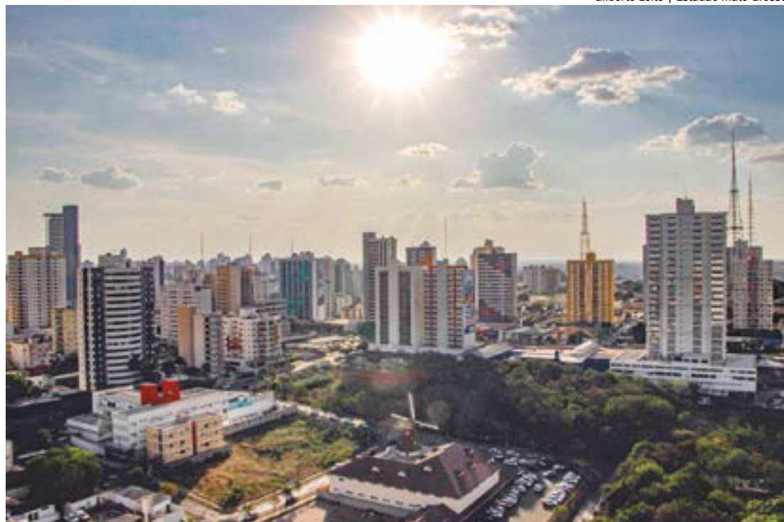
Gilberto Leite | Estadão Mato Grosso

DECRETO - Na última sexta-feira, 30 de agosto, o Governo de Mato Grosso declarou situação de emergência no estado devido à seca severa e aos incêndios florestais que atingem diversas regiões de Mato Grosso.