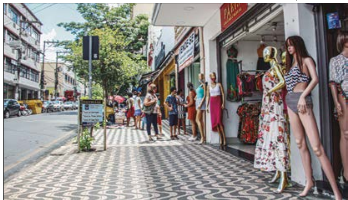
Os empresários que optarem por abrir as portas no próximo sábado (7) terão que pagar horas dobradas e comissões de vendas