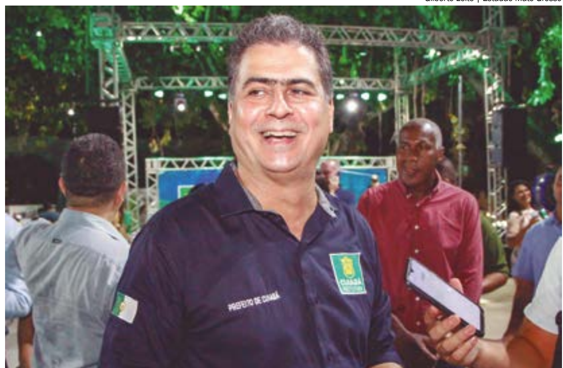
Para 36% dos entrevistados, a administração municipal é classificada como regular, enquanto 13% a avaliaram como boa

GAZETA DADOS - A pesquisa foi realizada entre 20 e 23 de agosto, utilizando a metodologia Survey, com entrevistas estruturadas em 182 bairros de Cuiabá, abrangendo todas as regiões do município. Foram entrevistadas 1.200 pessoas.