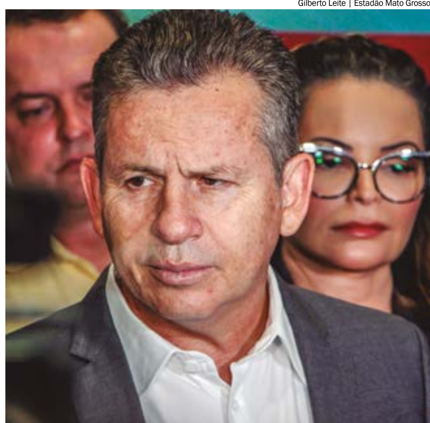
"A eleição vai se definir nos últimos 15 dias", afirmou o governador Mauro Mendes (União)

"O nosso candidato está na frente, é o candidato que eu reputo que tem a melhor condição de tirar Cuiabá do buraco, acredito nisso profundamente, e tem que trabalhar, tem que pedir voto, tem que ter humildade e não estar preocupado se é em primeiro ou em segundo turno. Tem que estar preparado. O grande desafio não é só ganhar eleição. O grande desafio é tirar Cuiabá do buraco, é fazer Cuiabá voltar a crescer como todo o estado de Mato Grosso está crescendo e Cuiabá ficou para trás nos últimos anos", concluiu.