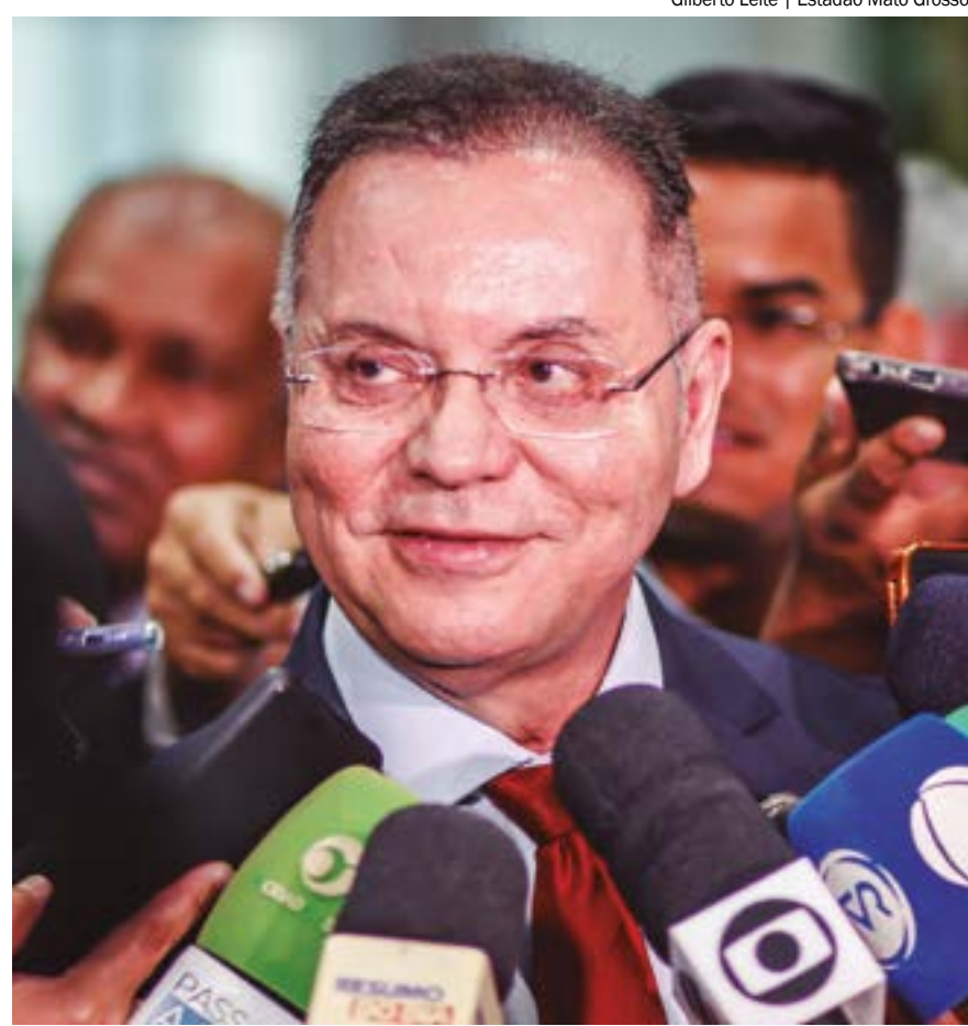
Conforme dados do DivulgaCand, foram três realizados repasses do partido: R$ 6,6 milhões, R$ 5 milhões e R$ 78,2 mil

O partido Novo renunciou ao repasse dos valores para financiar as campanhas eleitorais da legenda e sua cota será revertida ao Tesouro Nacional.