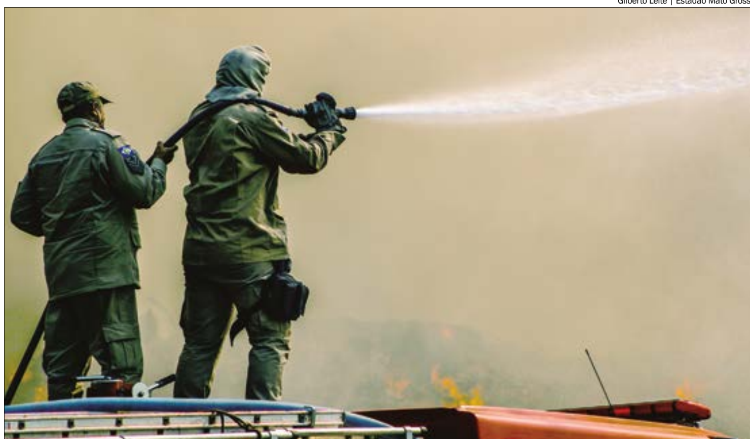
Medida leva em consideração as condições climáticas do Estado, como as altas temperaturas e a baixa umidade

BOMBEIROS EM AÇÃO - Desde o início do período proibitivo de uso do fogo, o Corpo de Bom-