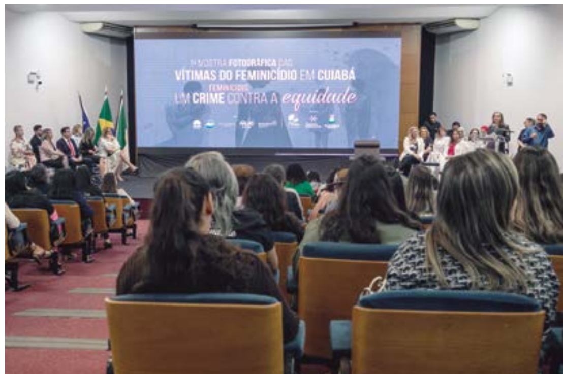
A 1ª Mostra Fotográfica das Vítimas do Feminicídio teve o conceito de sensibilização social com os números alarmantes de mulheres assassinadas