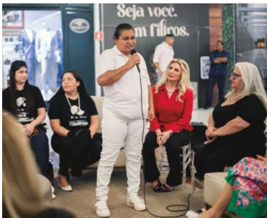
Familiares das vítimas expostas também fizeram seus relatos de vida