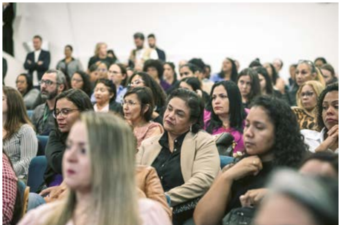
Mais de 200 pessoas participaram no lançamento do projeto de exposição fotográfica das vítimas de feminicídio de Cuiabá