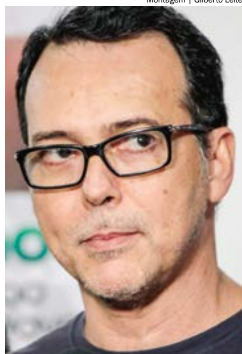
Já na espontânea, Botelho também lidera com 24%, Abilio aparece com 17%, Lúdio com 5% e Kennedy com 1%

nele de jeito nenhum. Já 20% dos entrevistados descartaram votar em Lúdio Cabral, e 10% dis-