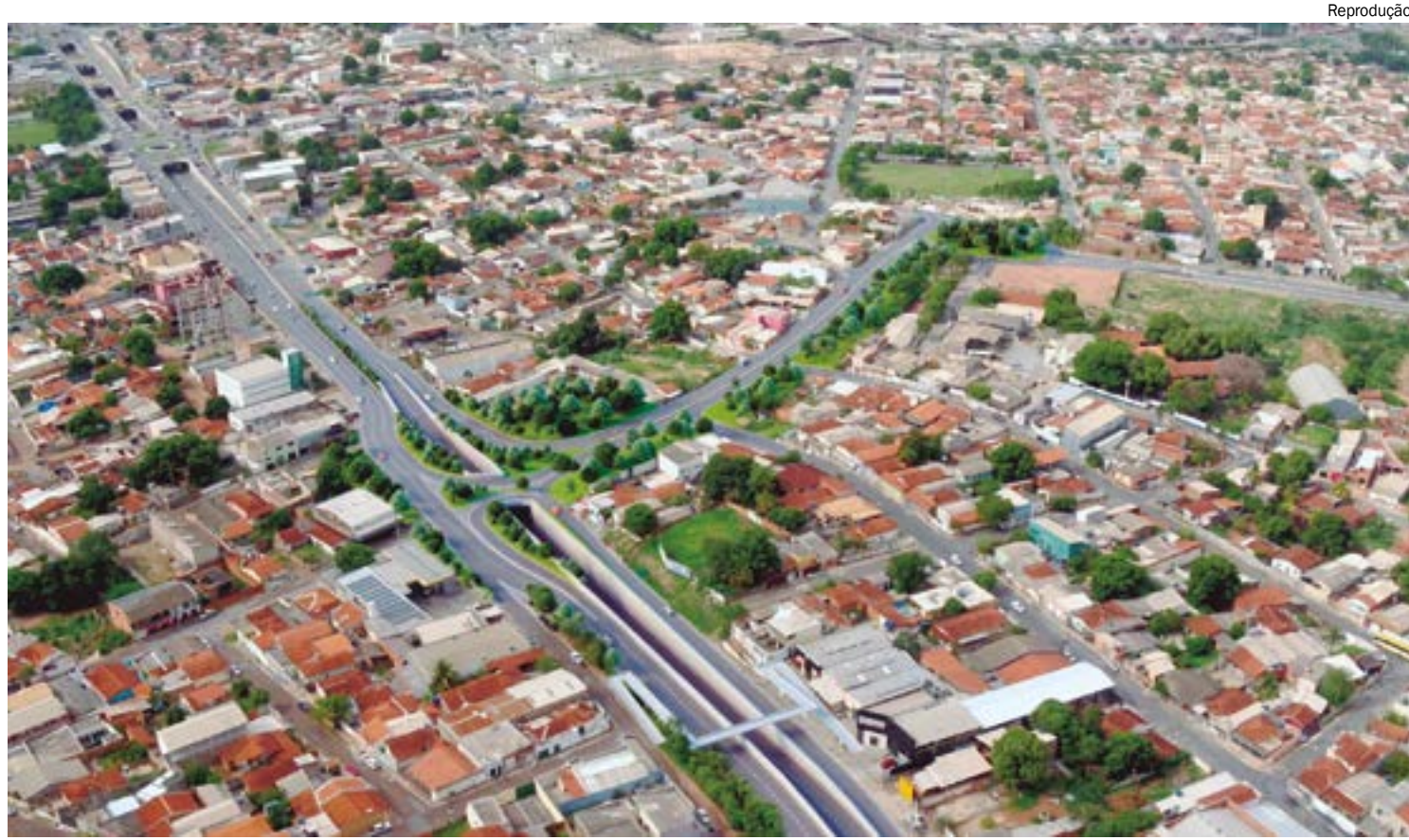
O chamado "Complexo Viário do Leblon" prevê a realização de três obras no entorno da trincheira Jurumirim

Anunciado pela Sinfra-MT em dezembro de 2023, os trabalhos na região não têm data para iniciar