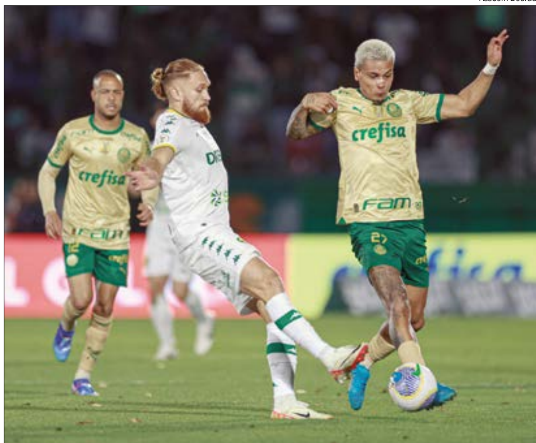
Petit lembrou que Pitta até teve uma chance de marcar o ‘gol de honra’, mas desperdiçou a oportunidade

Na 19ª colocação, com 18 pontos, o Cuiabá segue em situação delicada. O próximo desafio será contra o Criciúma, no sábado, 30. A bola rola na Arena Pantanal a partir das 17h30 (horário de MT).