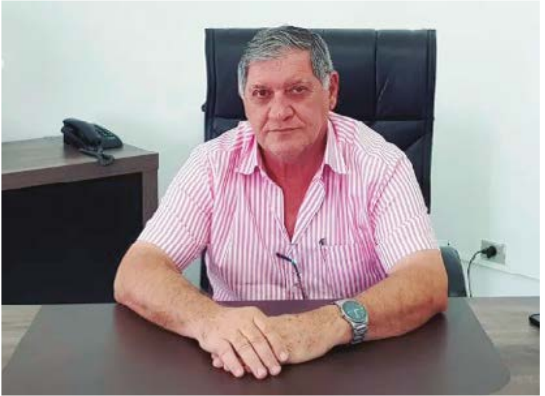
Assessoria de Imprensa