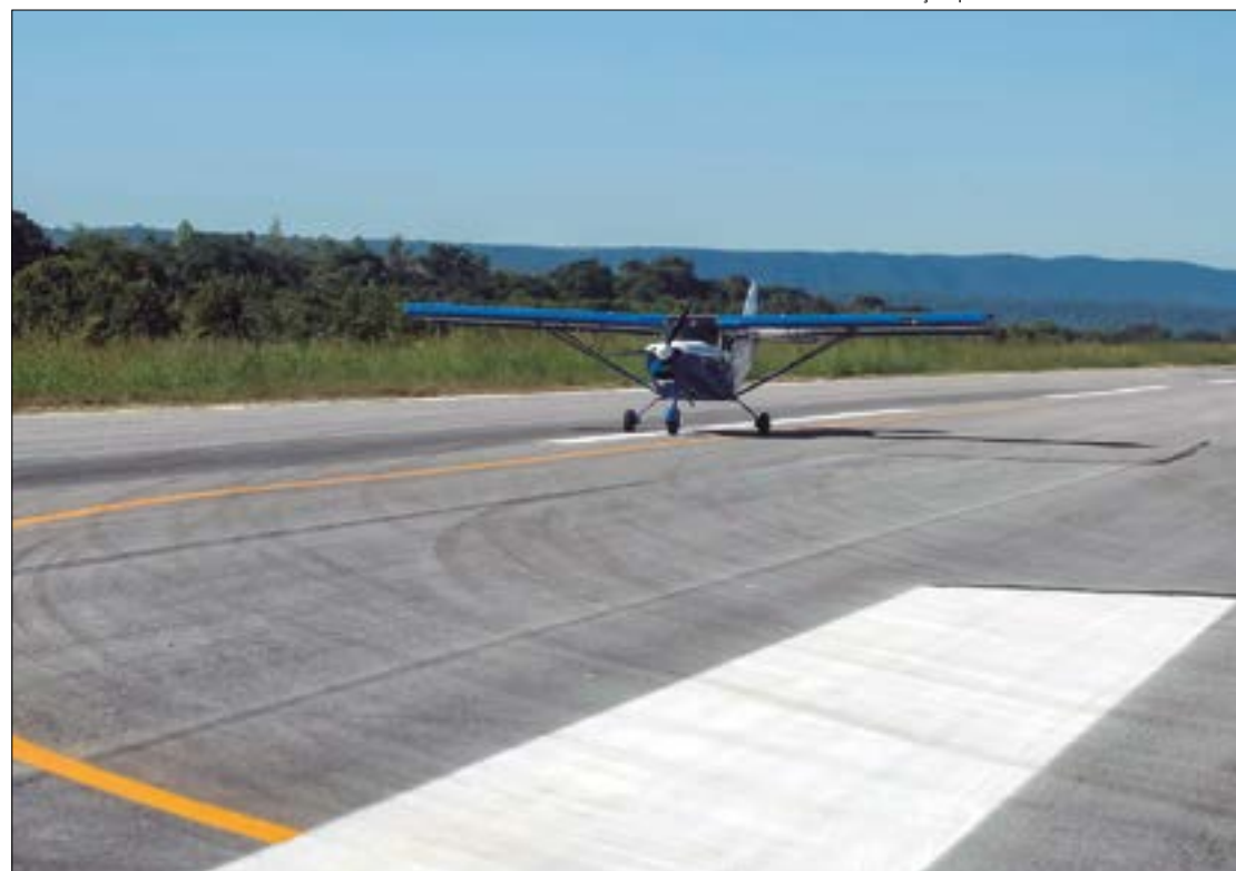
Este ano, o evento foi realizado no Aeroporto Executivo de Santo Antônio do Leverger, em Mato Grosso, com grande expectativa

Ilustração | Christiano Antonucci - Secom-MT