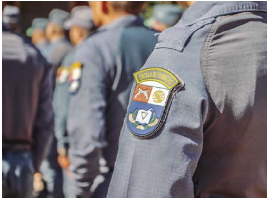
Eleição de associação é suspensa após comissão indeferir todas as candidaturas