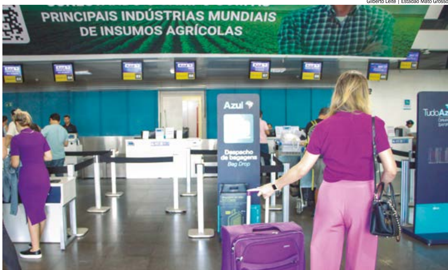
Cuiabá é uma das cidades contempladas com descontos e condições especiais do Feirão do Turismo

OUTROS PROGRAMAS - O Governo Federal também tem implementado diversas iniciativas para incentivar o turismo doméstico, permitindo que mais brasileiros conheçam o próprio país. Um exemplo é o programa "Conheça o Brasil: Voador", uma parceria entre o Ministério do Turismo,