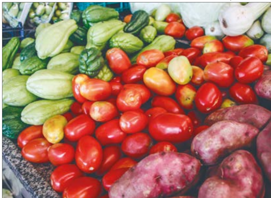
O tomate foi o principal item que contribuiu para a elevação do preço, com variação de 12,72%, apresentando um custo médio de 4,78/kg

Por fim, Cunha concluiu que a elevação no custo