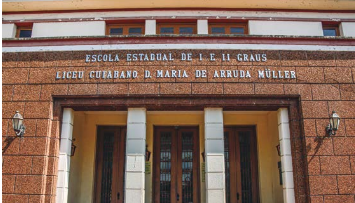
A instituição chegou a pensar que e-mail era "fantasioso", pois não apresentava informações sobre o motivo do encerramento das aulas