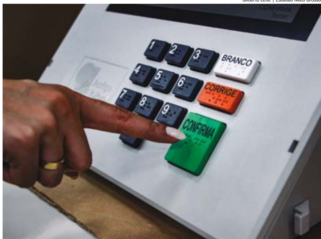
A representação ainda é considerada baixa, em comparação à porcentagem de mulheres eleitoras, que é de 51%

"Quando as mulheres ocupam espaços de poder e decisão, trazem consigo perspectivas únicas que refletem as necessidades e interesses de metade da população. Além de enriquecer o debate político, isso promove a criação de políticas públicas mais equitativas e sensíveis às questões de gênero. A presença de mulheres na política também serve como um poderoso exemplo para as futuras gerações, mostrando que elas podem e devem participar ativamente