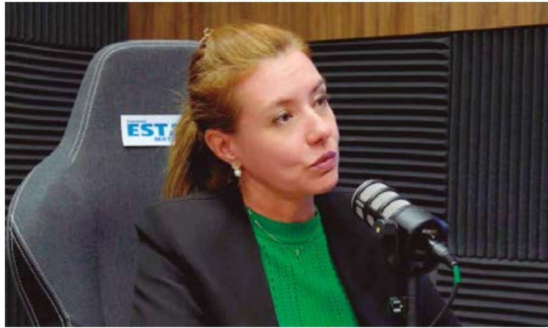
A candidata bolsonarista também propõe a criação de escolas em tempo integral e profissionalizantes

como a criação de escolas em tempo integral e profissionalizantes, com o objetivo de transformar e fortalecer o sistema educacional do município.