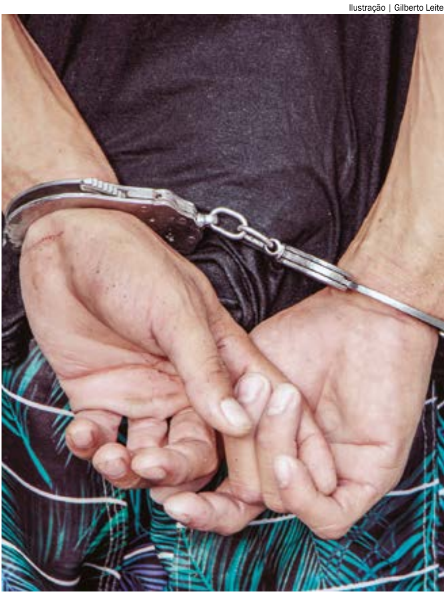
Ilustração | Gilberto Leite