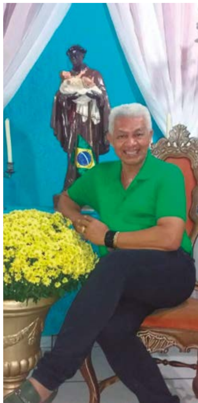
Ícone cuiabano Carlinhos Alves Corrêa