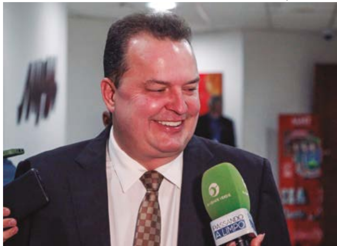
Max enfatizou que o PSB deve ser o partido com o maior número de prefeitas eleitas em Mato Grosso