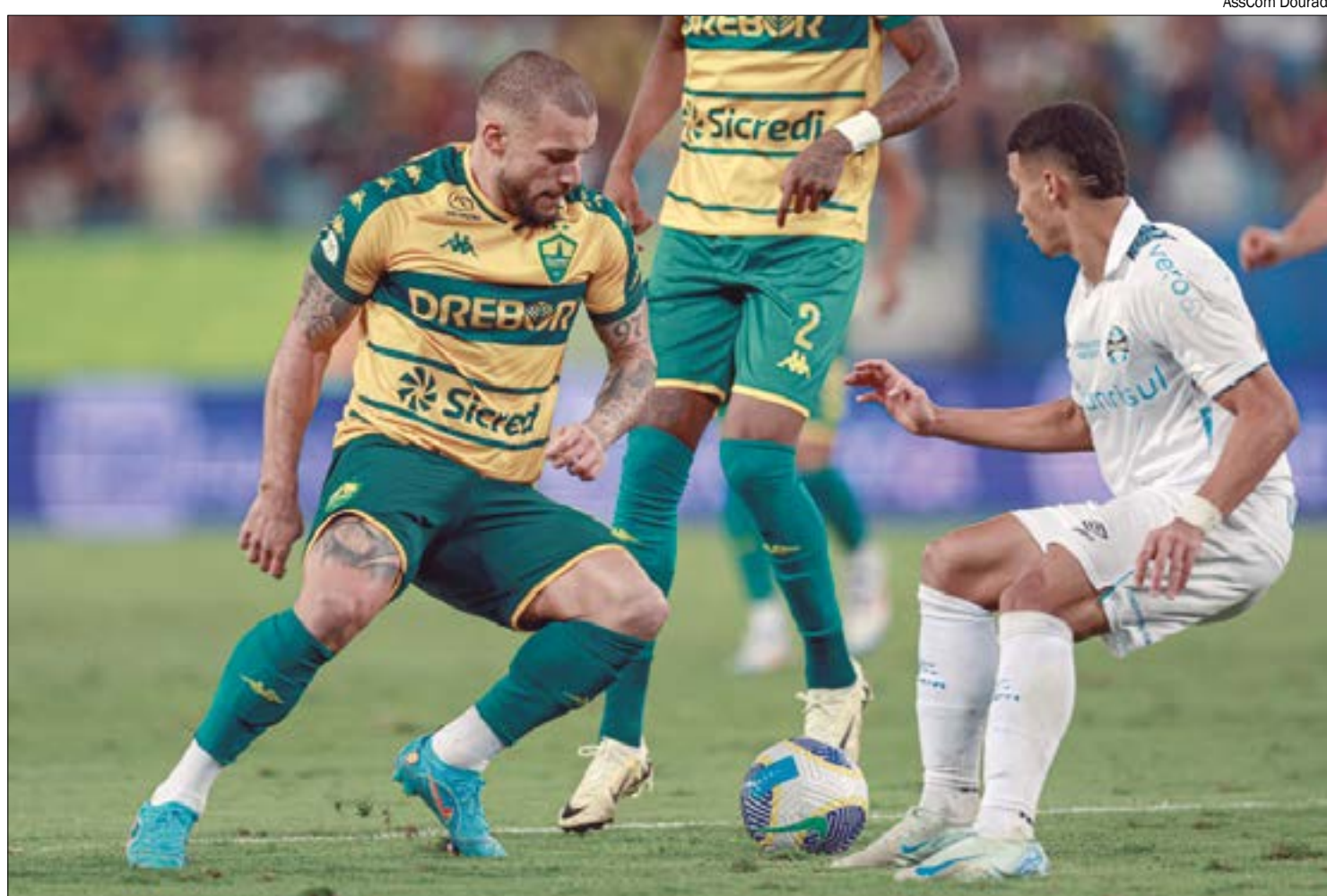
Dourado até criou mais chances de gol, mas não soube aproveitá-las e acabou sendo goleado pelo Grêmio

Entretanto, os problemas de finalização persistiram. Enquanto o Grêmio precisou de apenas cinco finalizações para marcar