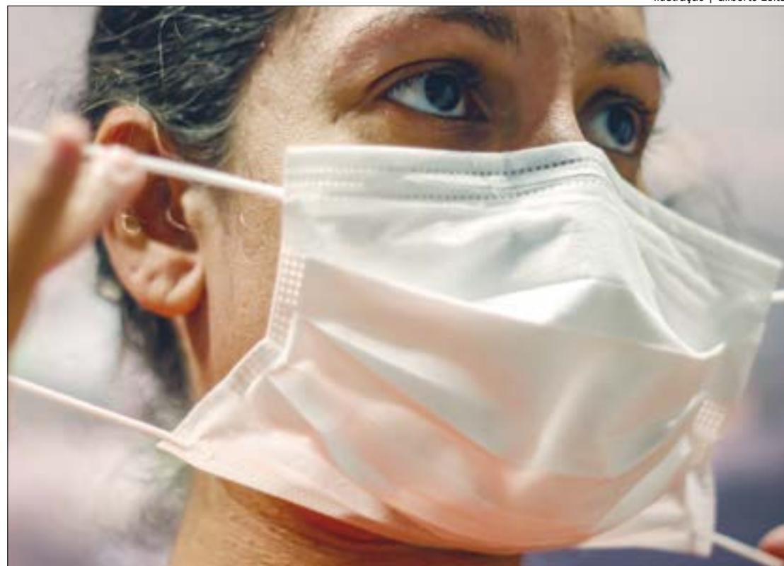
Ilustração | Gilberto Leite

Serão destinados R$ 5,4 milhões para ações de vigilância, prevenção e controle de doenças