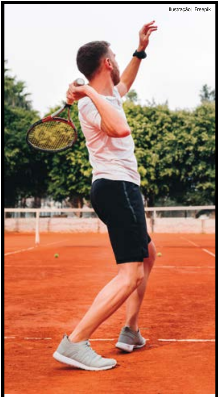
Ilustração | Freepik