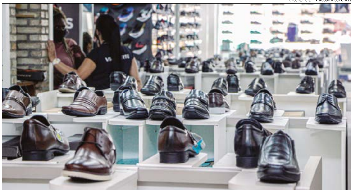
A preferência da maioria é por presentes voltados ao setor de vestuário (47%), seguido de calçados (40%), depois perfumaria (30%)