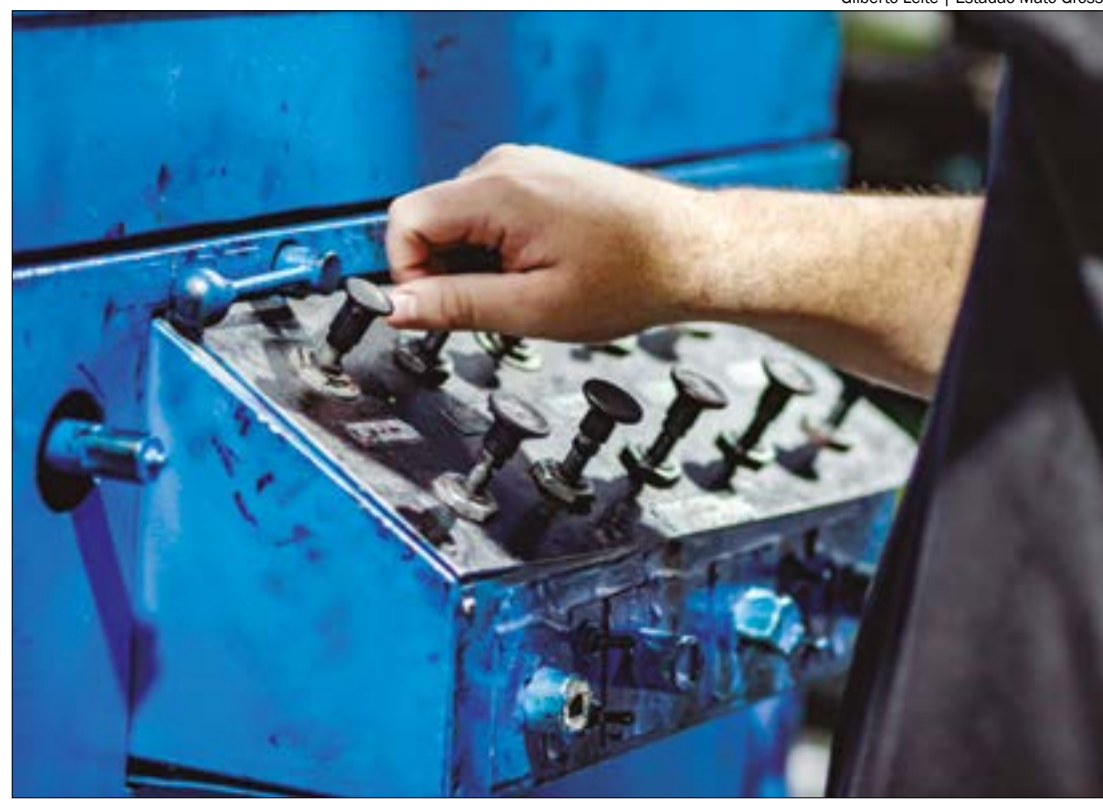
Gilberto Leite | Estadão Mato Grosso

A Receita também apontou destaque o resultado da arrecadação do Imposto sobre a Renda da pessoa Física (IRPF), que apresentou um aumento real de 21,26%, em função da atualização de bens e direitos de brasileiros no exterior.