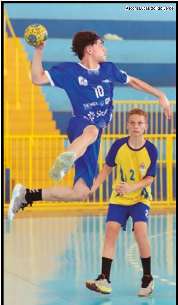
Ascom Lucas do Rio Verde

JOVENS ATLETAS DE MT BUSCAM O TÍTULO ESTADUAL DOS JOGOS ESCOLARES