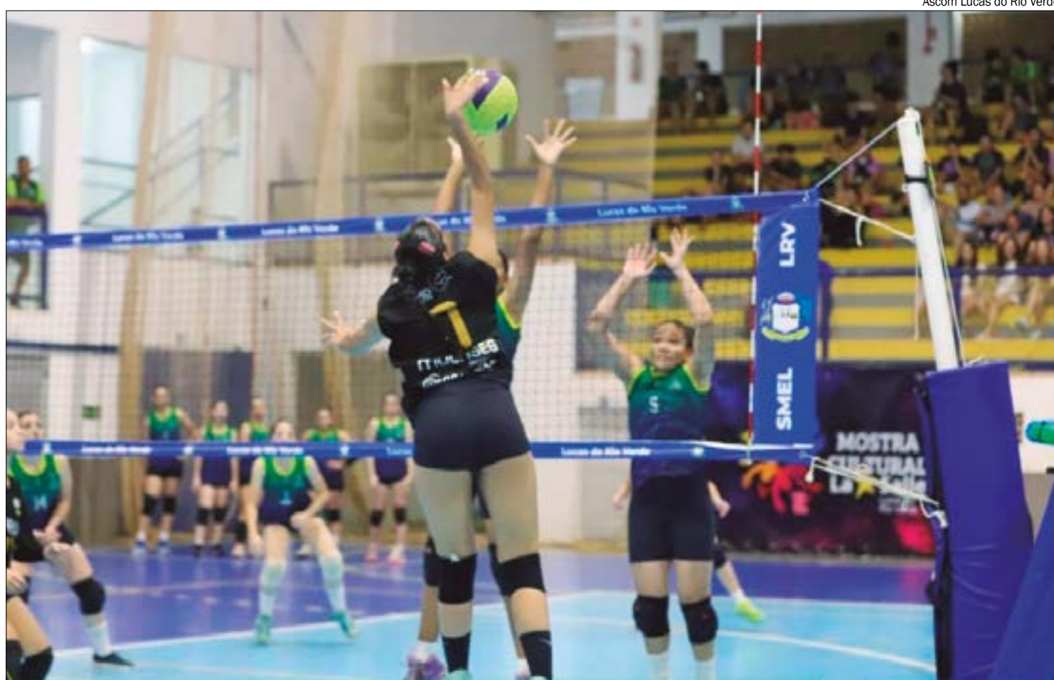
Competição reúne equipes escolares com atletas de 12 a 14 anos em disputas pelos títulos estaduais

No total, 89 equipes escolares de 42 municípios mato-grossenses competem na etapa estadual da competição. Campeãs nas etapas regionais de sua modalidade e gênero, as equipes agora competem pelos títulos de campeãs mato-grossenses e as respectivas vagas para representar o Estado na fase nacional.