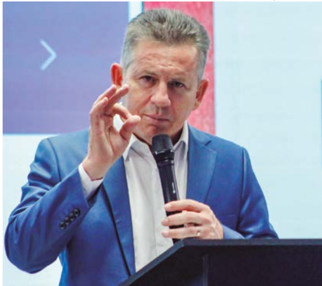
Devido a essa situação fiscal mais 'confortável', Mauro avalia que um eventual corte de gastos da União não deve impactar o estado