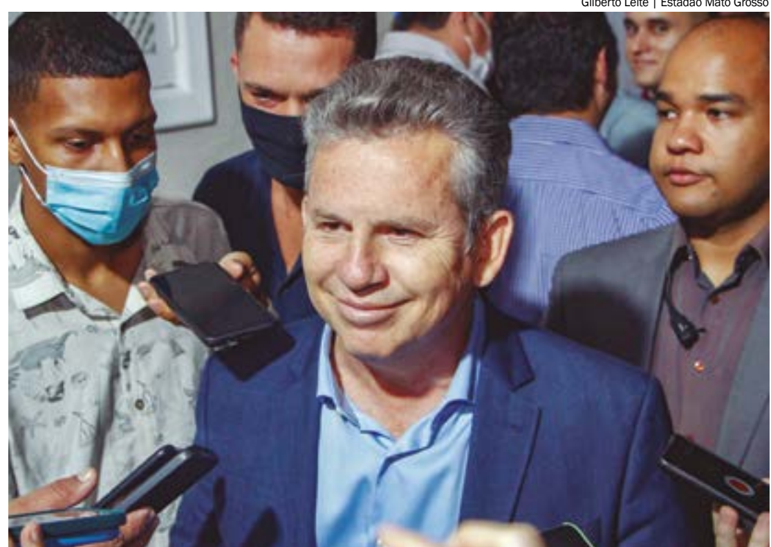
Gilberto Leite | Estadão Mato Grosso