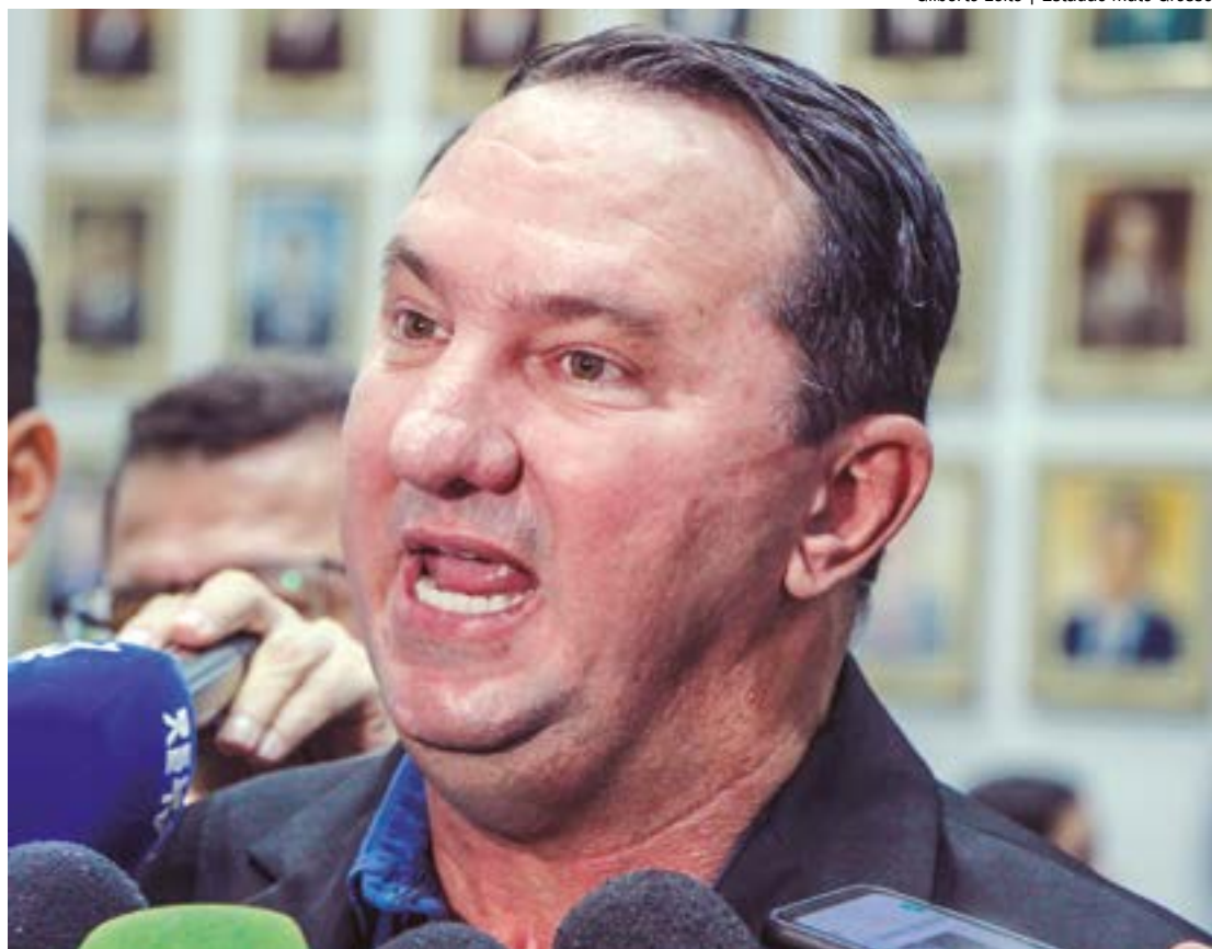
Barranco critica o governador Mauro Mendes: "Enquanto mulheres morrem com a Lei da Pesca, ele pensa no glamour"

Acontece que as 12 espécies proibidas de pescar e transportar (Cachara, Caparari, Dourado, Jaú, Matrinchá, Pintado/Surubim, Piraíba, Piraputanga, Pirara, Pirarucu, Trairão e Tucunaré) compõem 90% do pescado artesanal em Mato Grosso.