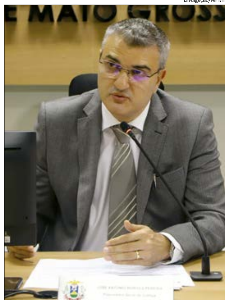
MP decide que escolha da lista sêxtupla será feita por todos os membros do órgão

Este ano o Tribunal de Justiça de Mato Grosso (TJMT) aprovou a criação de nove novas vagas para desembargadores. Destas, uma pertence ao MP e outra à OAB.