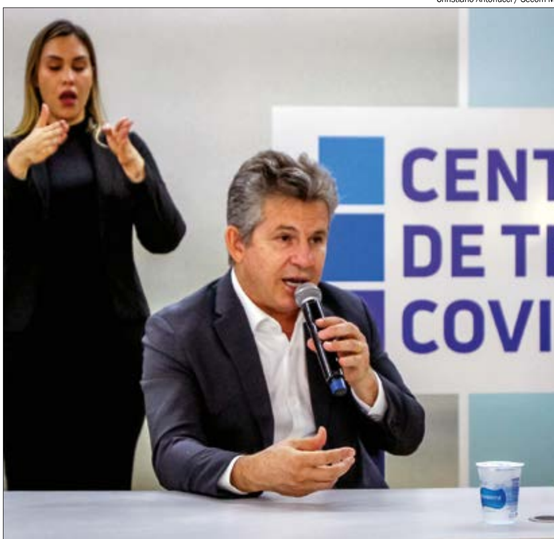
Governador decidiu liberar o funcionamento de academias e salões de beleza, mesmo durante a quarentena

O decreto estadual citava que as atividades essenciais seriam as mesmas listadas no decreto de Bolsonaro, com exceção de academias e salões de beleza. Posteriormente, o decreto estadual foi alterado para permitir o