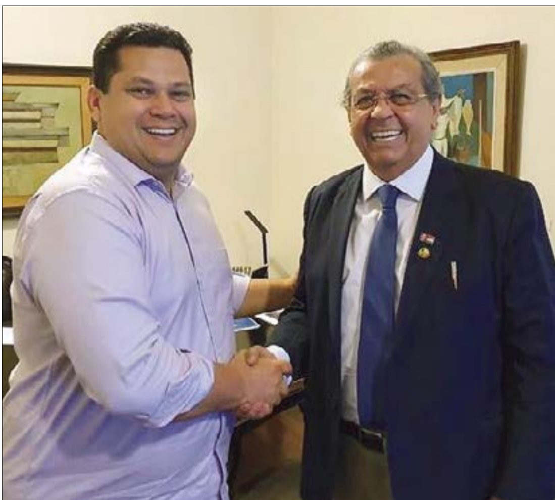
Os senadores Davi Alcolumbre, presidente do Senado Federal e Jayme Campos, ambos do DEM, trabalharam pela liberação de R$ 40 milhões para atender 106 cidades de Mato Grosso com recursos para enfrentar a pandemia da Covid-19