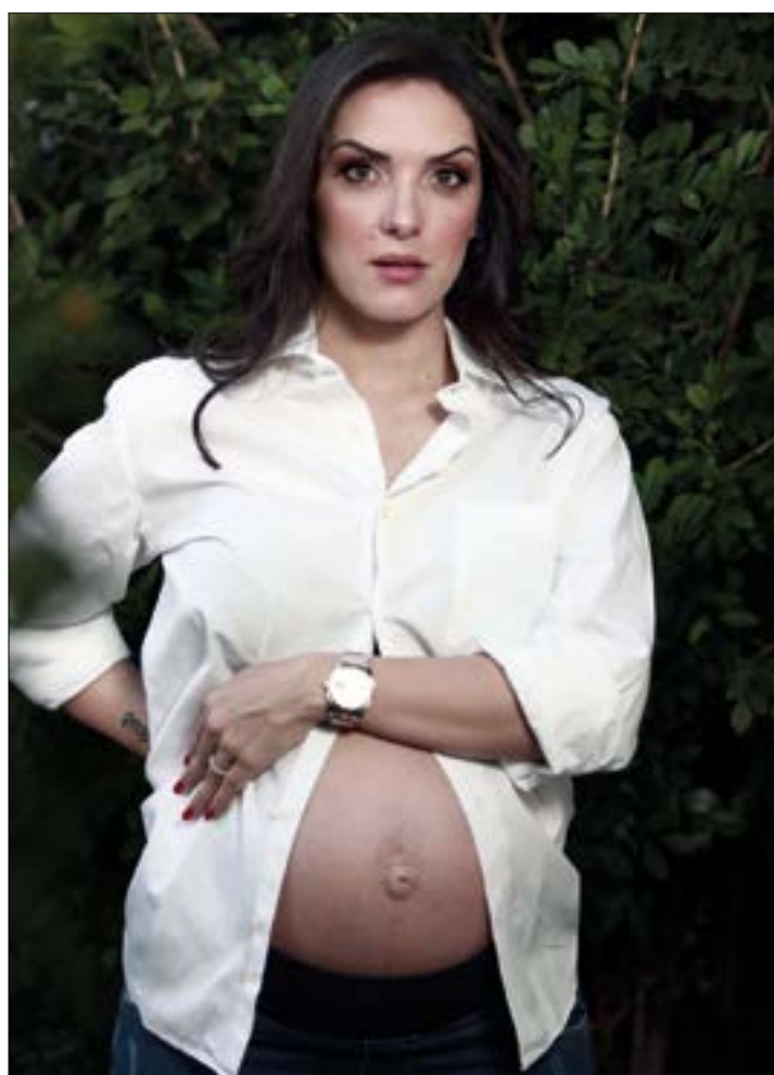
A sempre encantadora deputada estadual Janaína Riva, ativa comandante do Bloco Parlamentar Resistência Democrática, na Assembleia de MT