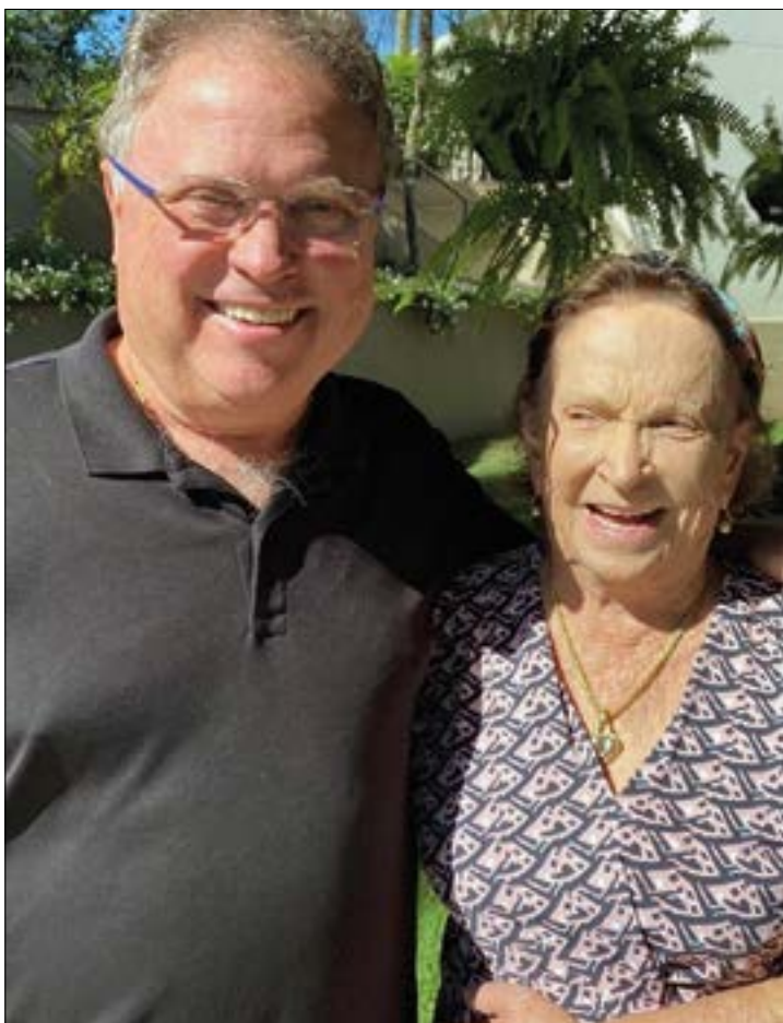
Sempre aplaudido internacionalmente como empresário e como grande líder político brasileiro, Blairo Maggi com sua mãe Lúcia Maggi, ilustre aniversariante do fim de semana