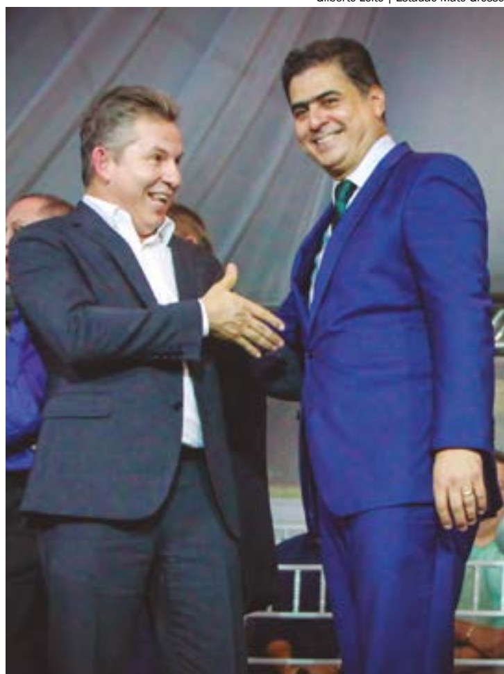
Mendes 'levantou bandeira branca' e disse que, se for preciso, irá trabalhar com o prefeito Emanuel Pinheiro em prol dos camelôs

o governador disse que não pode falar "pelos cotovelos" e que há regras a serem seguidas.