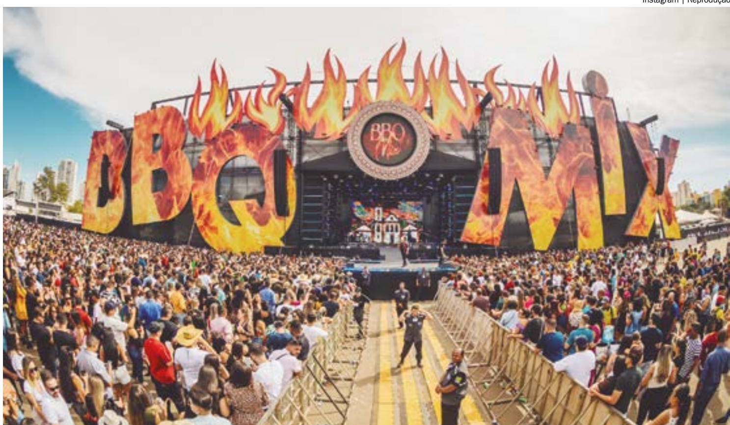
O evento que une gastronomia e música de qualidade está marcado para o dia 12 de outubro, na Acrimat

Mais informações serão divulgadas em breve no Instagram oficial do evento @BBQ.MIX.