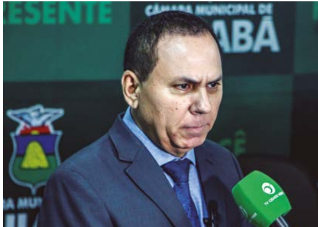
Dilemário foi criticado por votar favorável ao empréstimo e justificou: "O dinheiro só chegará quando Cuiabá tiver um novo gestor"