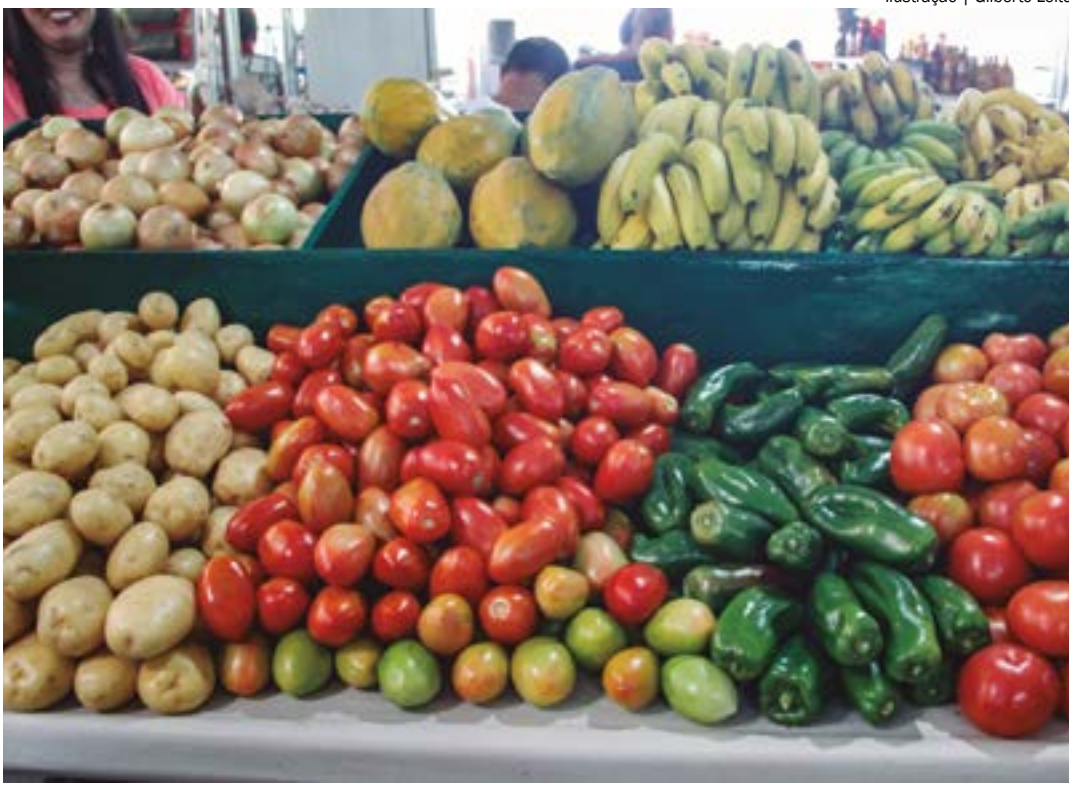
Ilustração | Gilberto Leite

A Associação Brasileira da Indústria de Alimentos (ABIA) anunciou investimentos significativos de R$ 120 bilhões para 2023-2026, visando expansão, modernização e pesquisa. Este movimento segue o recente aporte de R$ 130 bilhões pelo setor automotivo. O anúncio ocorreu em reunião com o presidente Lula e o ministro Alckmin, destacando alinhamento com programas como Brasil Mais Produtivo e Depreciação Acelerada. A indústria alimentícia, líder mundial em exportações, fortalece a economia, com crescimento de 8,4% nas exportações no primeiro semestre de 2024, consolidando-se como pilar essencial para o Brasil