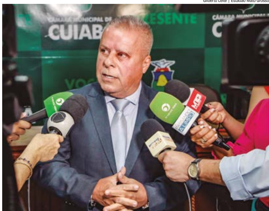
Chico 2000 afirmou que a "religião de cada um deve ser respeitada" e que a religiosidade deve ser tratada no "seio familiar"

Entretanto, a obrigatoriedade do ensino religioso no Brasil é inconstitucional, já que o país é laico. O ensino de qualquer religião é facultativo; ou seja, a escola pode oferecer a disciplina, mas os alunos têm o direito de não a frequentar, conforme suas convicções familiares.