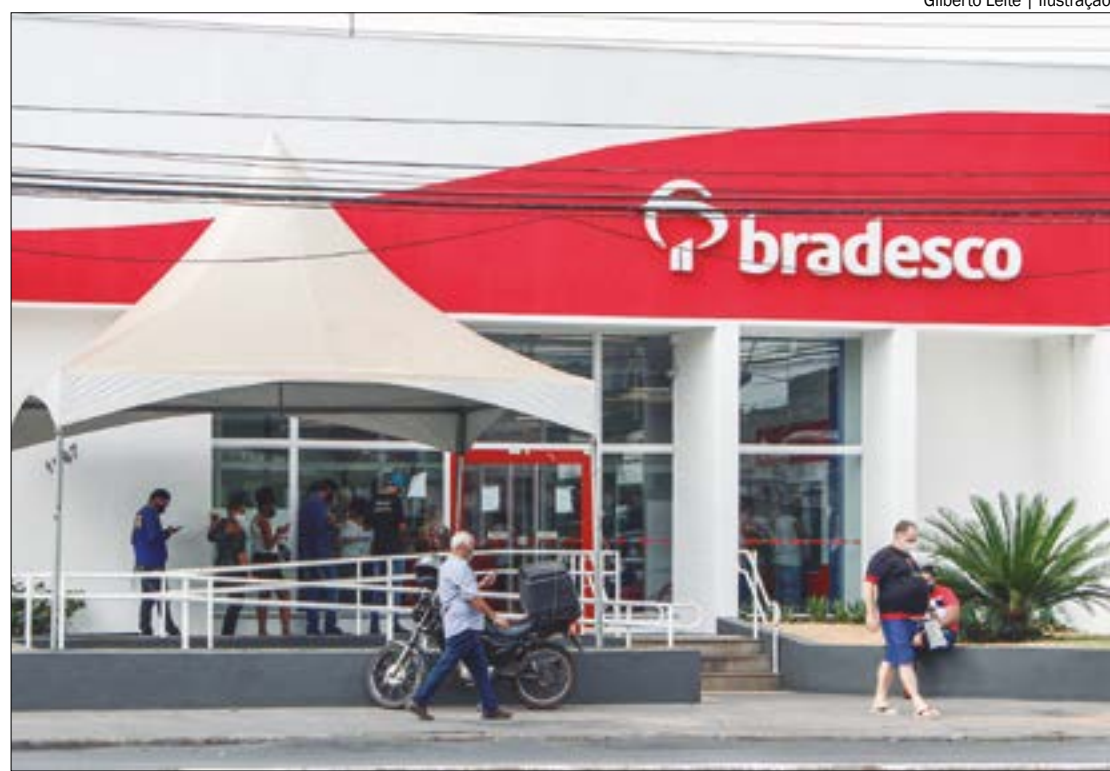
O FGTS teve, em 2023, lucro recorde de R$ 23,4 bilhões, quase o dobro dos R$ 12,1 bilhões registrados no ano passado