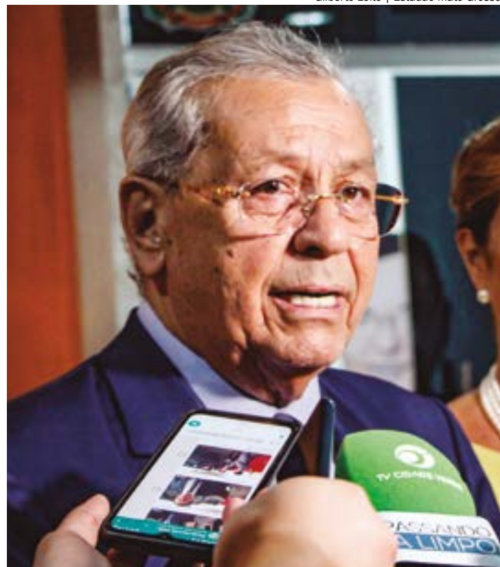
Para Jayme, Carlos Bolsonaro (PL), filho do ex-presidente Jair Bolsonaro, deve morar em MT para disputar uma vaga pelo estado