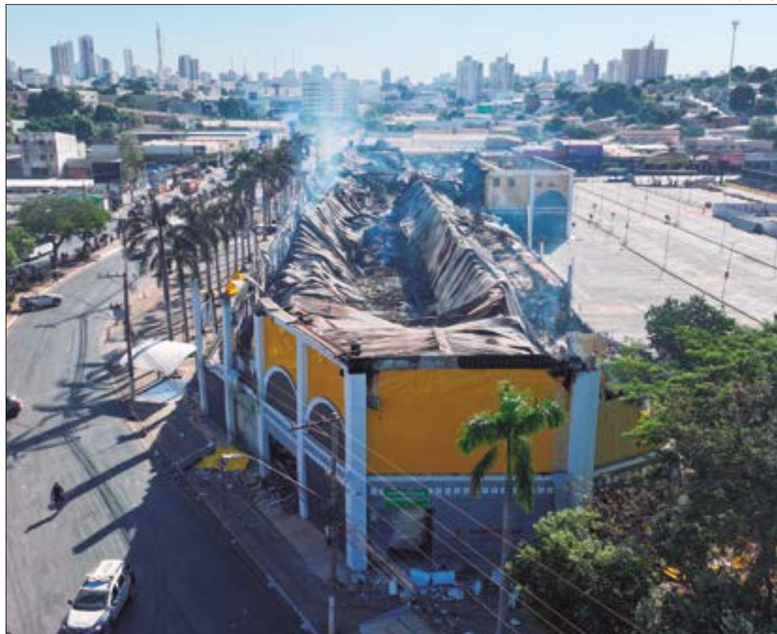
Completamente destruído, o centro comercial abrigava a 600 lojas gerando mais de três mil empregos diretos e indiretos

Segundo ele, ainda não é possível estabelecer uma data exata agora, mas, se depender exclusivamente dele, não haverá nenhum problema. "Estamos aqui para resolver problemas e encontrar soluções. Pretendo que, já no início da semana que vem, possa-