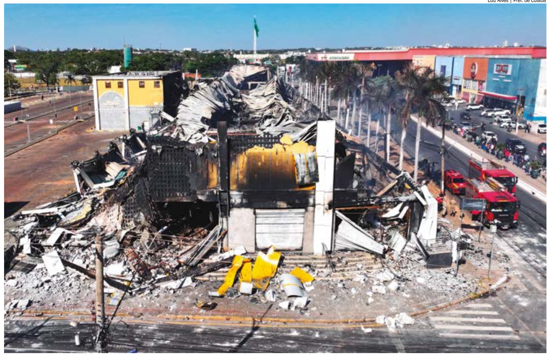
Luiz Alves | Pref. de Cuiabá