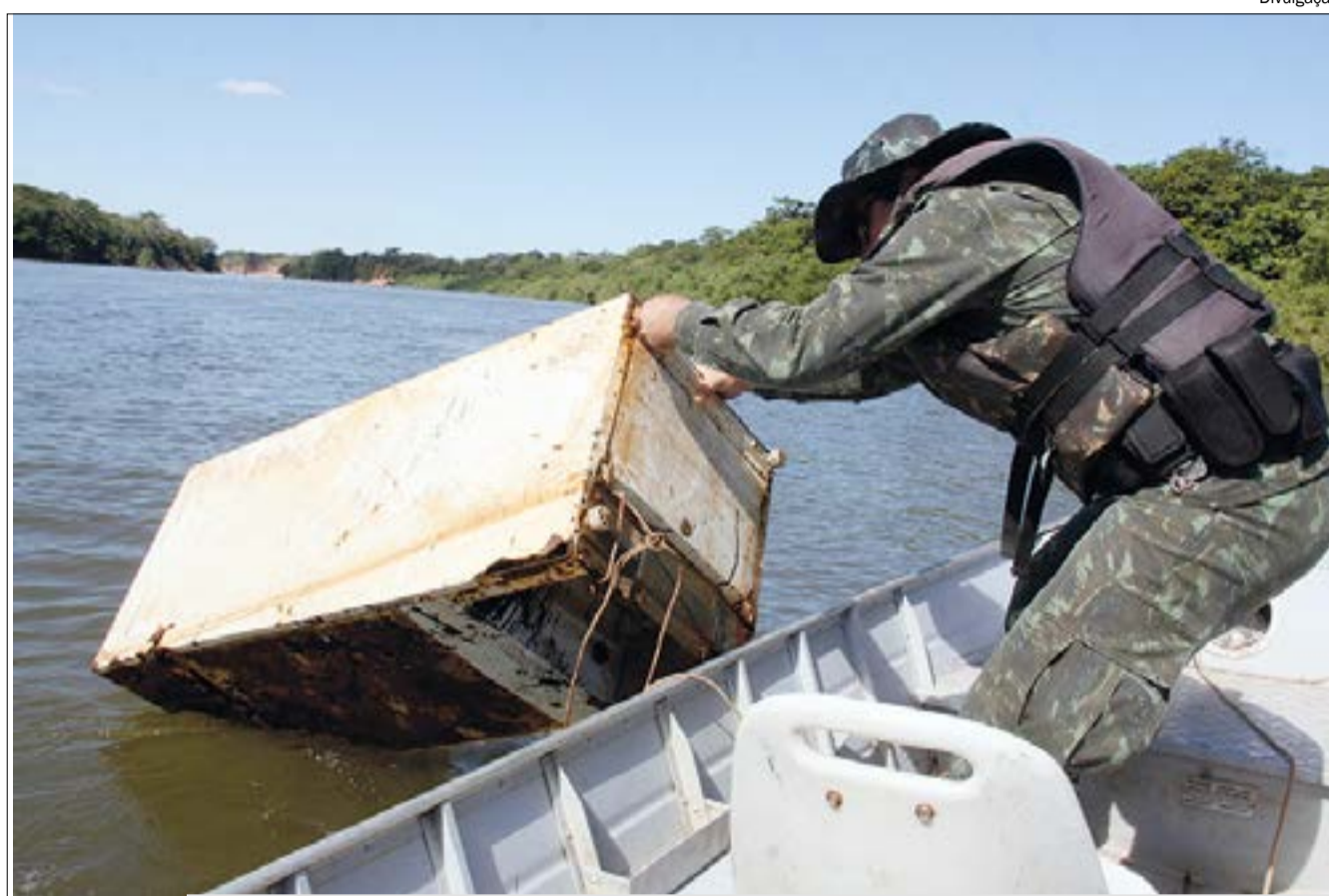
Balsa Ecológica tem capacidade de recolher qualquer tipo de material, até geladeiras

Apesar da relevância da ação para a preservação do meio ambiente, a Prefeitura não chegou a articular com os demais municípios que são banhados pelo rio