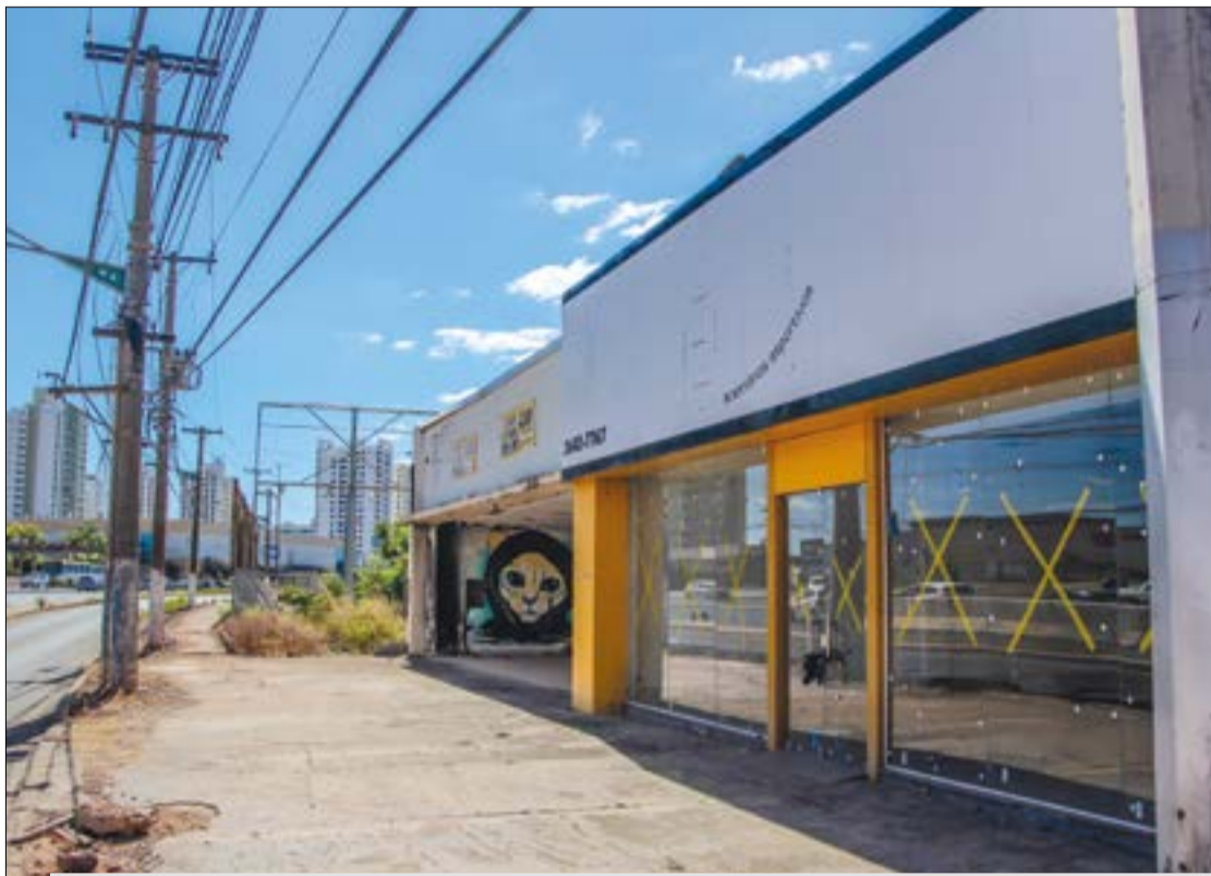
Tudo que sobrou do investimento de mais de R$ 450 mil foi o escrito 'acessórios esportivos' na fachada do imóvel abandonado