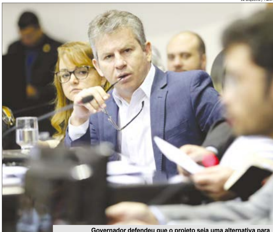
Governador defendeu que o projeto seja uma alternativa para retomada do crescimento econômico do país

O projeto da Frente Parlamentar Agropecuária (FPA) e setores da indústria retira a necessidade de licenciamento ambiental para grandes investimentos de infraestrutura no Brasil. A iniciativa conta com apoio de ministros e tramita no Congresso em regime de urgência urgentíssima, com perspectiva de ser