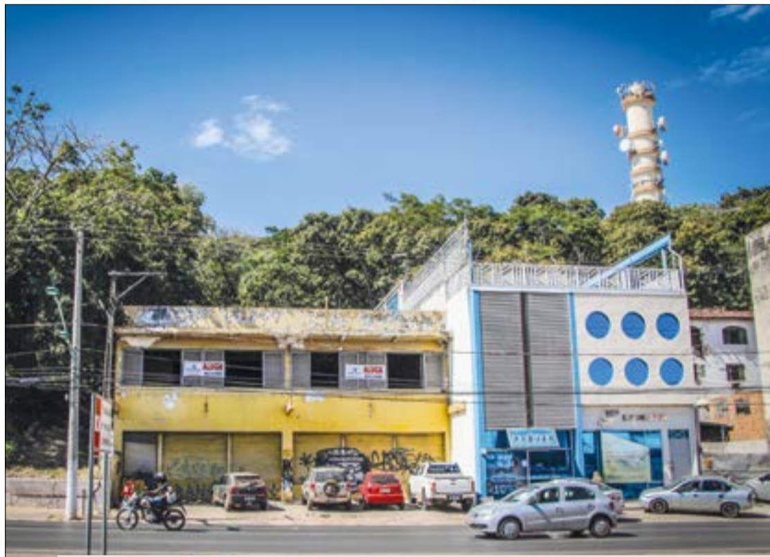
Prédios do entorno do Morro da Luz sofreram pressão para desapropriação por uma obra que nunca saiu