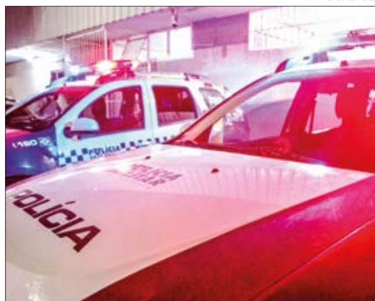
Homem marcou encontro com garota de programa e a estuprou dentro do carro

A vítima procurou imediatamente ajuda em uma Unidade de Pronto Atendimento (UPA), onde recebeu medicação. A jovem não conseguiu passar detalhes do acusado para a polícia, mas a equipe deverá utilizar imagens de segurança dos locais por onde o carro passou para chegar até o suspeito. (J.O.)