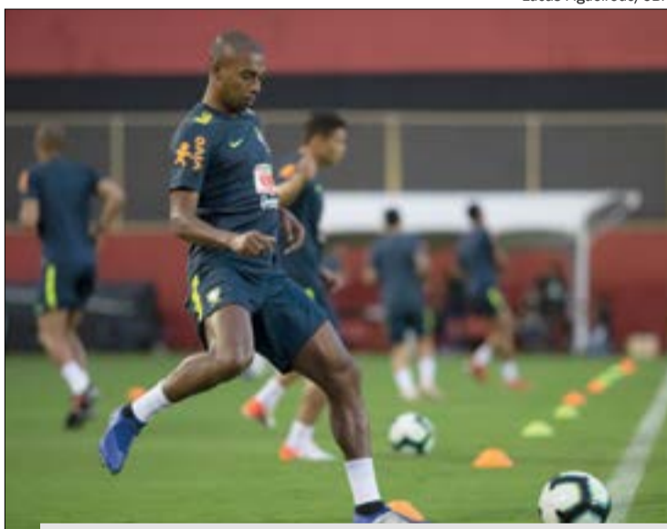
Fernandinho voltou aos treinos e pode jogar na quinta

O volante Fernandinho voltou aos treinos no gramado neste domingo na reapresentação da seleção brasileira, no CT do São Paulo. O jogador do Manchester City está se recuperando de dores no joelho direito e havia ficado fora da goleada por 5 a 0 sobre o Peru na Arena Corinthians, no sábado, pela rodada final da fase de grupos da Copa América. Neste domingo, ele realizou seu primeiro treinamento com bola juntamente com o restante do elenco.