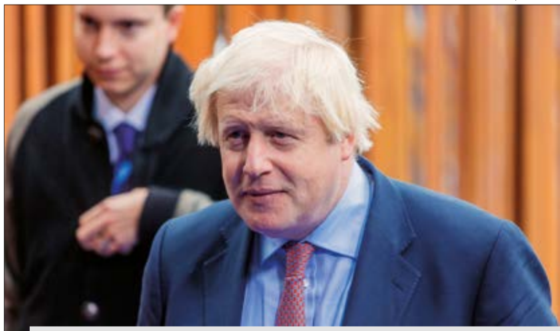
Briga com a namorada pode tirar Boris Johnson (foto) da disputa ao cargo de premiê