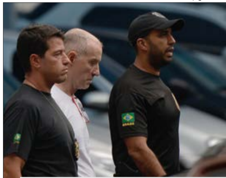
Empresário Eike Batista deixa a sede da PF após depoimento em abril de 2016

crimes de corrupção e lavagem de dinheiro, acusado de pagar propina de US$ 16,5 milhões (cerca de R$ 60 milhões) ao ex-governador Cabral. Em dezembro do ano passado, o empresário já teve um iate de luxo - com capacidade para 21 passageiros e com quatro quartos, sendo duas suítes com sauna e closet - leiloado por R$ 14,4 milhões.