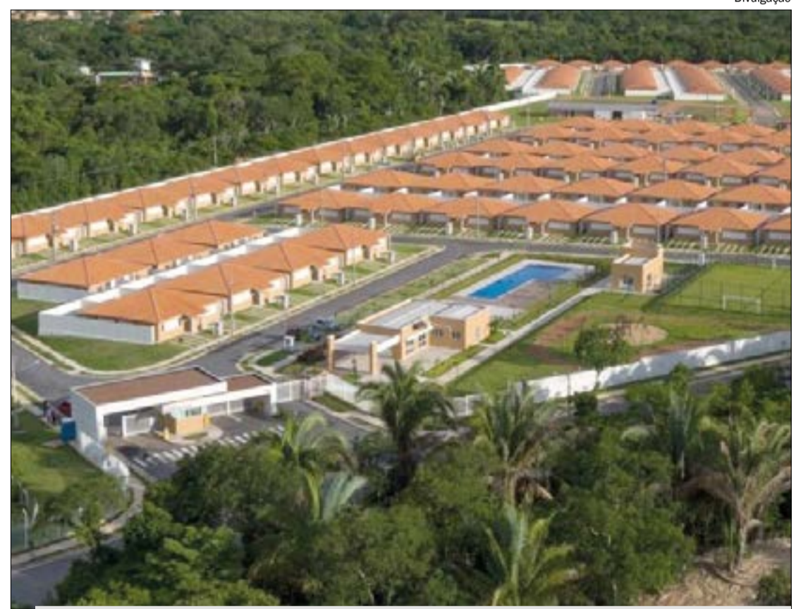
Contrato previa entrega em dois anos, mas até hoje a cliente não recebeu o imóvel