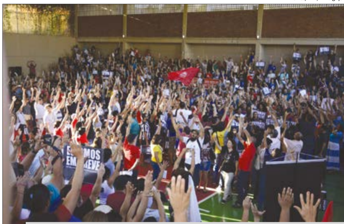
Servidores decidiram manter greve da Educação e prometem fechar rodovias de MT