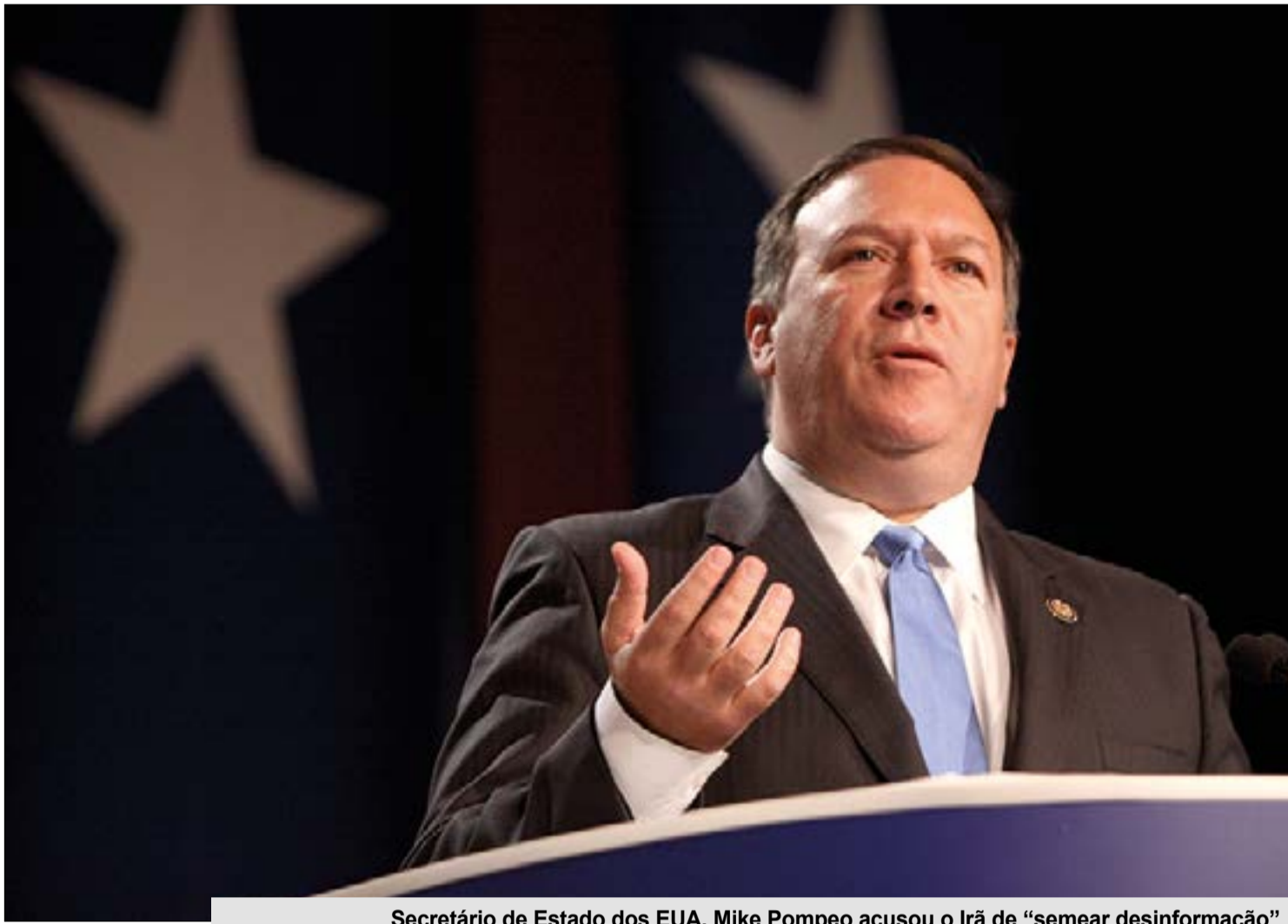
Secretário de Estado dos EUA, Mike Pompeo acusou o Irã de “semear desinformação”

O vice-chanceler do Irã, Abbas Araçchi, dis-