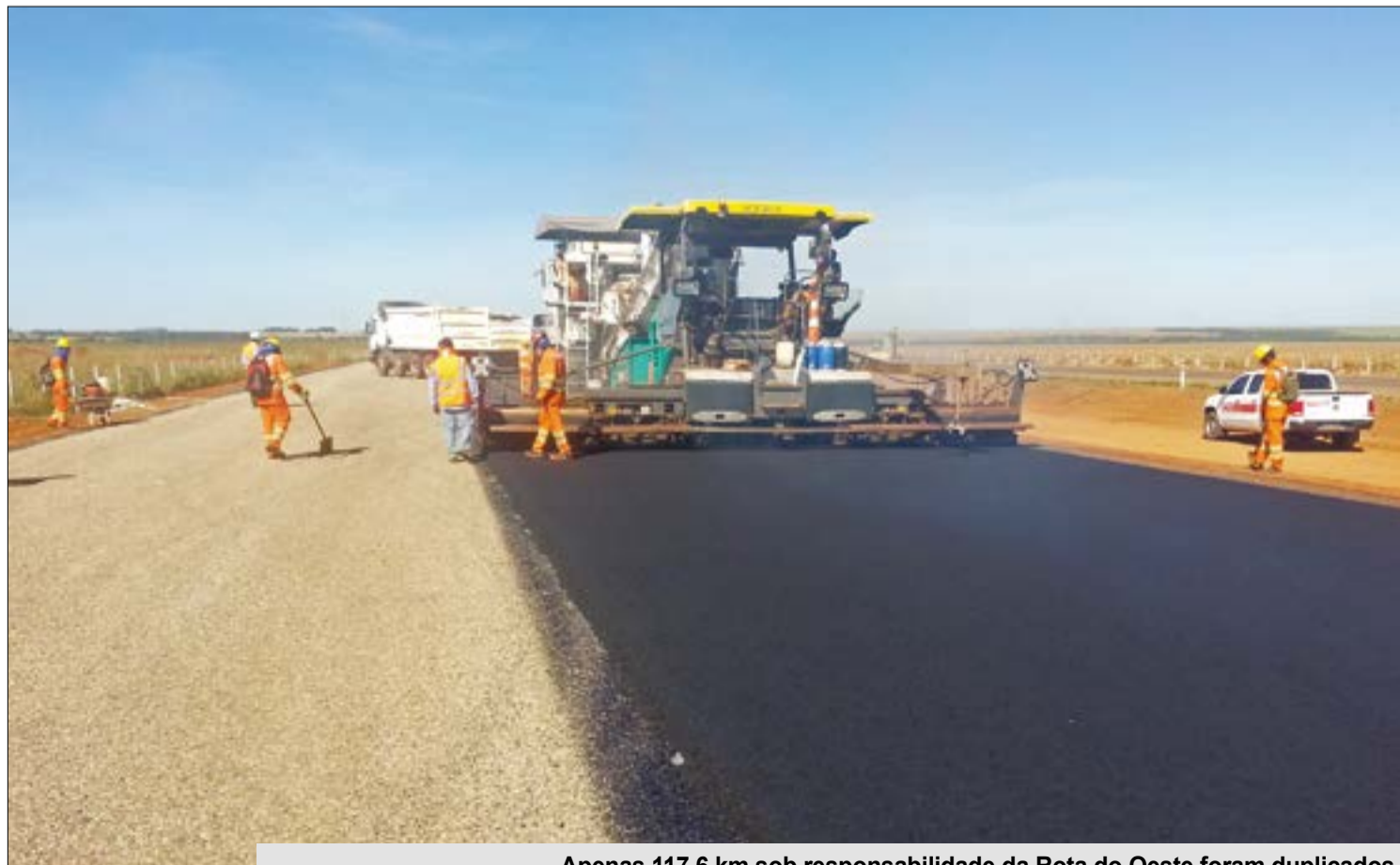
Apenas 117,6 km sob responsabilidade da Rota do Oeste foram duplicados

"A decisão não afeta diretamente o funcionamento da Rota do Oeste em Mato Grosso e nem impacta atividades da empresa e compromisso com o usuário da rodovia, funcionários e fornecedores", reforça.