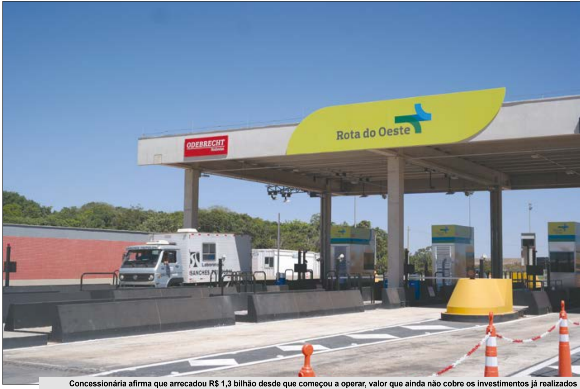
Concessionária afirma que arrecadou R$ 1,3 bilhão desde que começou a operar, valor que ainda não cobre os investimentos já realizados

"As propostas têm como finalidade garantir o equilíbrio eco-