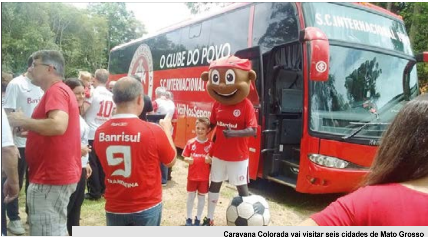
Caravana Colorada vai visitar seis cidades de Mato Grosso