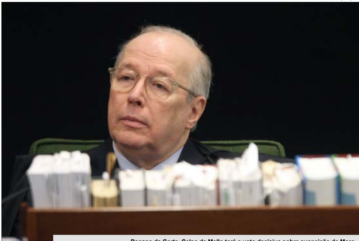
Decano da Corte, Celso de Mello terá o voto decisivo sobre suspeição de Moro

A defesa do petista acusa o ex-juiz da Lava Jato de "parcialidade" e de agir com "motivação política" ao condenar Lula no caso do triplex.